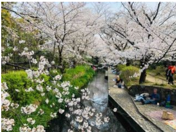
渋川沿いの桜歩道

★渋川の住吉桜と二ヶ領用水の桜・桃の競演。歴史ある寺社や緑溢れる等々力緑地等を巡ります。