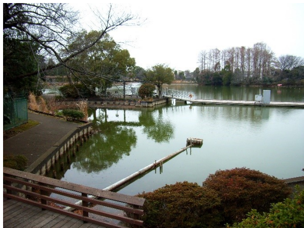
水と緑の等々力緑地