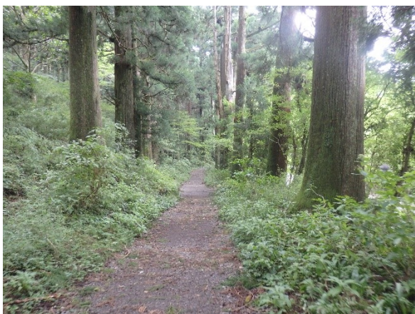
箱根旧街道杉並木道