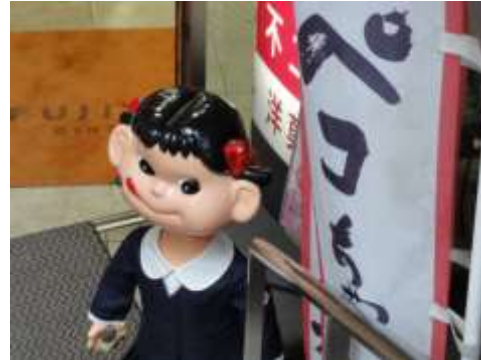
神楽坂商店街とペコちゃん