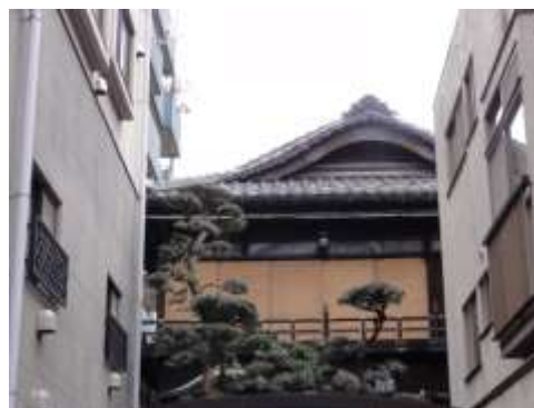
かくれんぼ横町と本多横丁で