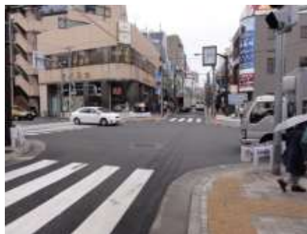
善国寺几号水準点と東西線神楽坂駅付近の神楽坂の最高所