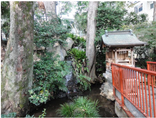
清水窪弁財天（湧水）