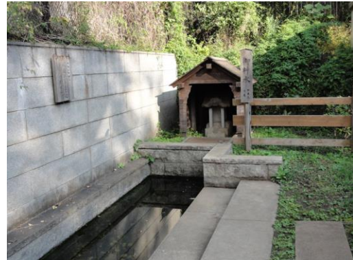
コースから離れるが、山王花清水公園（湧水（右））