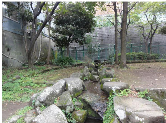
東山貝塚公園（湧水）