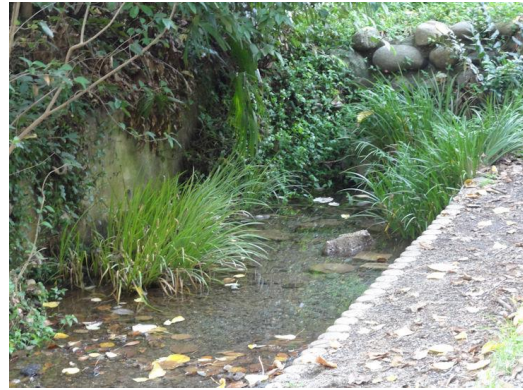
駒場東大坂下門（湧水）