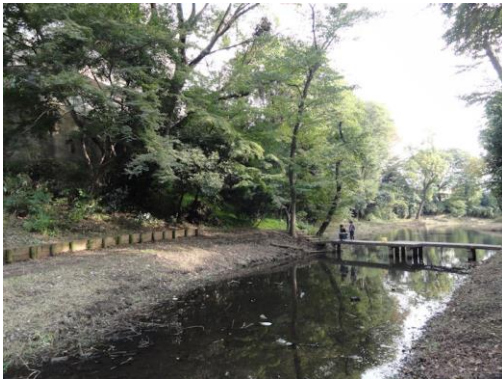
駒場東大一二郎池（湧水）