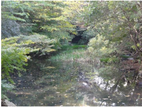
ケルネル田んぼ（湧水）