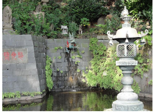
目黒不動尊独鈷の滝（湧水）