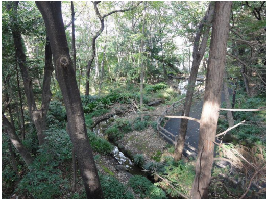
林試の森公園（湧水）