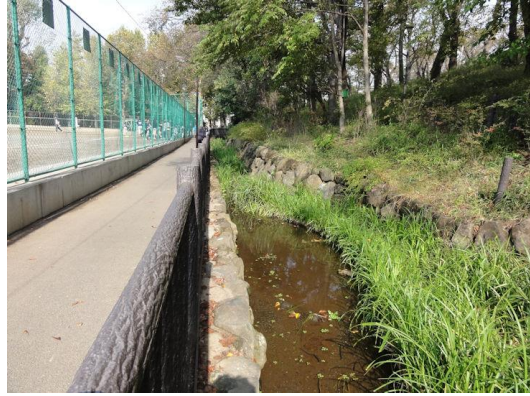
洗足公園北の（湧水からの）流れ