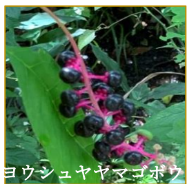
ヨウシュヤマゴボウ