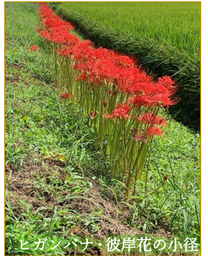
ヒガンバナ・彼岸花の小径