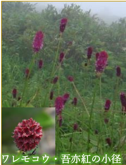
ワレモコウ・吾亦紅の小径