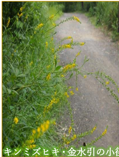
キンミズヒキ・金水引の小径