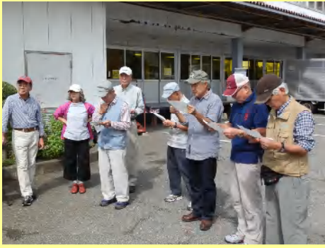
説明を聞く男性陣。しっかり頭に入れましょう。女性陣も...