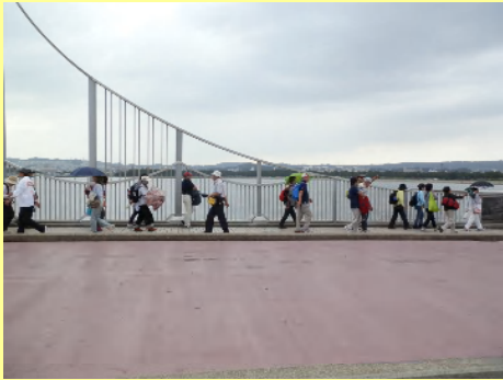
雲の動きで雨が降ってきました。