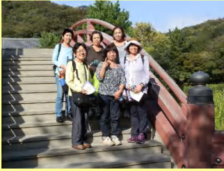
一般参加の方々の集合写真です。