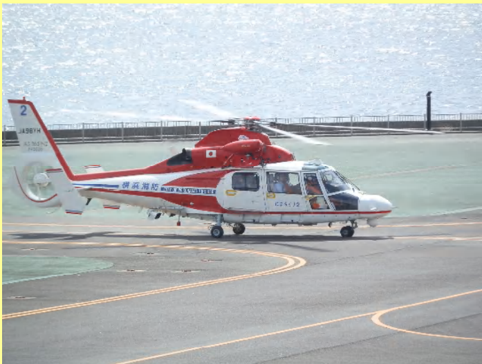
近くで見るヘリコプターは、デザインといい優美ですね。