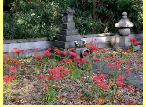
北条実時の墓所。一面の花畑です。