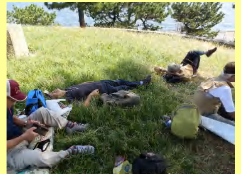
海を見ながらそれぞれの場所で...