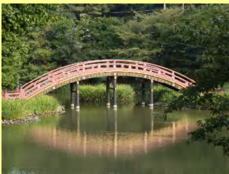
一時は突然の雨もあり心配されましたが、その後は青空となり暑いほどでした。

八景島シーパラダイスでは、アトラクションも年齢制限・高血圧者禁止・・・等々で、高齢者には“優しくない”園内でした。どうせならジェットコースターやブルーフォールにも乗りたかったのですが・・・残念でした。