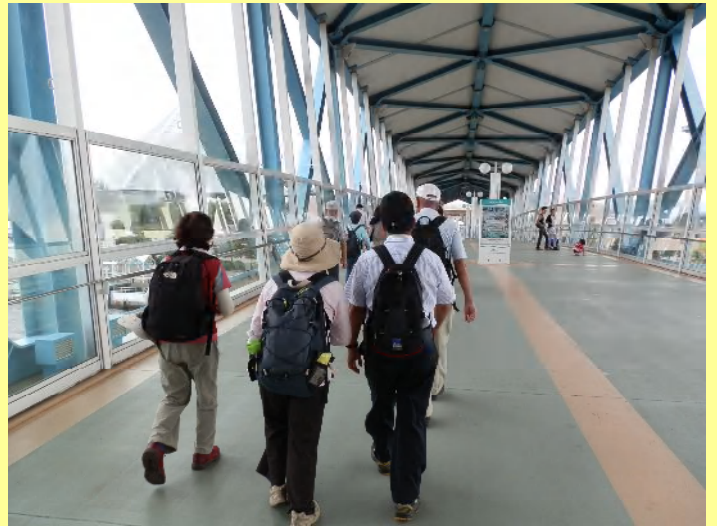
カップルの聖地、八景島シーパラダイスです。若者や家族連れには楽しい場所ですが、果たして高齢者には…