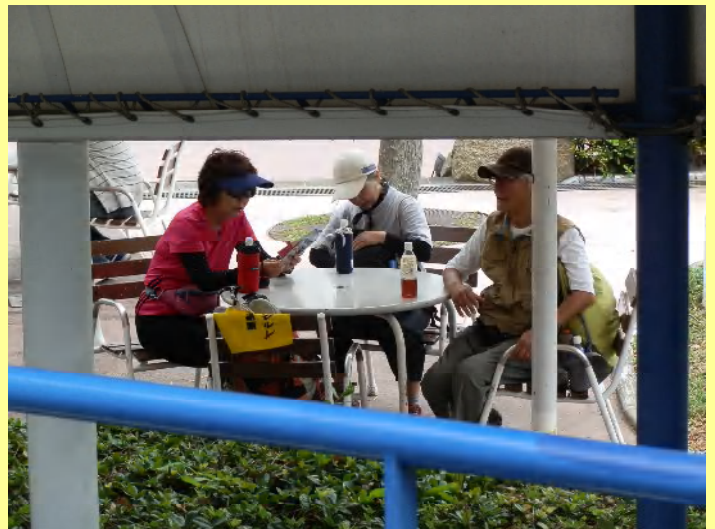
この3人は下で待つことに。