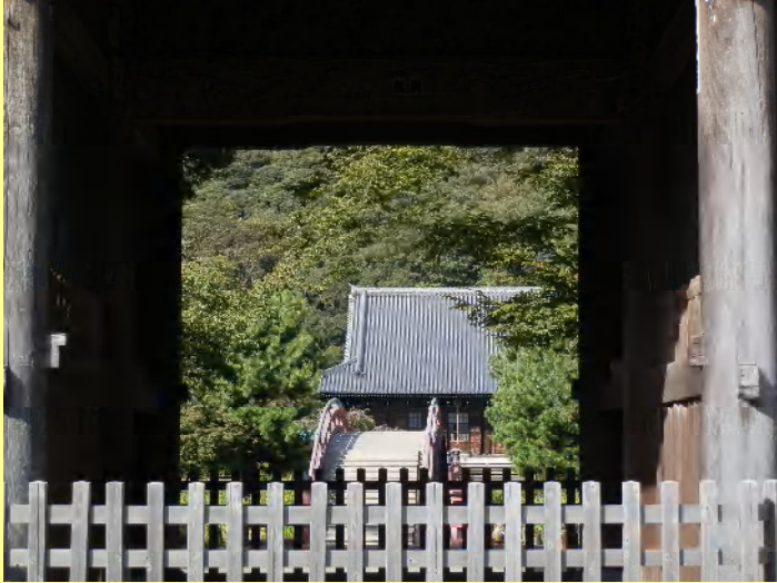
仁王門から金堂を望む。