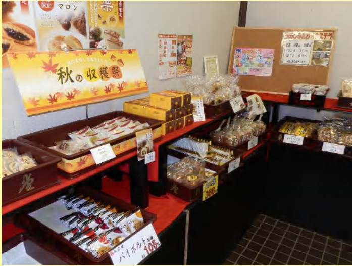
美味しそうなお菓子が並んでいるので...