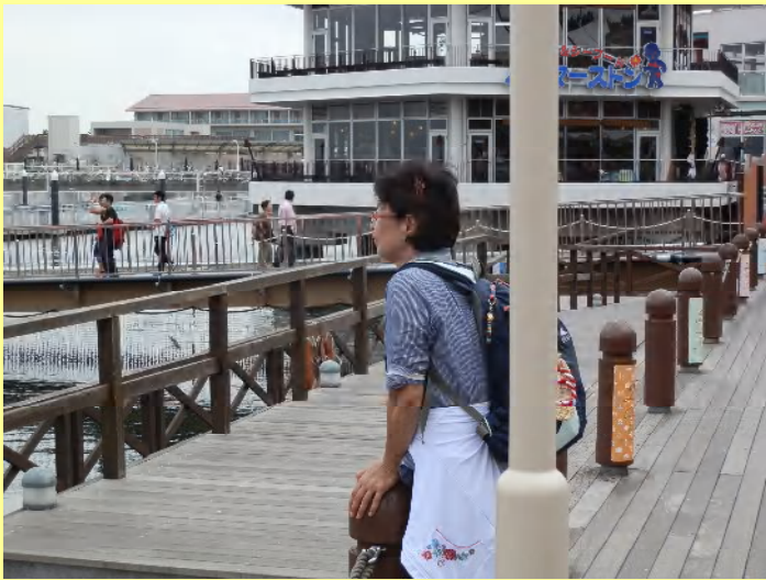
誰を待つのか波止場に佇む女が一人...