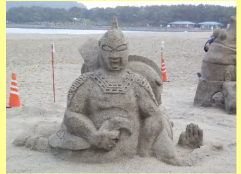
砂浜には砂の像が出来ていました。