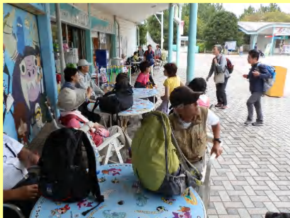
皆さん時間通り集合場所に集まってきましたが・・・