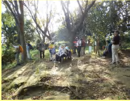
その先の八角堂広場で休憩です。