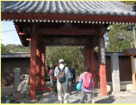
お馴染みの称名寺に入ります。