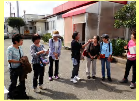
一般参加6名の紹介です。