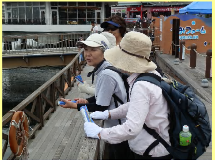
こちらは韓ドラの話でも？