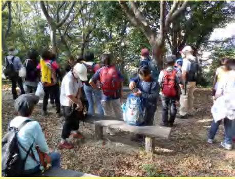
稻荷山休憩所で水分補給タイム。