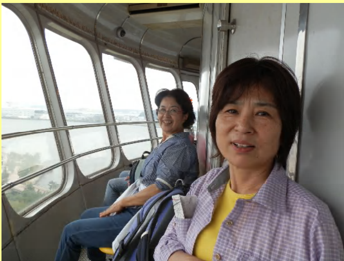
シーパラダイスタワーです。空と飛ぶ円盤もこんな内部では？