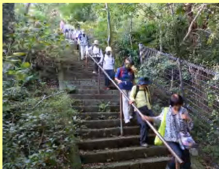
一列“渋滞”で慎重に降ります。