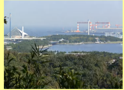
眼下には先ほど行った八景島が。