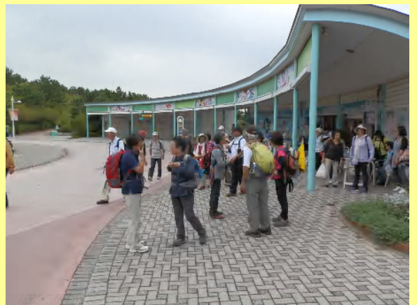
ここでハプニング。一人行方不明！