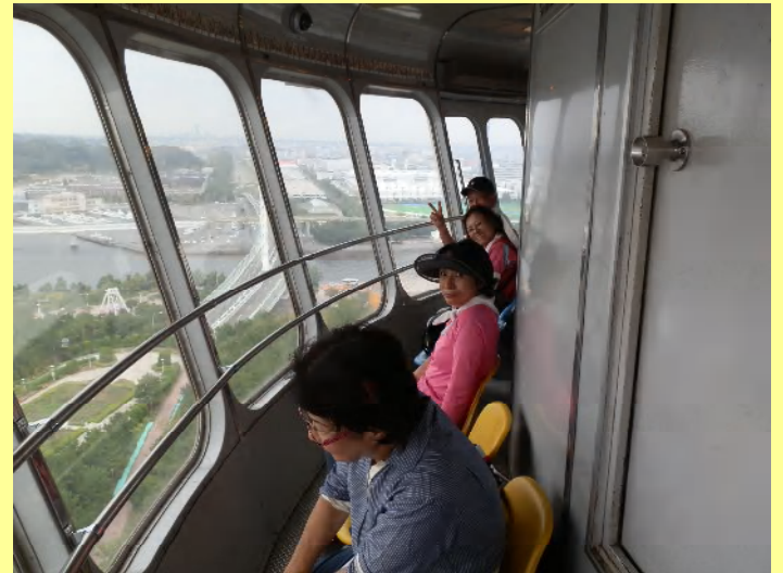
とするとこの人たちは宇宙人！