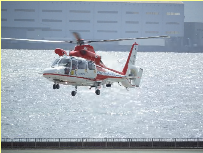
と思ったら、別のヘリが飛んできて着陸です。この機は横浜消防局航空隊。この珍しい光景、皆さんラッキーでした。