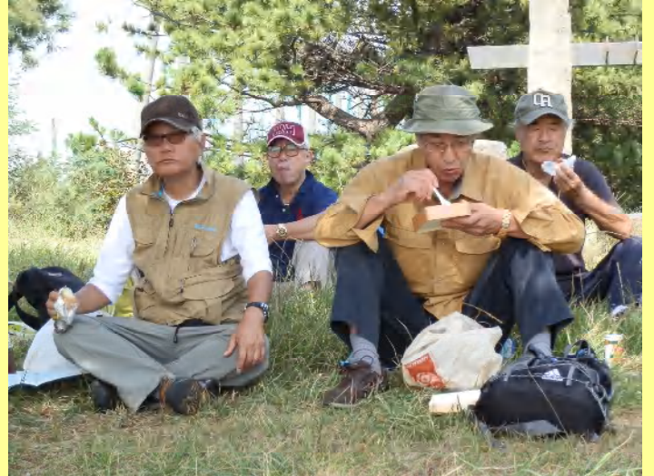
少し早めのランチタイム。芝生の丘で食べると食欲も増しますね。