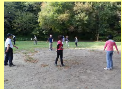
最後にクールダウンです。