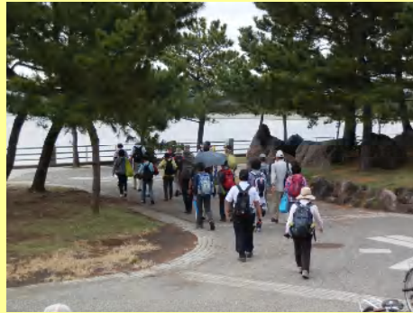
ここから海の公園に入ります。