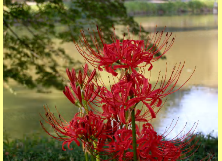
阿字ヶ池の畔には、ひっそりと曼珠沙華が咲いています。