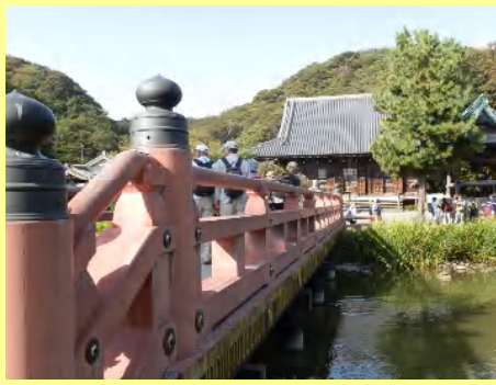
平橋を渡って金堂へ。