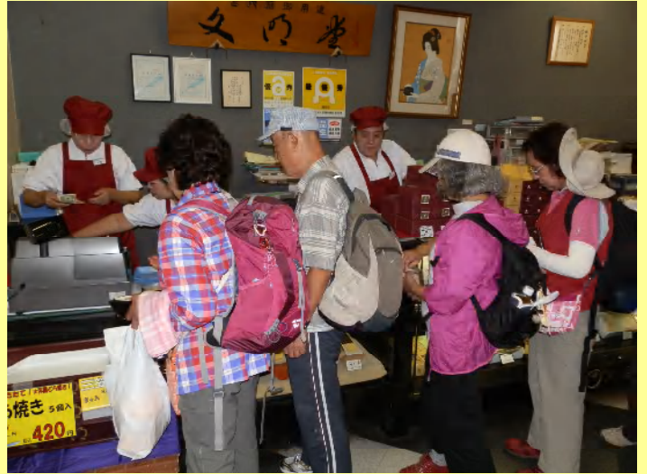
ついつい買ってしまいます。