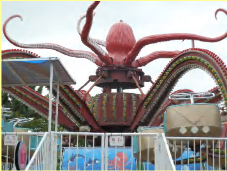
タコのコーヒーカップ！オクトパス