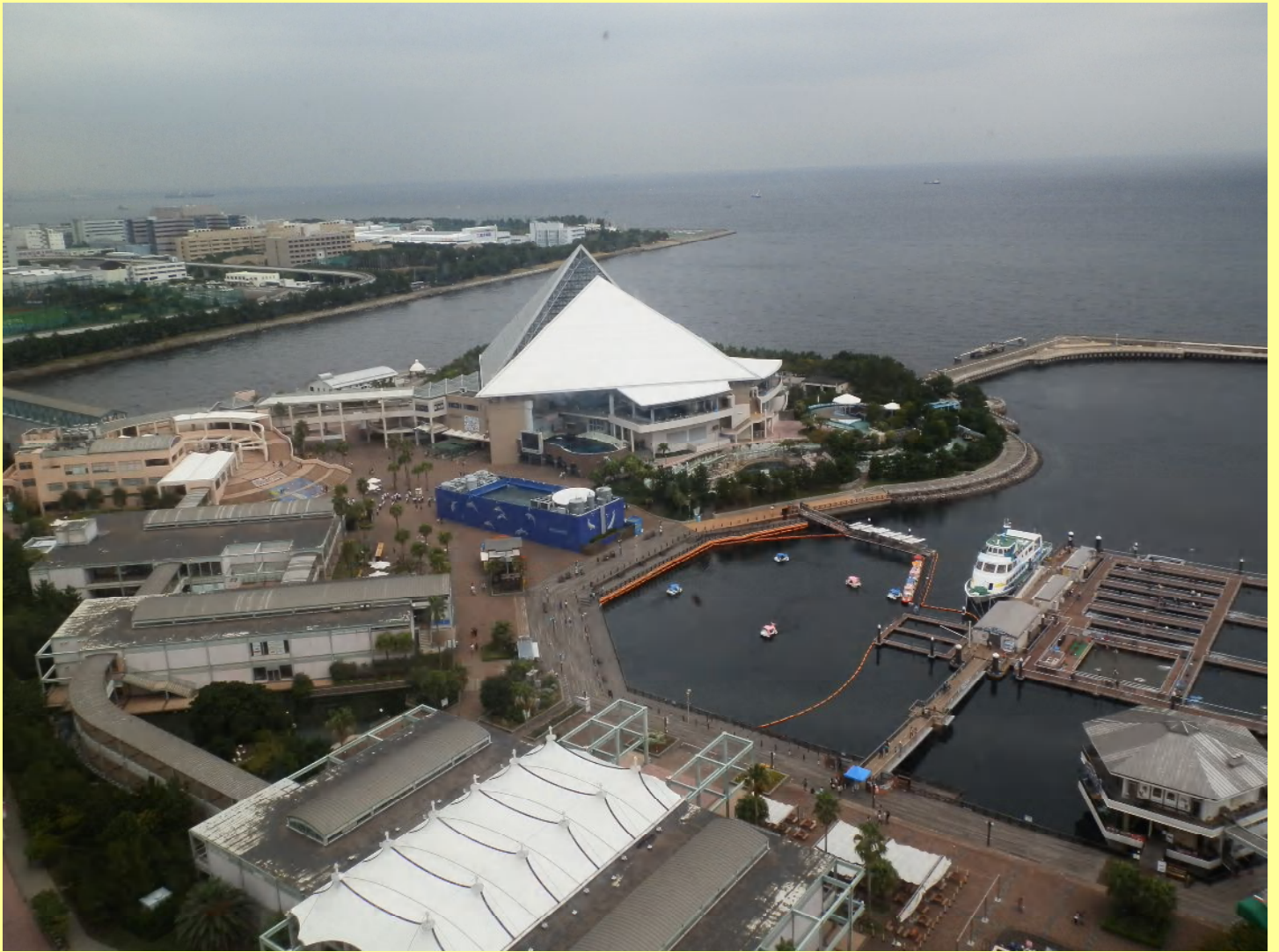
地上 90mから見た園内です。シーパラダイスの名の意味が分かりますね。