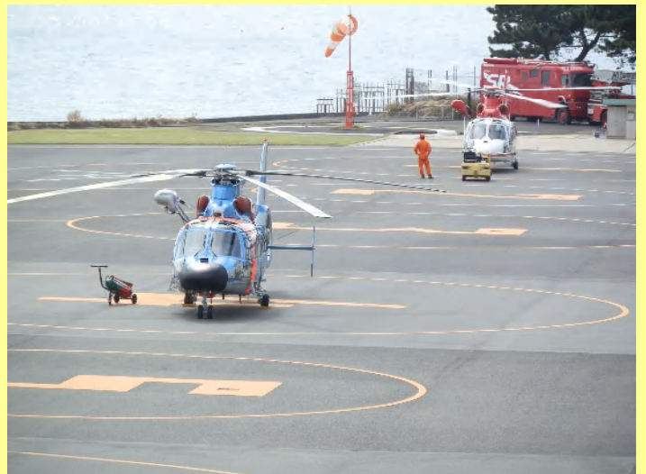
両航空隊の機が並んだのを初めて見ました。