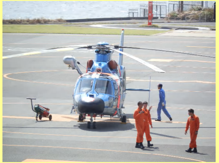
目の前のヘリポートにヘリコプターが出てきました。これは神奈川県警航空隊のヘリです。