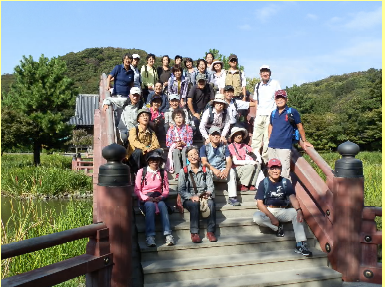
反橋で集合写真を撮ります。すでにお疲れ気味ですが、この後には登りが控えていました。