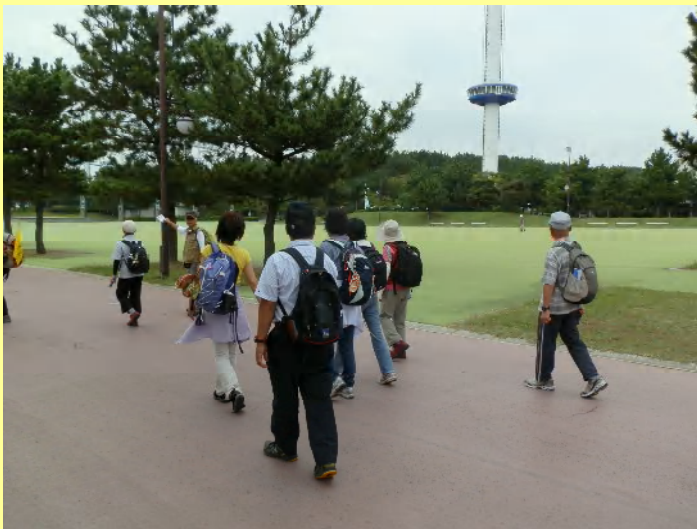
あれに乗ろうか？全員一致しましたが....