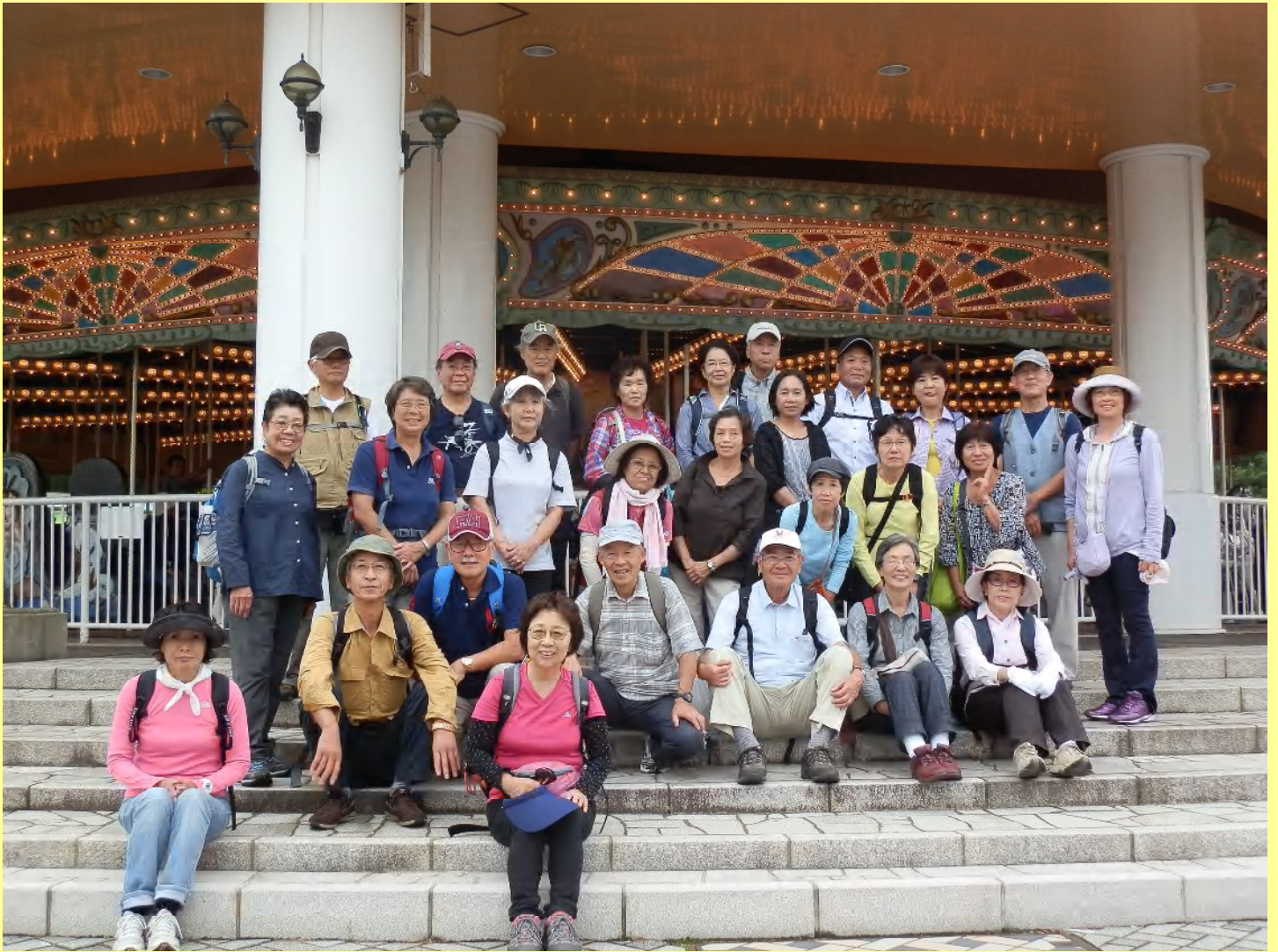
全員揃いメリーゴーラウンドの前で。皆さん十分楽しんだお顔、童心に返って若返ったせいでしょうか。(ナイナイ)