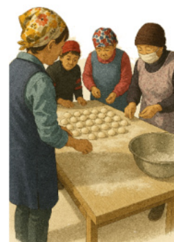
ついたお餅を丸めています。