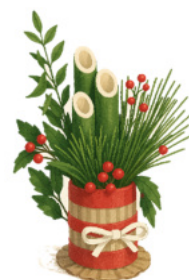
ミニ門松、完成のお姿