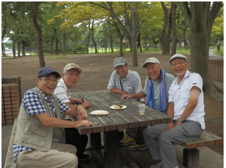
「何がうれしいのか？、子供じゃあるまいし！ いい年して……！」