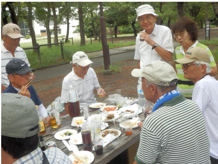
「皆さん味はいかがですか？お酒、足りてる？」世話役は大変「外で食べると美味しいね！」「私が作るからヨ！」