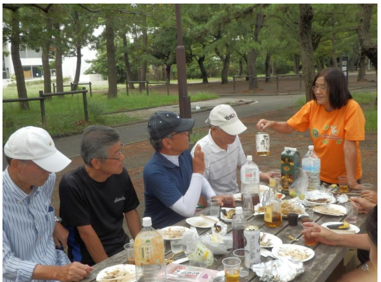
「私のお酌、飲めないの……！」 「イヤイヤ、めっそも無い……」顔、引きつってるヨ