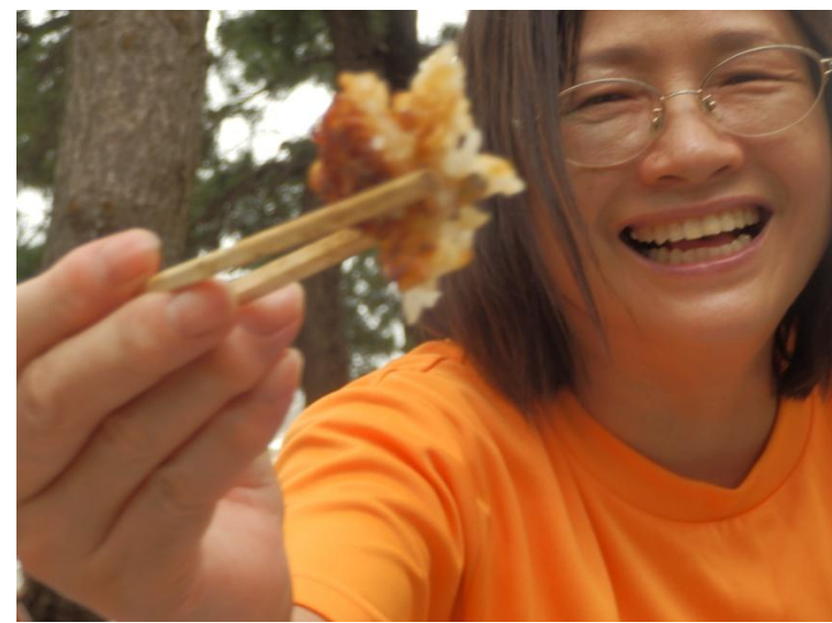
「はい、ああーんして！」