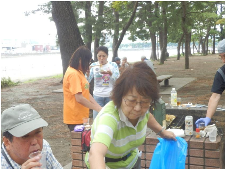
「有難うございます、でもオレのコップ持っていかないでね！」向こうのテーブルも占領してやってるな！「見つかるなヨ」