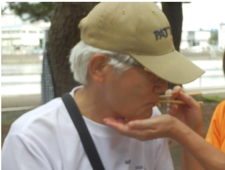
「有難う！、オレこれやってもらうの夢だったんだ！」