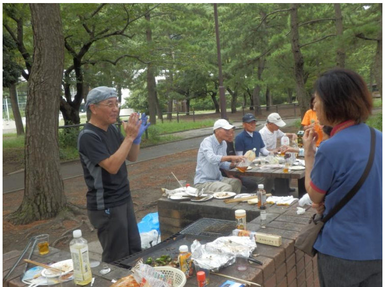
板前さん、ソロソロ暇になってきて「料理のコツはね……」