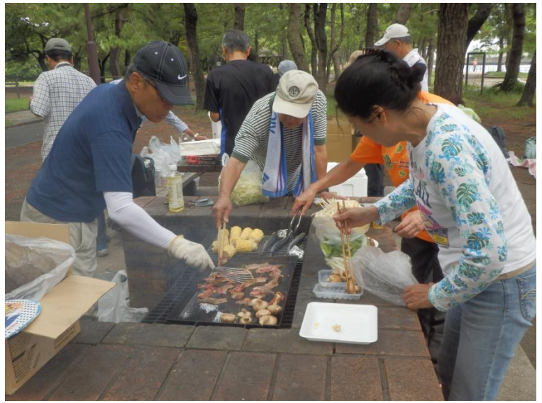
「肉が焼けましたよー、みんな取りに来て……！」 「その前に、ほんとに焼けたか俺がテスト！」