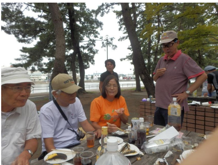
酒ビンも空が多くなってきて、みな大分良い気分になっ...