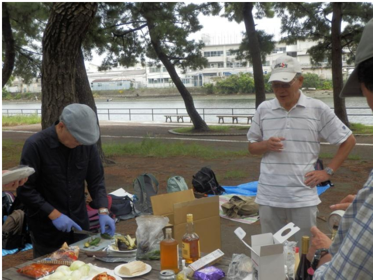
オレ料理の準備する人、オレ見てる人