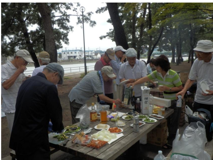
順調に焼けだしました。「皆さん、慌てなくても沢山あります から、座ってゆっくり食べてくださいネ」