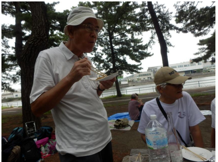
「オレも外で食べるから旨いと思うけど、とりあえず旨けりゃ何でもいいや、大山目指して体力つけにゃー！」