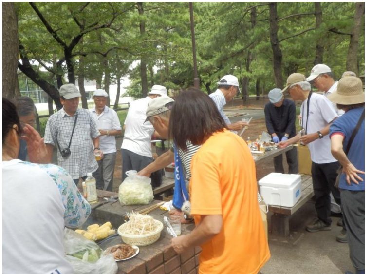
皆さんコップ片手に、作業を手伝いつつ、ビールと日本酒は ここ、ウイスキーは……と目星をつけながら、作戦を考えて……