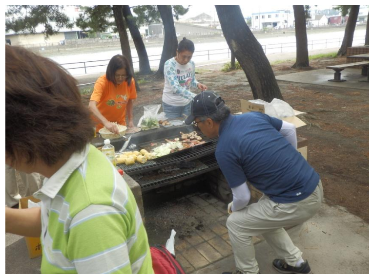
火の当番も、一丁前の恰好して火加減、焼き加減と忙しく なって来ました