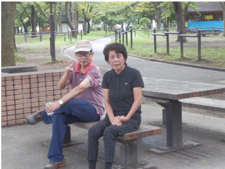
「イヨ、ご両人！」今日は何かおとなしいネ