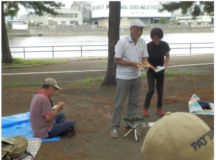
「そっちの方、いってますか？」