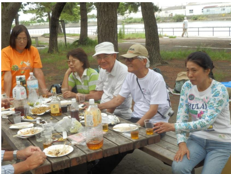
アルコールは強いはずのお二人さん、大丈夫？