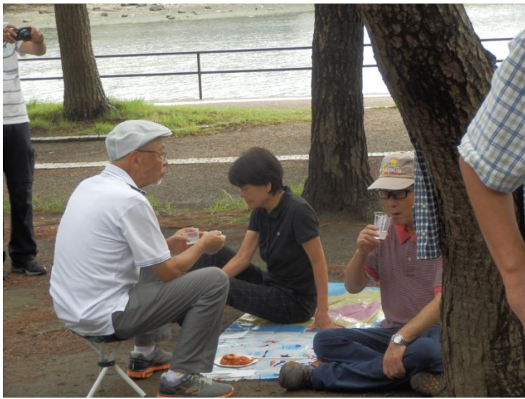
やはり、待ちきれずにこの人から始まりました 「練習、練習……」