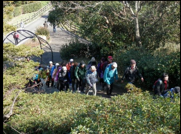
ここから「県木の広場」に入ります。