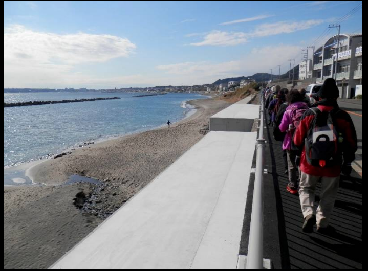
ここからは海岸沿いに歩きます。