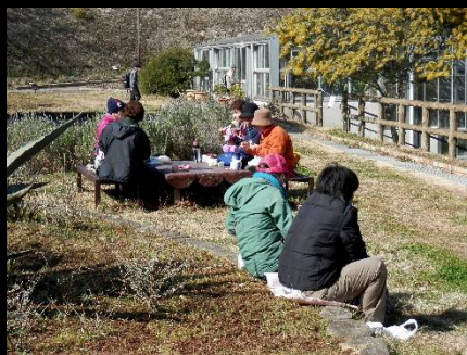
背中から暖かな陽を浴びて。