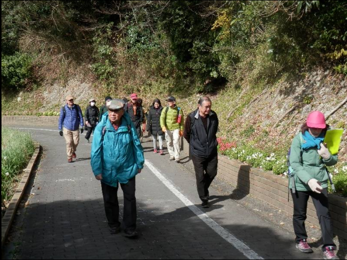
KWCには強力な二本の足がありますよ！