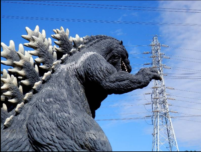
ここにはゴジラが。ゴジラといえば高圧線ですよ！