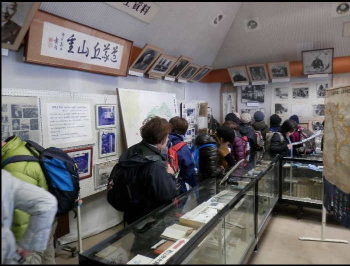
KWCの貸切り状態で館内は一方通行です！ さあ、そろそろ帰りますよ～