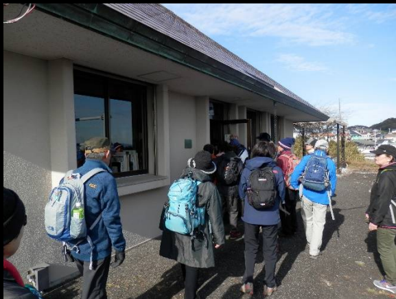
館内は狭いので順番に入館します。