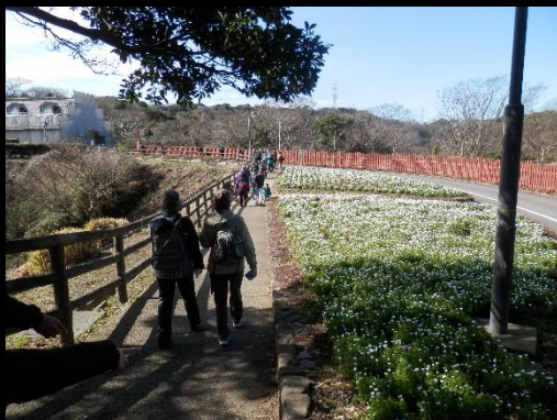
右はお花畑。例によって花の名は？