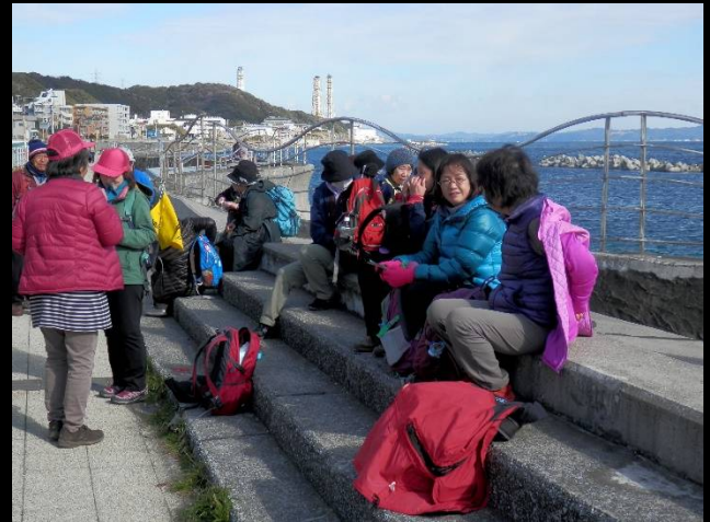
野比海岸公園で一休み。