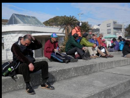
お疲れ？大丈夫でしょうか。