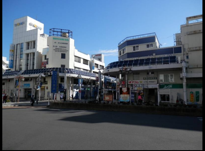
朝の駅前。日曜日のせいか人通りもまばらです。