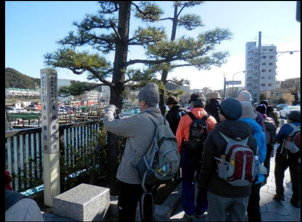
平作川の夫婦橋。橋のたもとは夫婦松が。