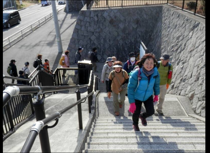
長岡半太郎記念館・若山牧水資料館は同じ建物です。