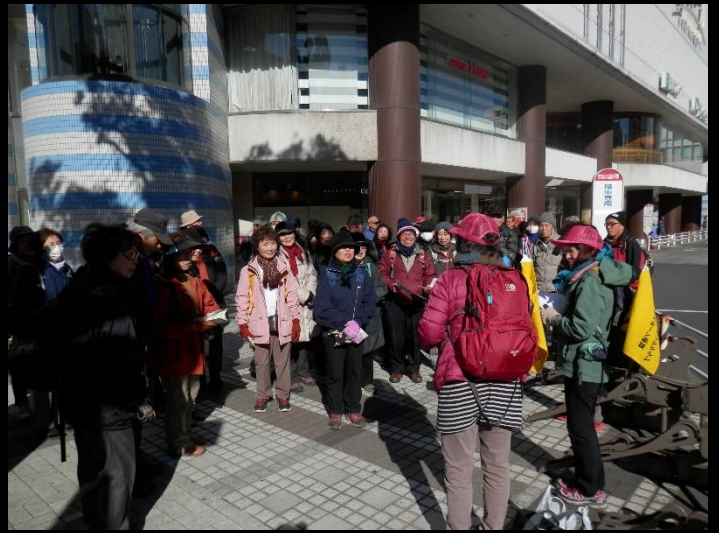
全員集合完了。ここで今日の班分けとコース説明。