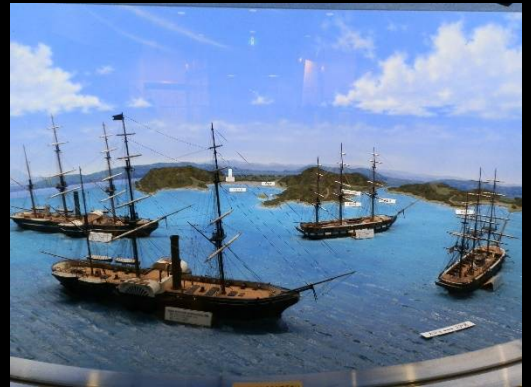
ペリー公園着。記念館で係りの方に説明していただきました。“そうだったのかペリー”分かりましたか？