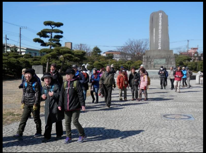
さあこれから「くりはま花の国」に向かいます。