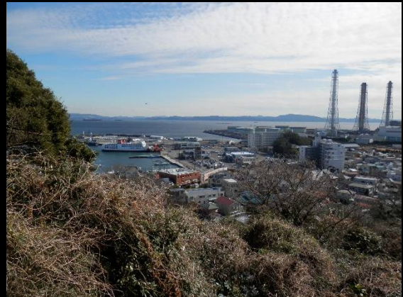
眼下に久里浜港と遥かに房総の山並みも。