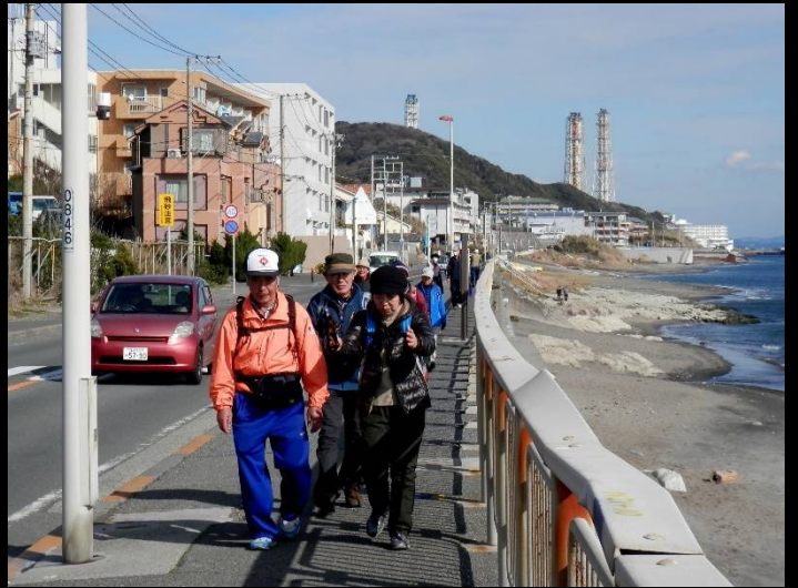
後方には東電久里浜発電所の煙突が見えます。