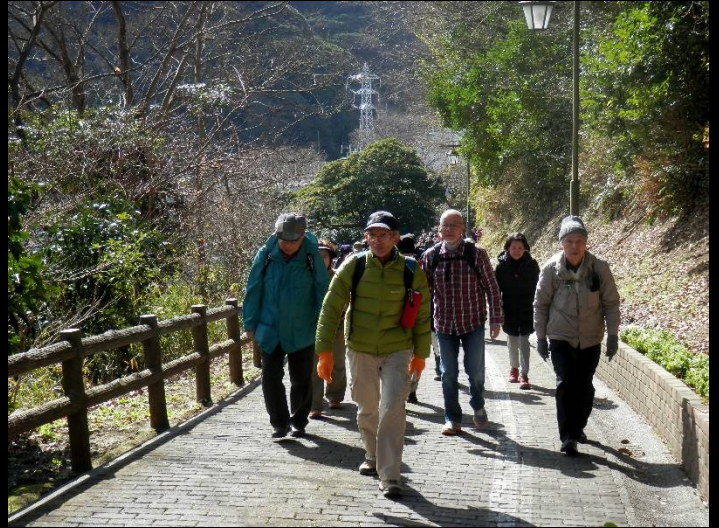
この通り坂道もスイスイと上っています。