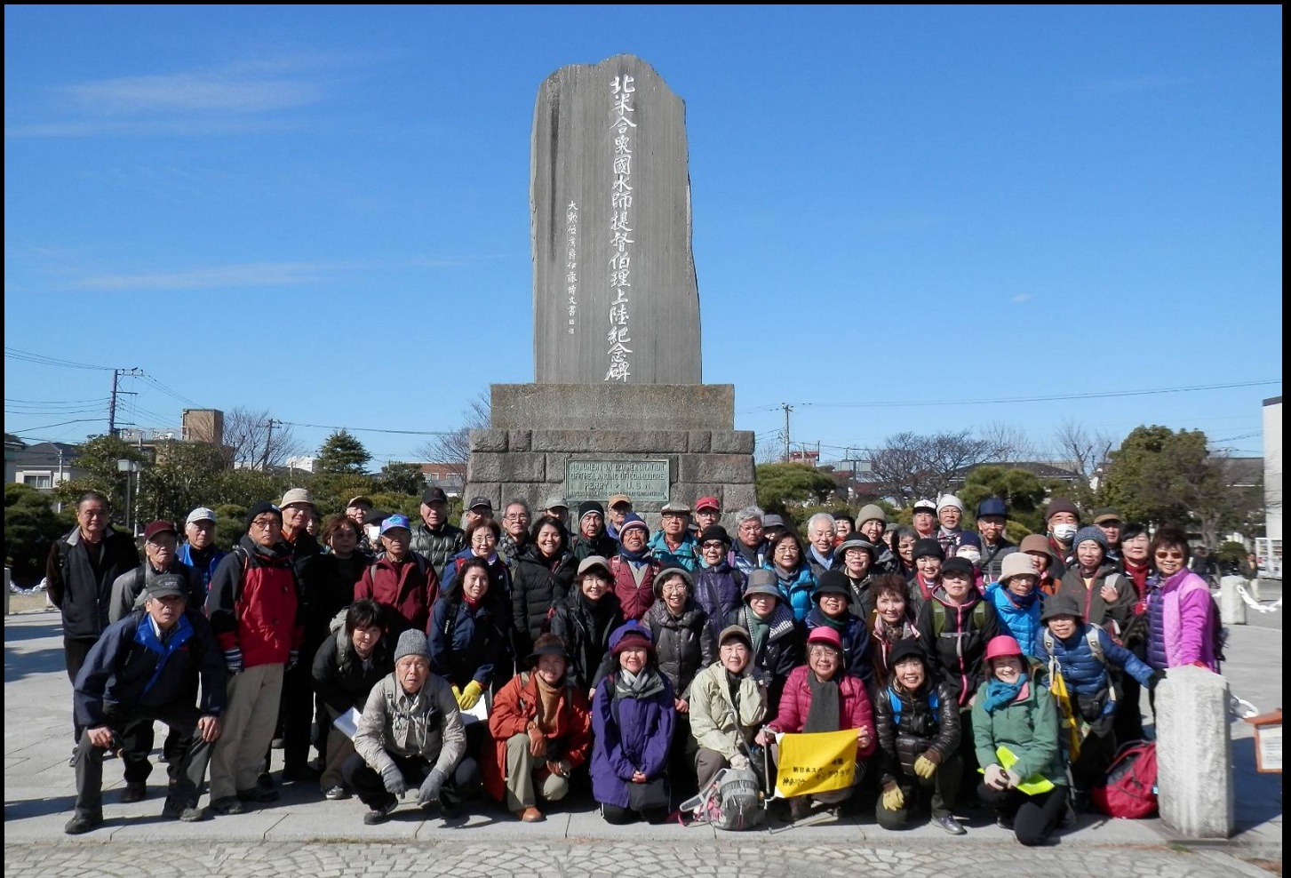
<記念館で説明を聞いた後、ペリー公園の上陸記念碑前で集合写真を撮りました>