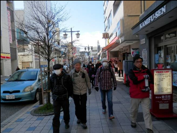
3グループに分け、時間差で出発します。