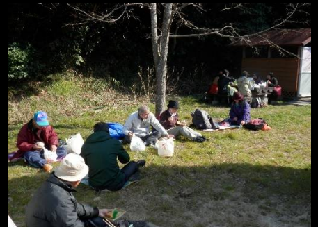
日向と日陰では温度差ありすぎ！