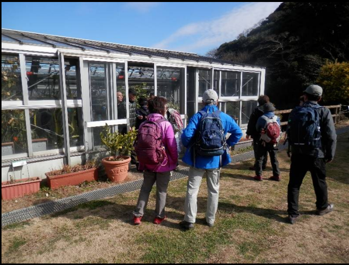
昼食場所のハーブ園に到着。温室がありました。