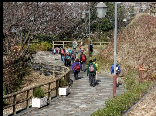
ここからは下り坂になります。