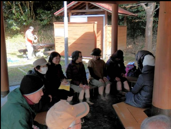
足湯に入れば話にも花が咲きます！