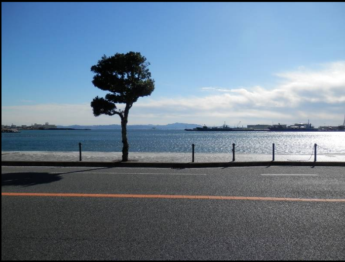
久里浜港。右側にはフェリー乗り場があります。