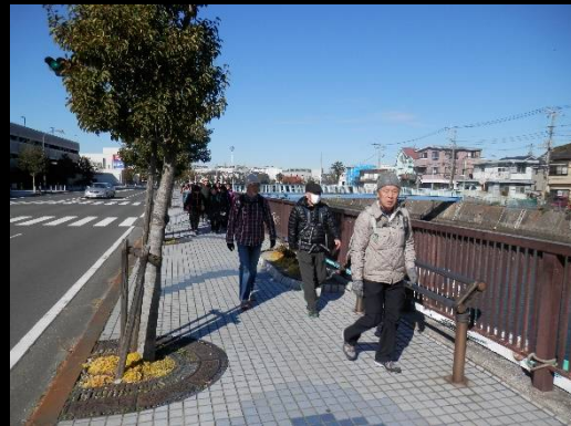
あまり画にならないショットですが！