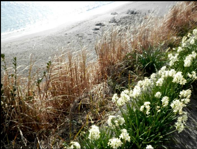
野比海岸水仙ロードに咲く水仙。