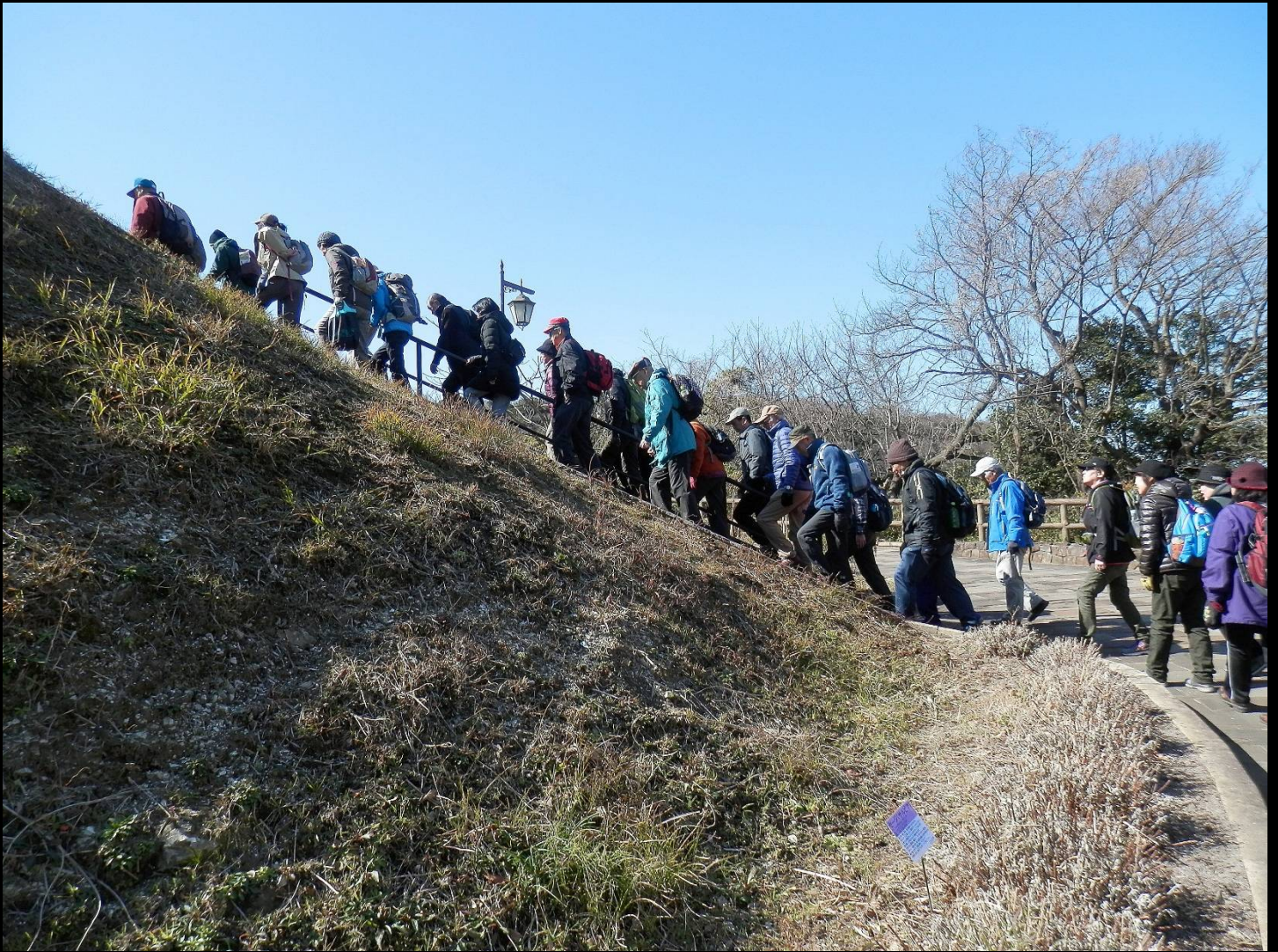
この急階段、30度くらいありますがKWCにとっては朝飯前？ いえ“昼飯後”でした！