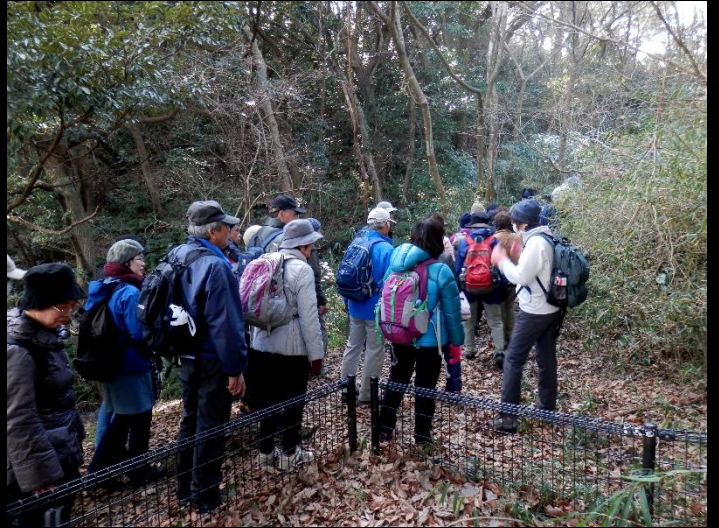
いよいよ待望の山道に！でもこの先に道あるの？