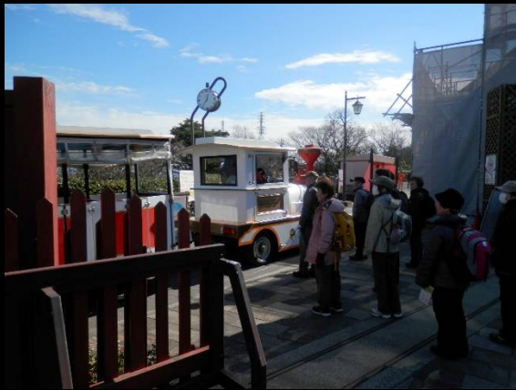
上りきるとトレインが。乗車禁止ですよ！