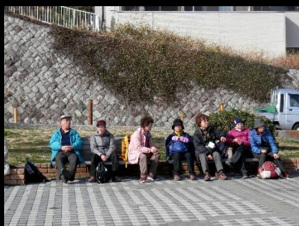
こんな光景よく見かけますね！