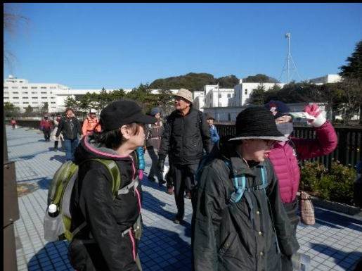
抜けるような青空が広がっています。