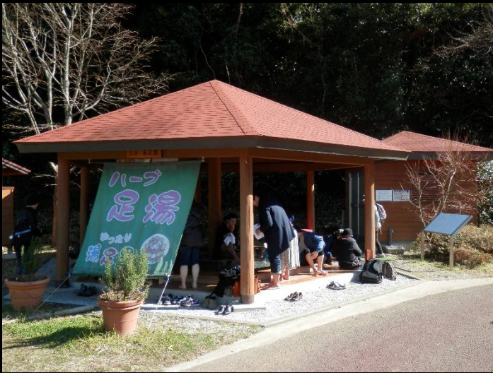
足湯です。人数が多いので食事組と足湯組が交代制で。