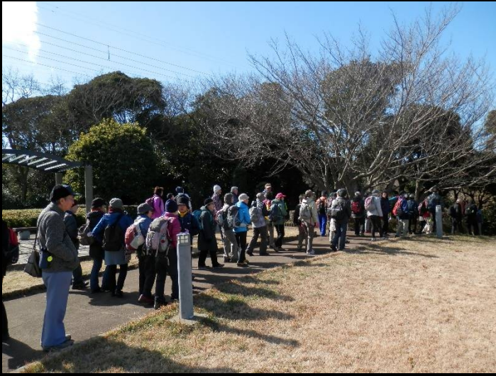
さあ次のポイントへ移動しますよ。