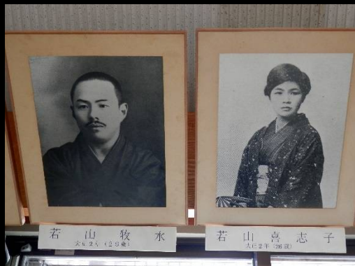
こちらが若山牧水夫妻の写真。