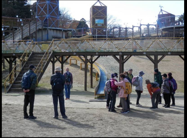
冒険ランドに着きました。ここで暫し小休止。