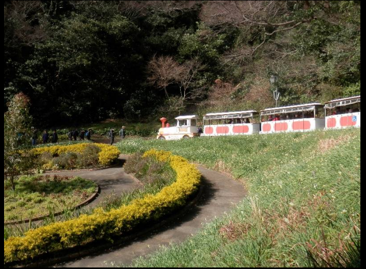
いきなり上り坂です。フラワートレインが恨めしい？