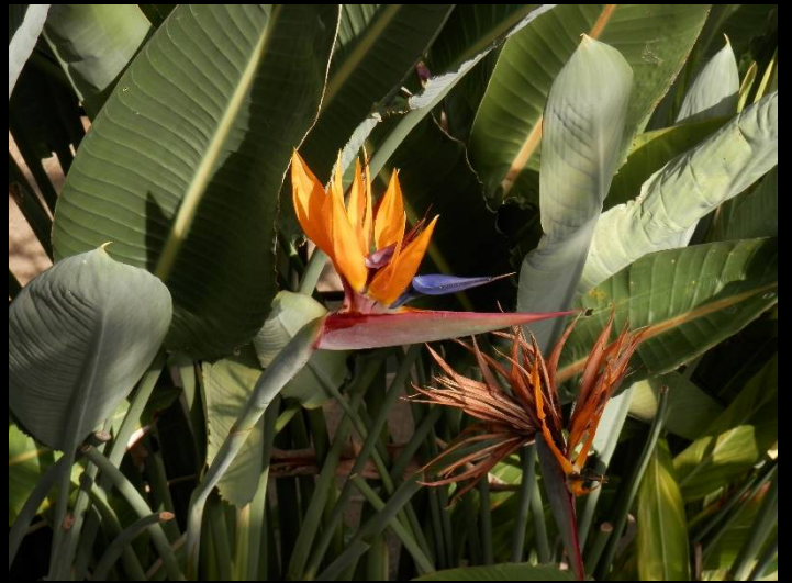
温室にはゴクラクチョウカが咲いています。