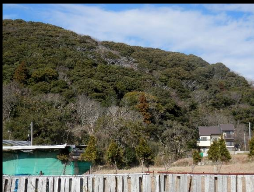
今歩いてきた山。結構な高さでした。