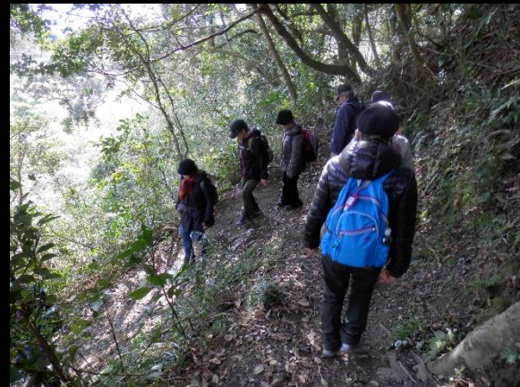
鋭角に下るこんな場所も。