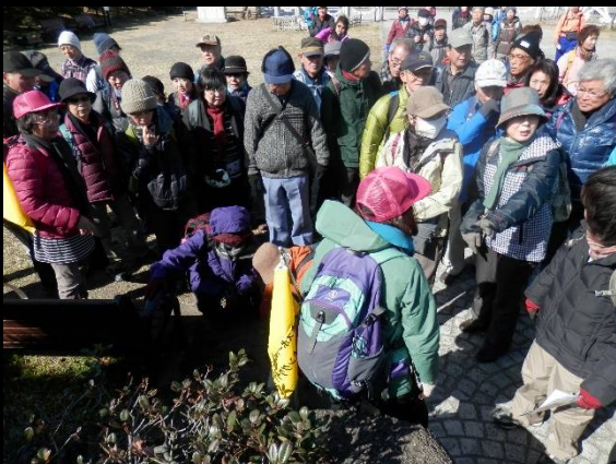
公園内には水準点がありました。