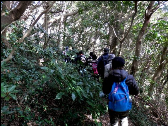
幅も狭く結構スリルある道が続きます。