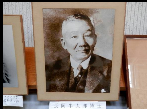
長岡半太郎博士。知っていましたか？