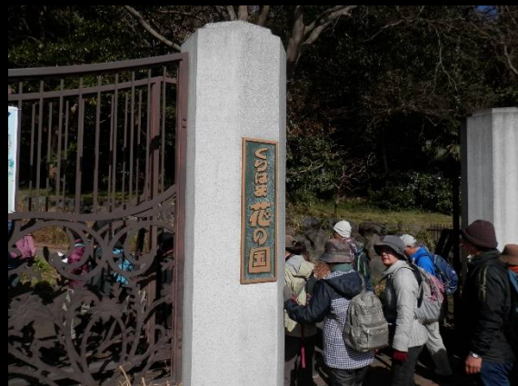
ここから「くりはま花の国」に入ります。