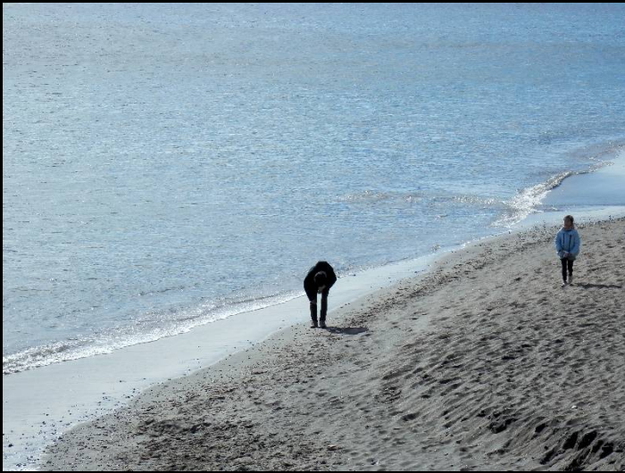
砂浜で遊ぶ親子。♪海は広いな～大きいな～