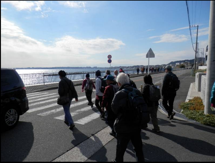
やっと海に出ました！