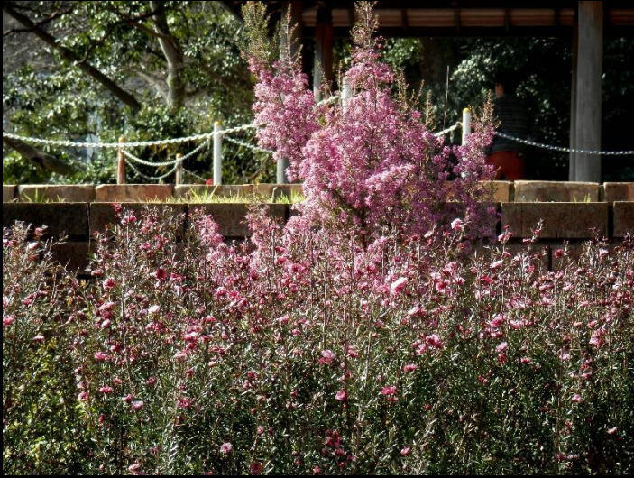
入ると早速エリカの花が出迎えてくれました。