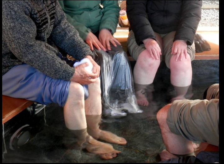
気持ち良さそう！この足はどなたのでしょうか？