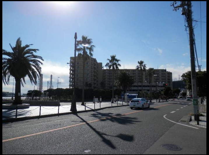
元ニチロの跡は、マンションに変貌していました。