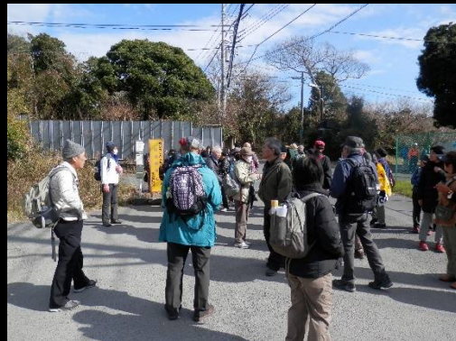
バス停前で後続を待ちます。