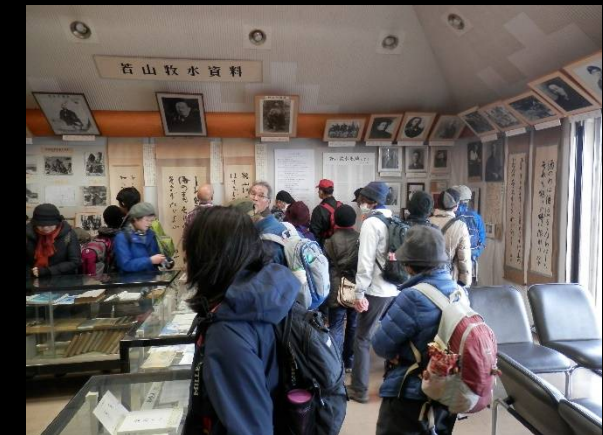
何せ二人分の資料がぎっしりなので・・・