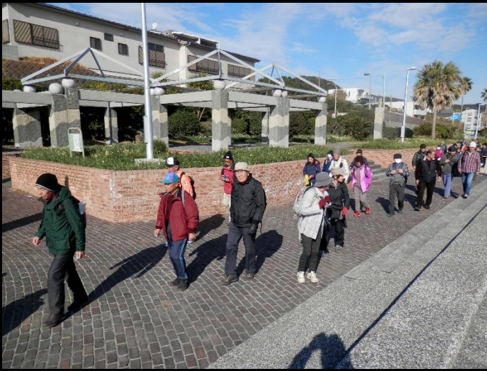
オゾンを十分吸ったところで出発します。