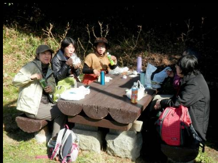
足湯から出て食べるお昼は最高？