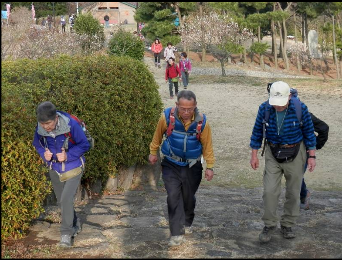
展望台への上りもウォーキングの一部です。