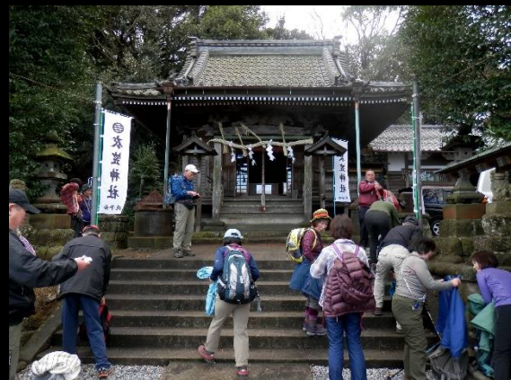
気温が高いのでもう汗が出てきます。