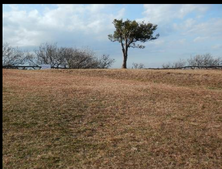
田浦梅林版、ケンとメリーの木？