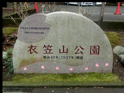
衣笠山公園入り口の可愛い案内。