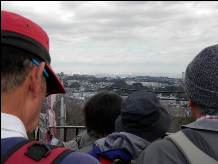
高所恐怖症の私ですが、ここは大丈夫でした！