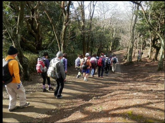
いよいよ本格的な山道ウォークスタート。