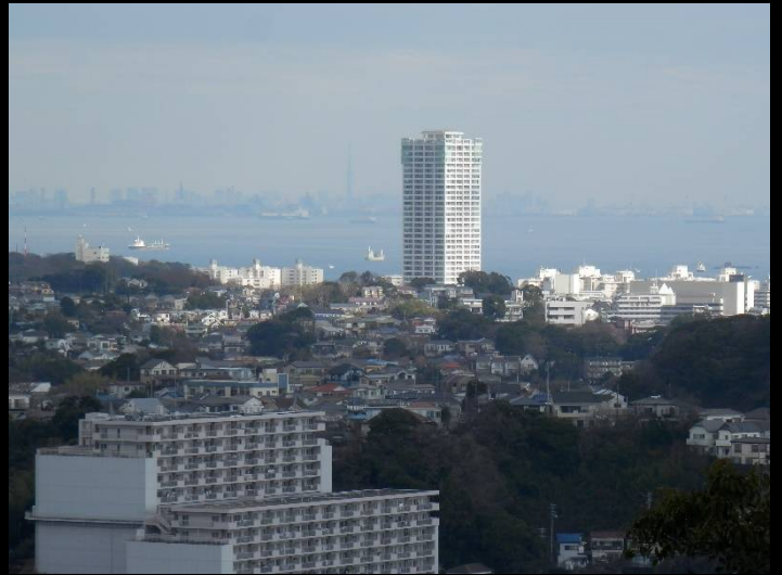
東京湾越しに遥かスカイツリーも見えます。(ヒルの左奥)