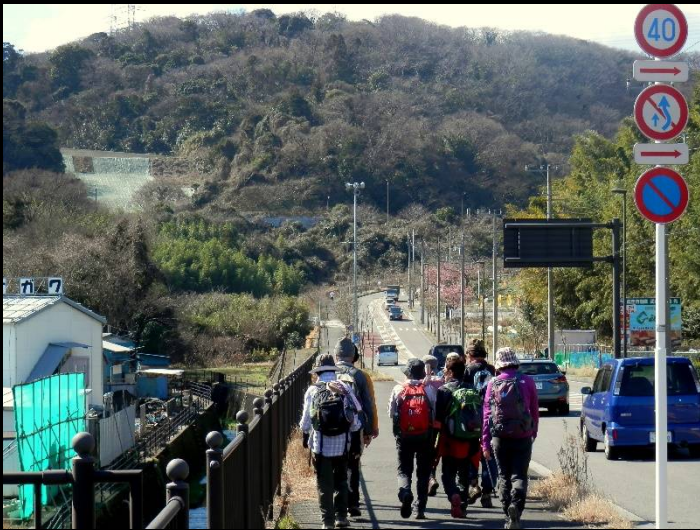
いよいよ大楠山目指しての“行軍”開始！