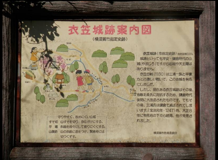
衣笠城跡に到着しました。三浦一族の夢の跡。