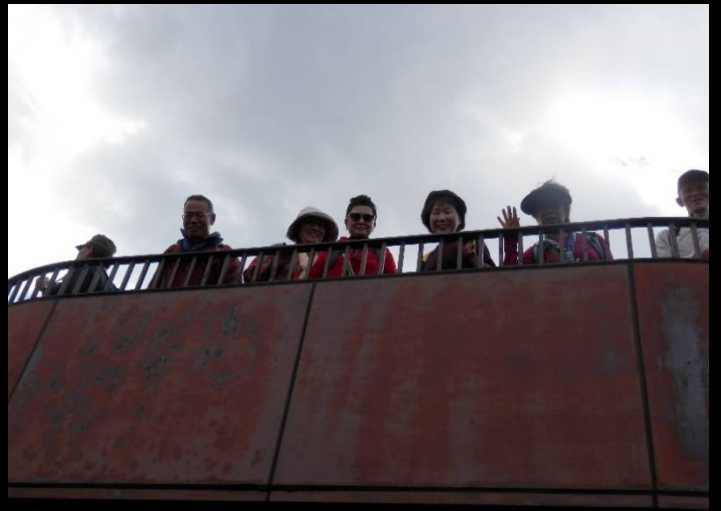
早速展望台に上って。逆光で顔が暗くなりました！