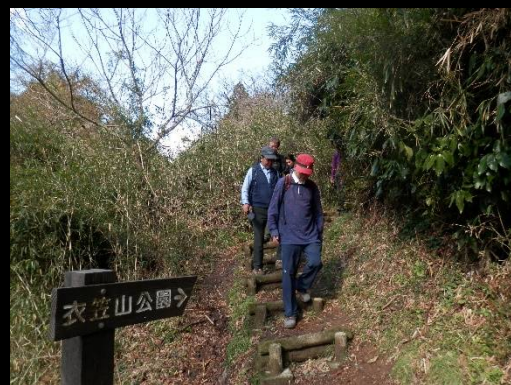
一見長閑ですが足元には危険が！