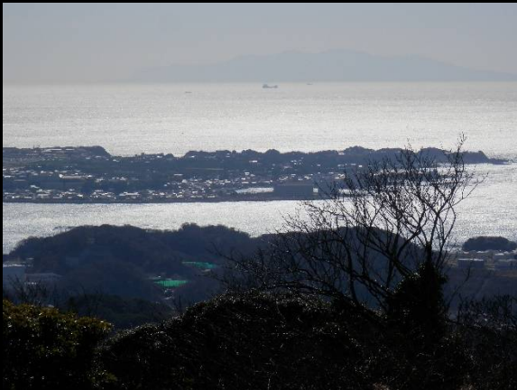
山頂からの眺め。遥か荒崎方面が見えます。