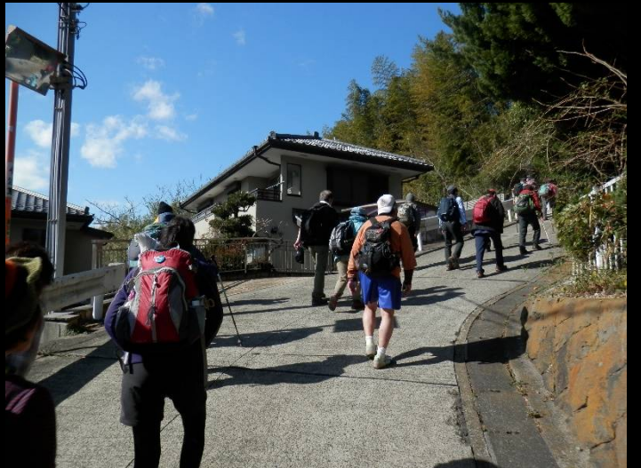
下りたと思えばまた上り。すでに足がパンパンです。