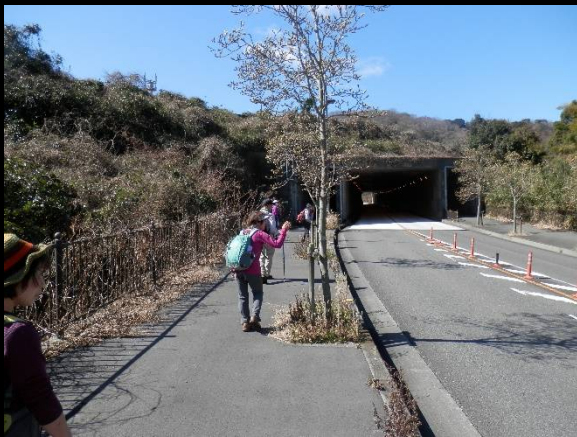
怪しげなポーズの人が・・・うちの会員？