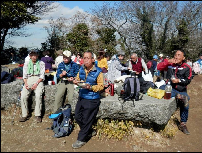
山で食べる弁当は最高！でも食べ過ぎ注意ですよ。