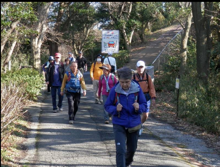
公園を下り最後のポイントに向かいます。