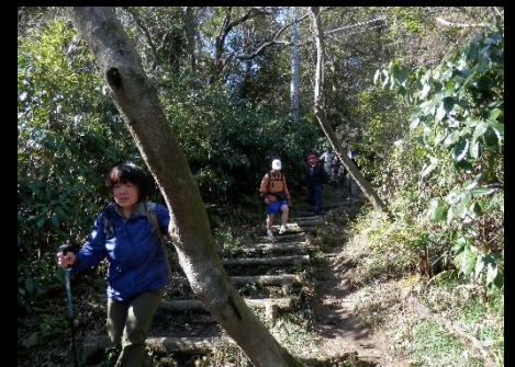
下りは木につかまって慎重に！