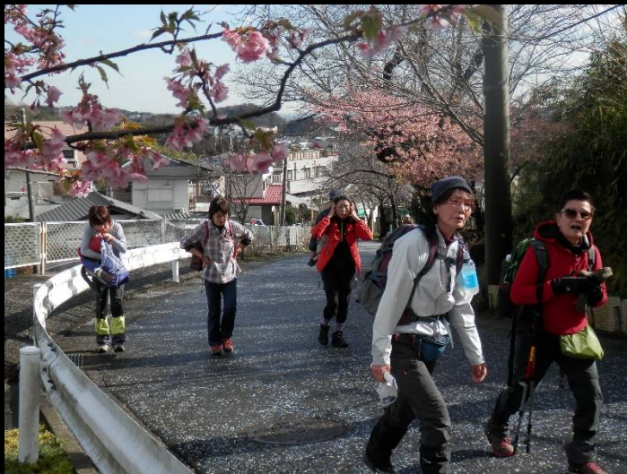
衣笠神社に向かう道には河津桜も。