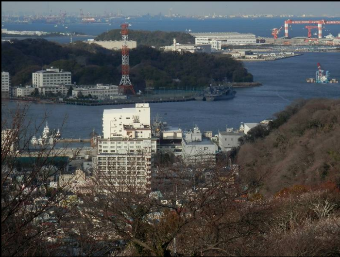
眼下には自衛艦や住友ドックも。