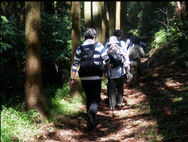
さあ出発。ここからまたぬかるむ道を行います。