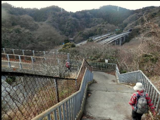
また横横道路の陸橋を渡ります。何回目？