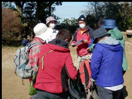
食後の作戦は如何に？出発です。