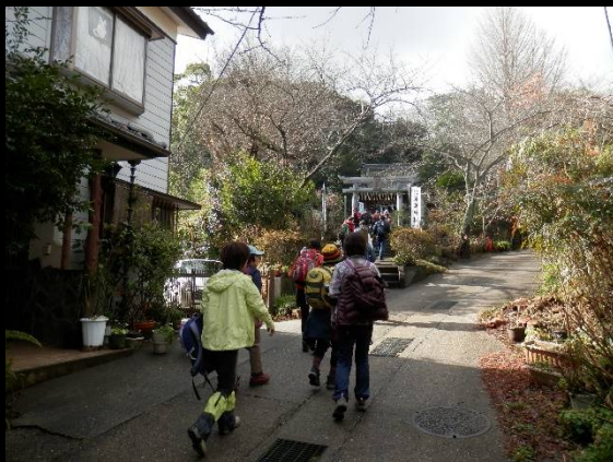
神社が見えてきました。いい雰囲気ですね。