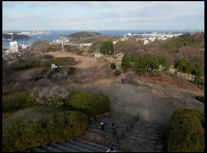
展望台から見下ろす田浦緑地。