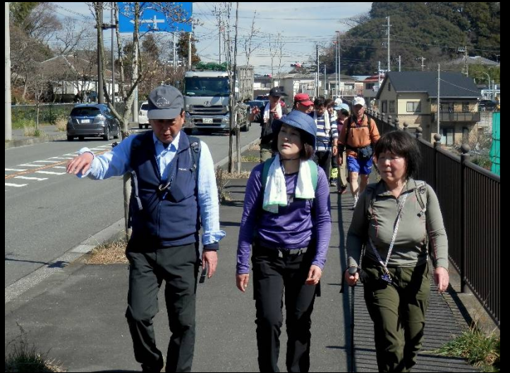
お二人に何の講義ですか？（正しい酒の飲み方？まさかねえ）