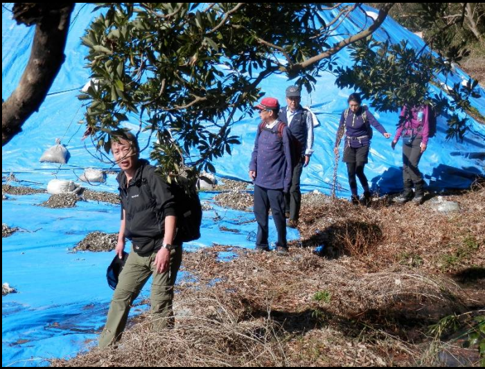
何これ？池ではありません、ズブズブの湿地帯です。