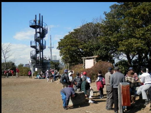
大楠山山頂。日曜で混雑しています。