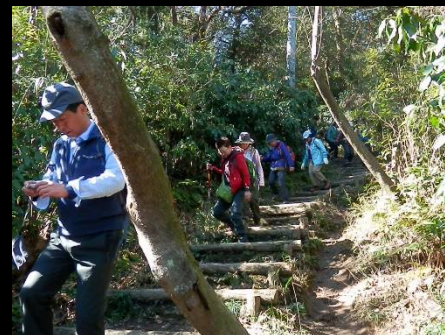
“歩きカメラ”は危険ですよ！