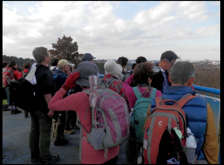
陽が陰ってくると流石に風が冷たく感じられます