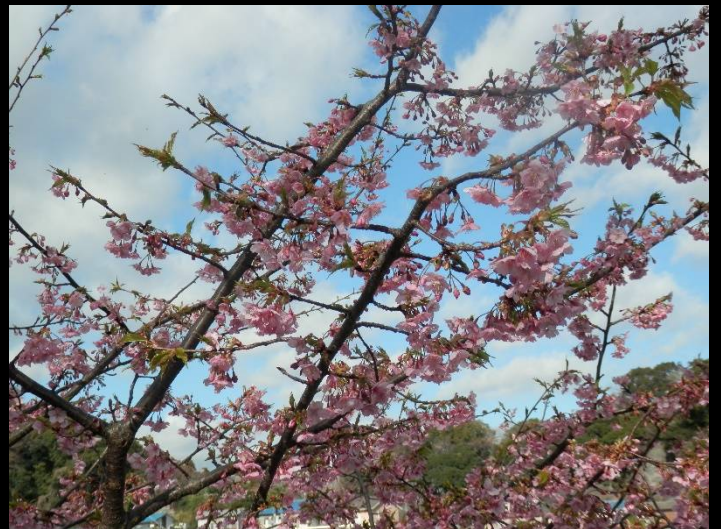
陽当りが良いのかすでに満開でした。