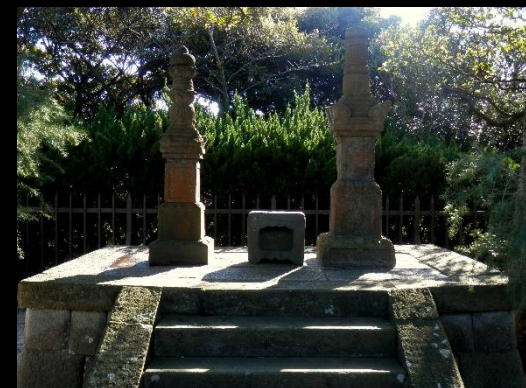
三浦按針の墓に着きました。