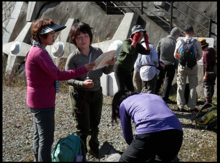
いま何処？リーダーの後をついて行けば大丈夫よ！