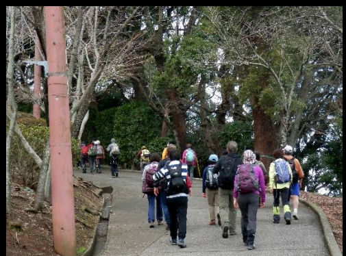
公園への坂道を上ります。