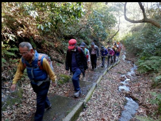
右側には昨夜の雨が川のように。