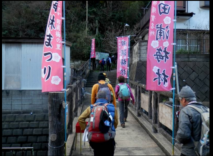
ここが田浦梅林の入り口です。梅林まつり開催中。