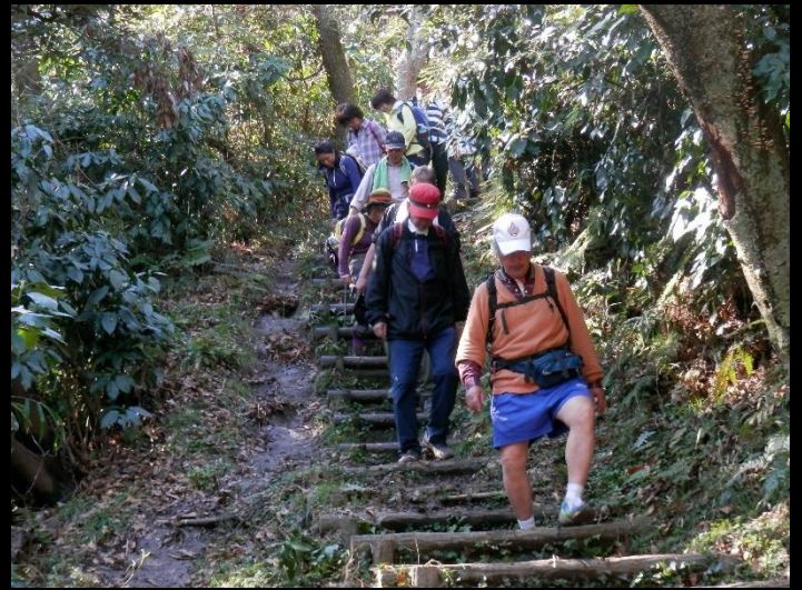
“4WD”の平石SLは、どんな道でもOK？