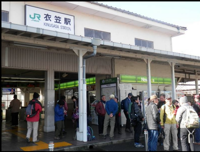
朝の衣笠駅。あまり馴染みのない駅です。