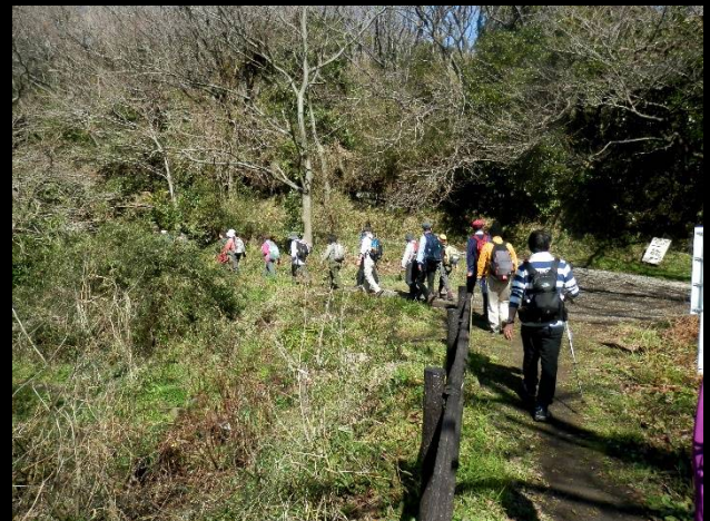
何でもない場所もどこで滑るか分かりません。