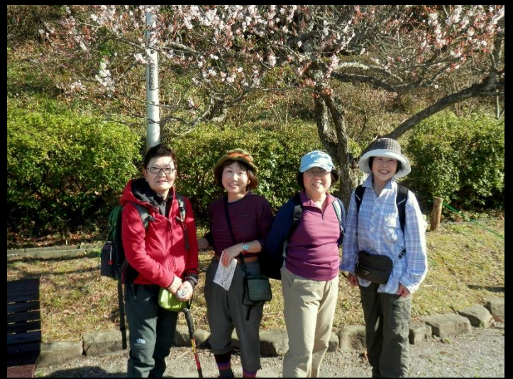
塚山公園で。梅の下の“4人娘”？（相当無理あり！）