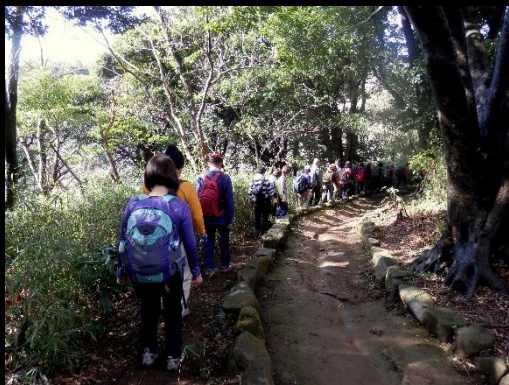
道はツルツル滑るので左を歩きます。