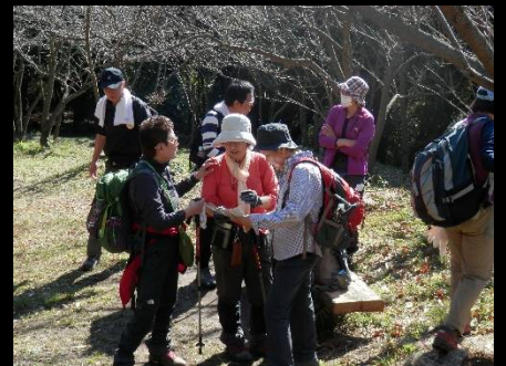
城跡の広場で暫し休憩。暖かな陽射しの中、ここまでの疲れも忘れてお喋りタイム？