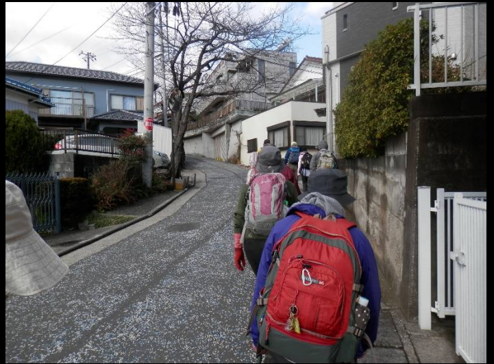
アーケード商店街を抜け上りになります。