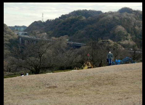
横横道路が近くを通っています。