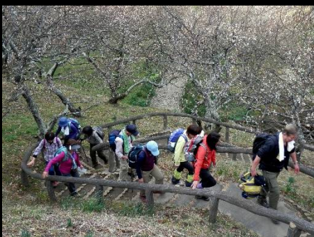
小休止後展望台に向かいます。