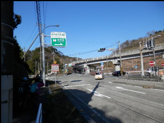
横横道路の横須賀IC入り口に出ました。