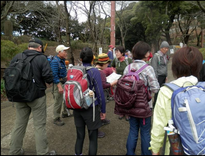
坂の途中でトイレ休憩。