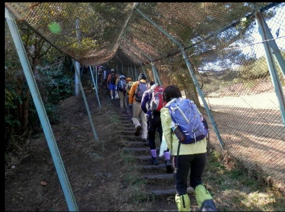
ファ～！大丈夫、ネットに守られています。