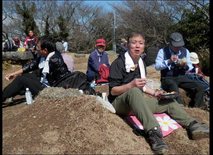
弁当より早く〇〇が飲みたい？まあここは我慢で！