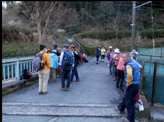
ここでまた小休止します。