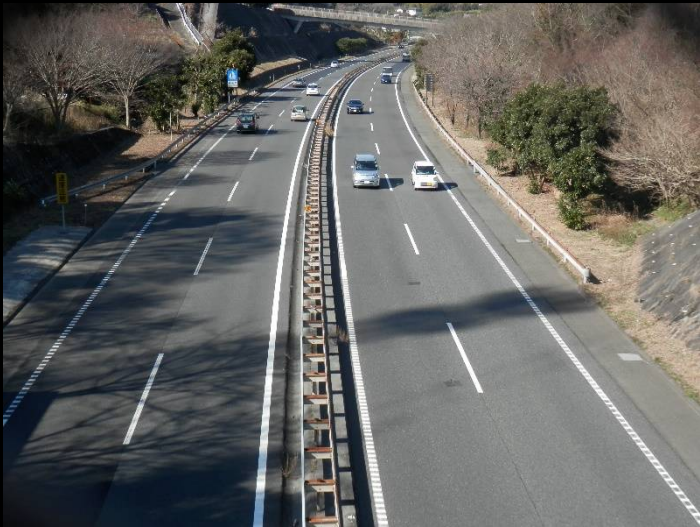
横浜横須賀道路の陸橋を渡ります。