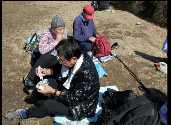
このパン、誰にもやらないぞ～