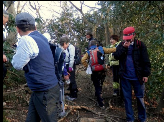
ロープ伝いの急登坂を終え一息。感涙？