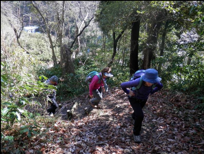
濡れた枯葉が滑り足元要注意。