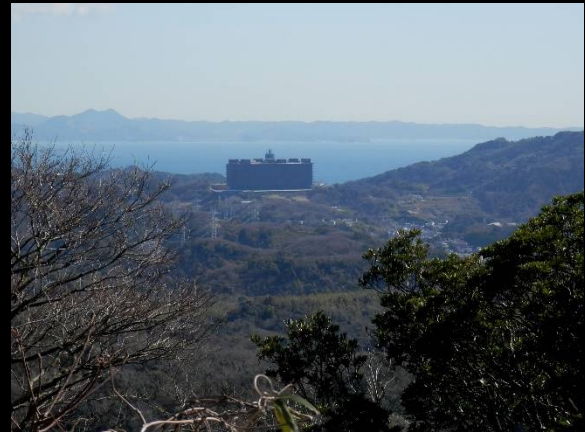
あの怪しい建物は何？遥かに房総半島も。