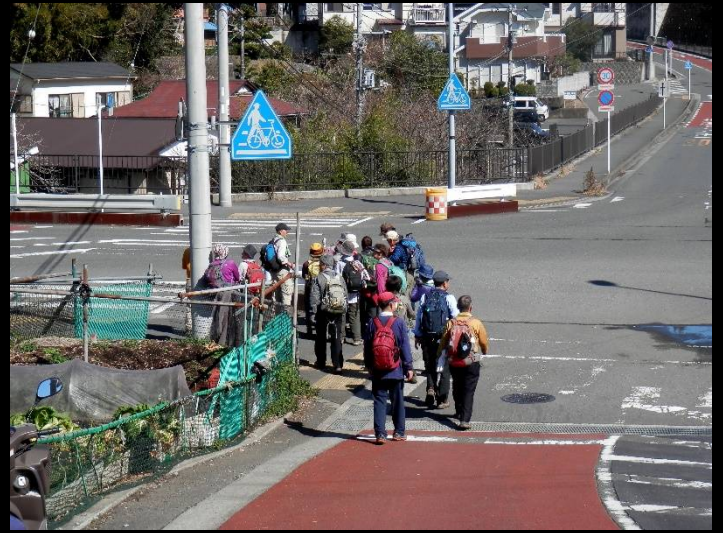
一旦“下界”に下ります。陽射しが眩しいほど。