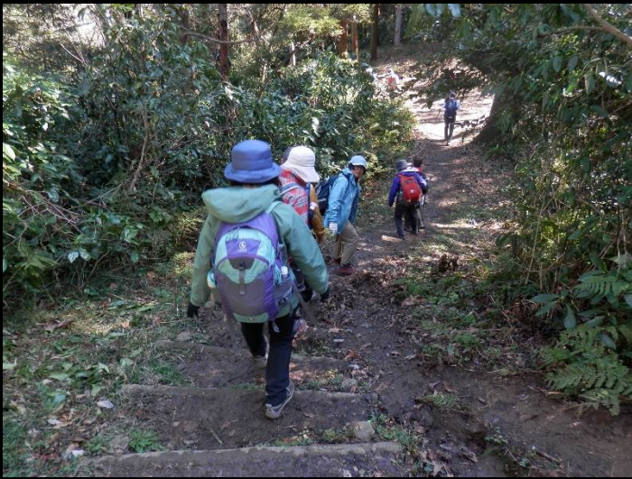
湿った下り階段は特に要注意です。