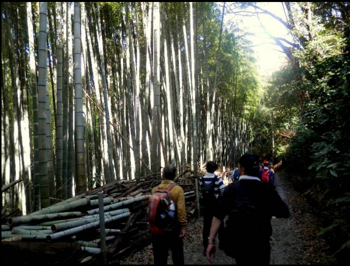
竹林の道に出ました。見事な大竹です。