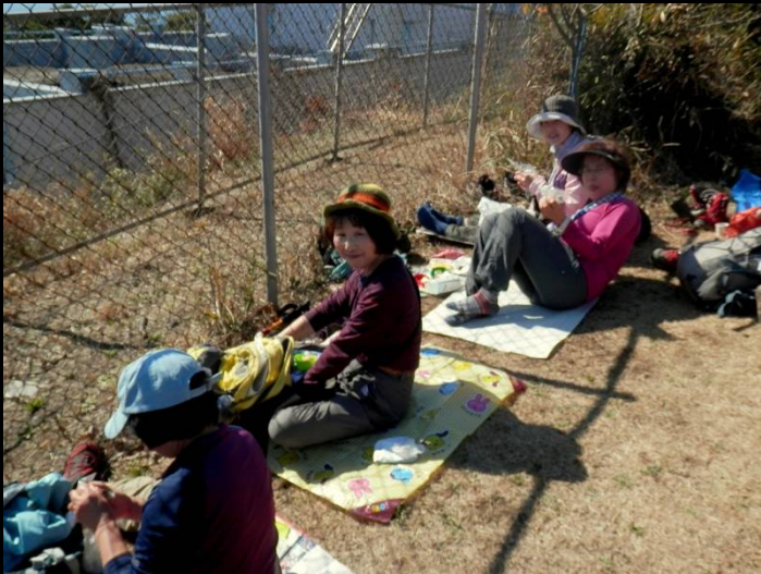
あれ、もう牛になりそうな人がいますね！