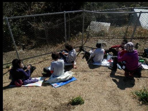
ここで昼食タイム。但し30分だけ！