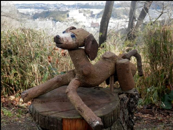
園内には枯枝を用いた犬が。