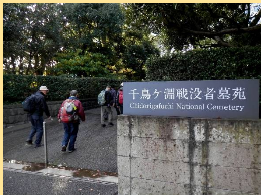
千鳥ヶ淵戦没者墓苑に寄ります。ここは戦没軍人をはじめ 36万5千柱が安置されています。