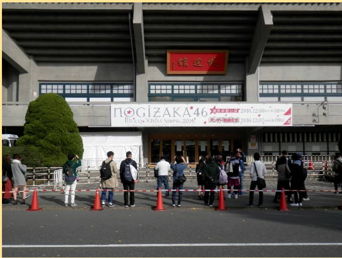
武道館では「乃木坂46」のライブが開催中。