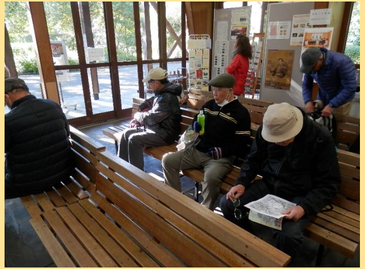
俺たちには関係なし。椅子があったので座るだけ！