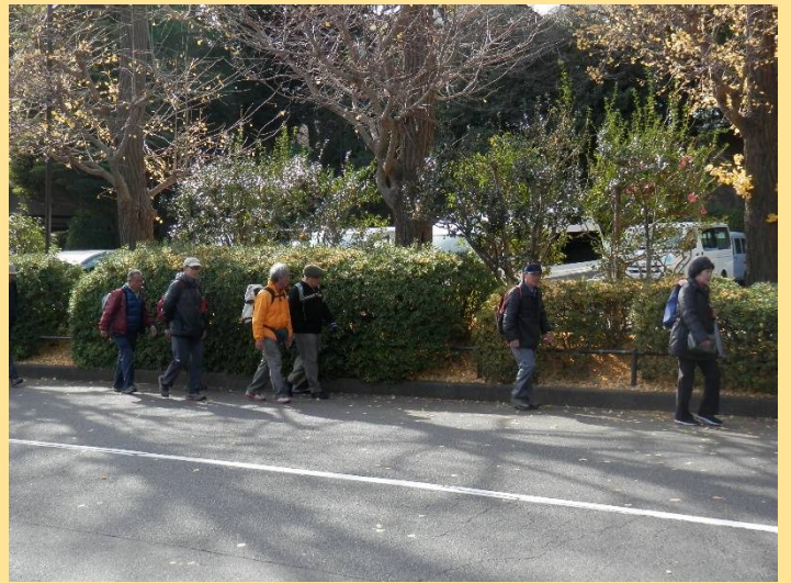
では今日の我々は「KWC34」とでもしますか！