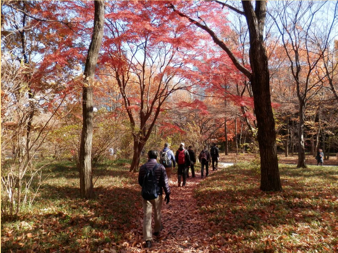
二の丸庭園の雑木林に行く。紅葉と枯葉の素敵な散歩道。