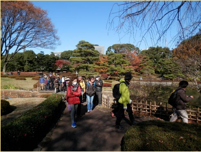
庭園の池を一回りしてみましょう。