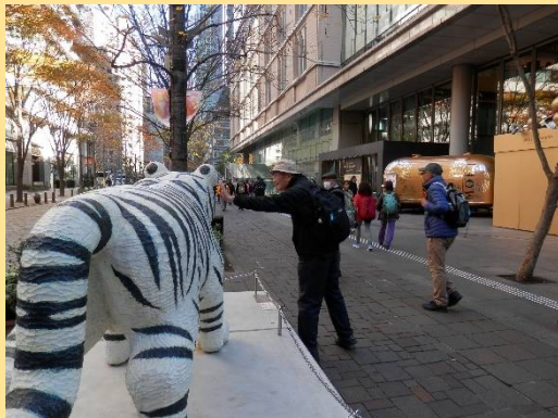
トラの像が・・・猫のような顔でした。