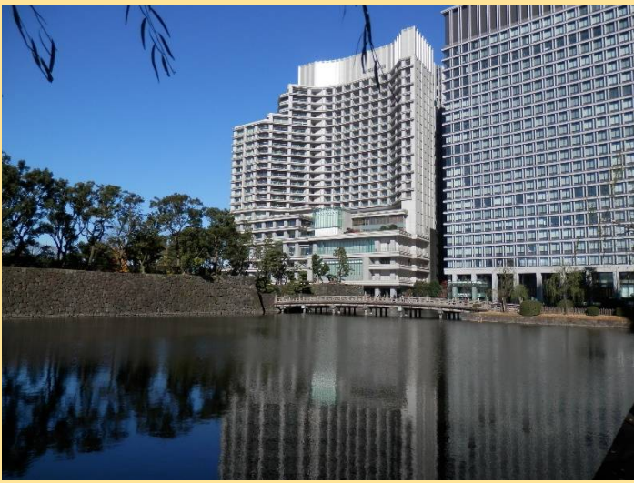
和田倉堀に影を落とすパレスサイドホテル。