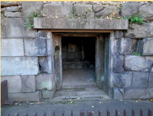
大奥の石室。抜け穴説も真実は不明。