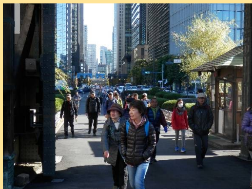
江戸時代なら庶民は入れない場所です。