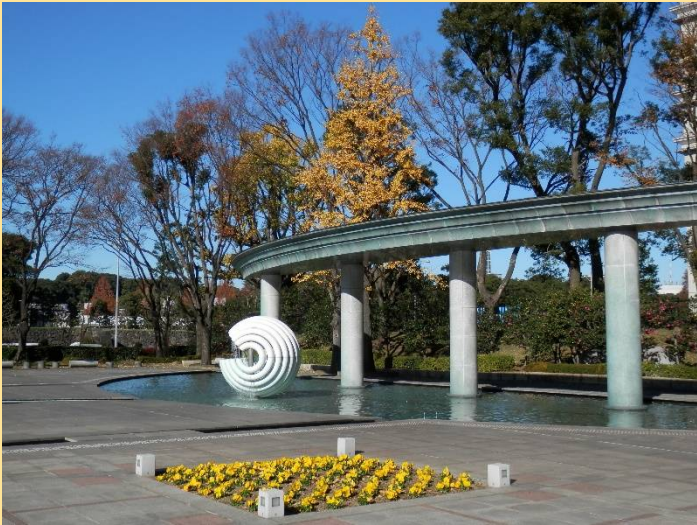
噴水公園内の球体噴水。夜はライトアップに。