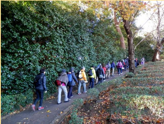
今日一番の上り坂かも。でもすぐ下りです!