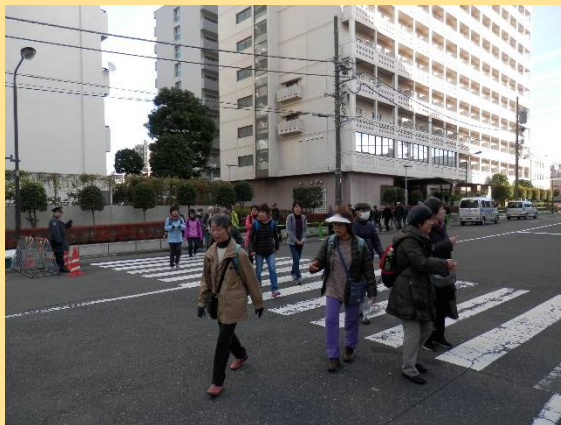
さあ境内から出て駅へ。