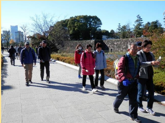
朝日に照らされてKWC御一行が行く！