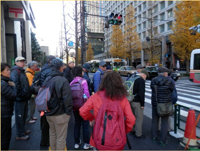
南口を出てオフィス街へ。