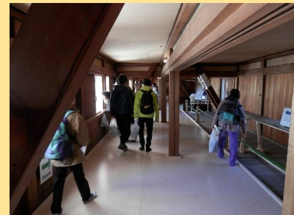
多聞櫓の内部が特別公開されていました。