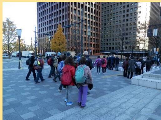
寒々とした歩道。陽射しが恋しい！