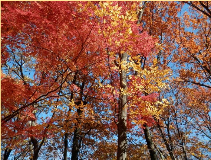
今年最後の紅葉、何時までも見ていたいような・・・