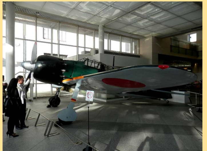
遊就館でゼロ戦を見ましたが感慨深いものがあります。