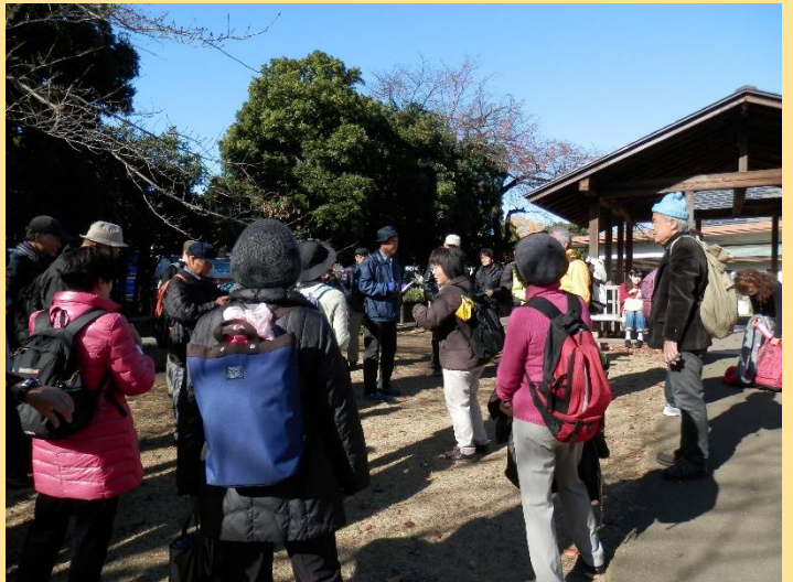
栗田リーダーより「ここで昼食にします」の声。