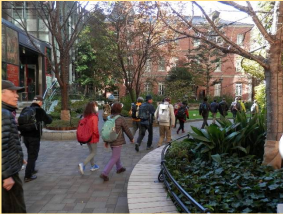
丸の内ブリックスクエアの中を通り・・・