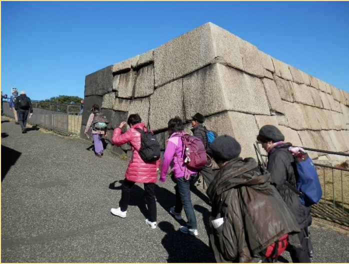
最後の登りは天守台。江戸城の北側に位置します。