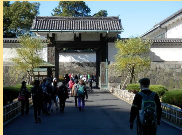
東御苑には大手門から入城（入苑）します。