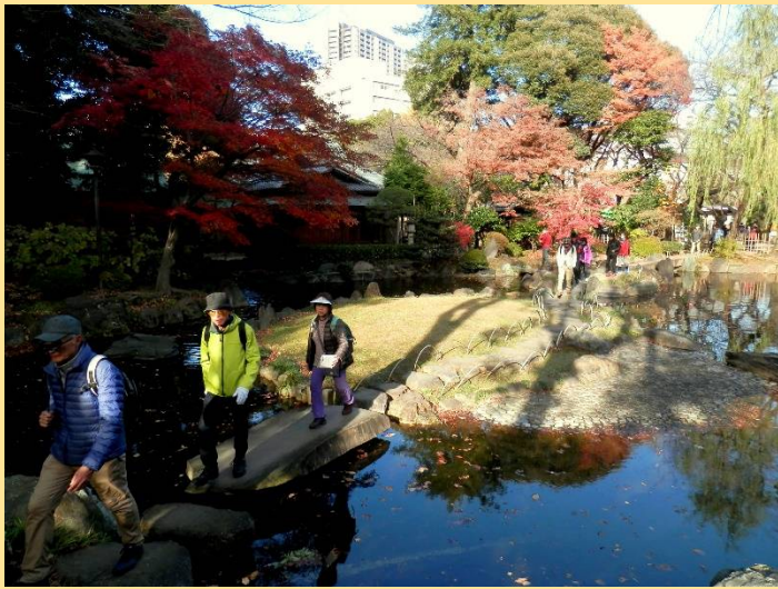
神池庭園の紅葉と池に映る青空が綺麗です。