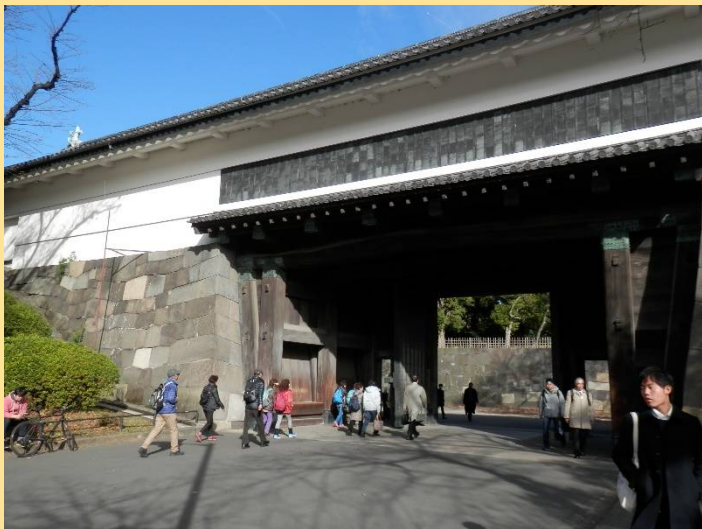
北の丸公園を田安門から出ます。