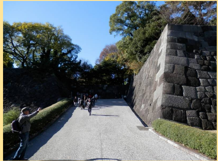
ここは汐見坂。ここから江戸湾が一望されたそうです。