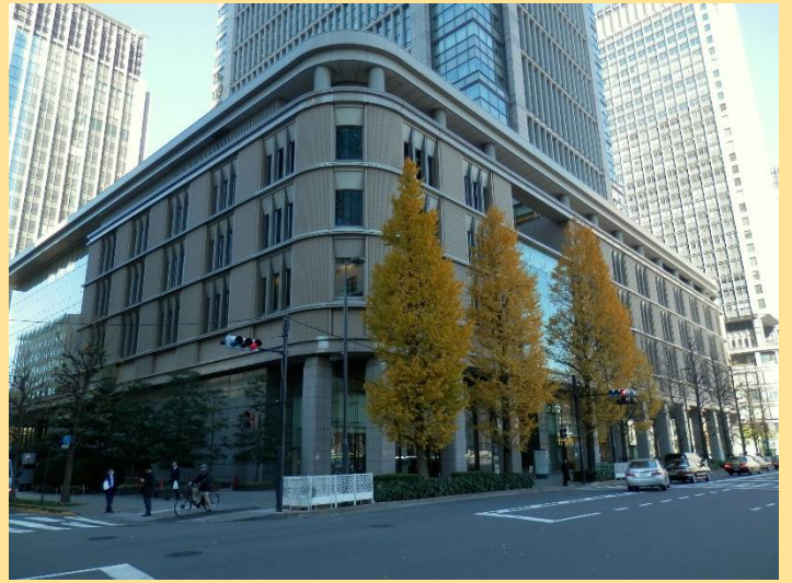
まだ陽が当たっていない丸ビルには3本の銀杏が。