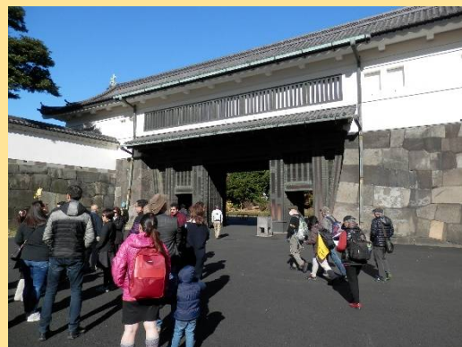
大手門。藤堂高虎が造ったもの。