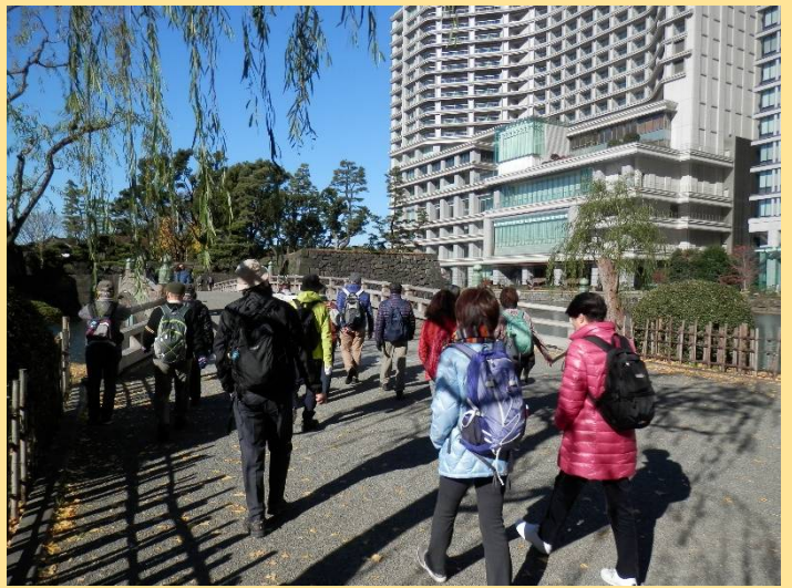
和田倉橋を渡り江戸城の縄張りに侵入！