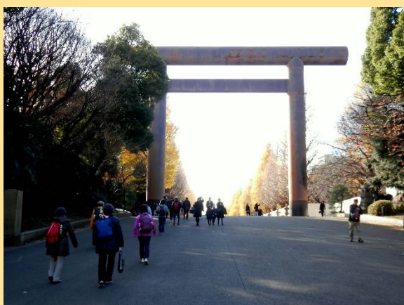
九段坂といえばこの靖国神社の大鳥居です。