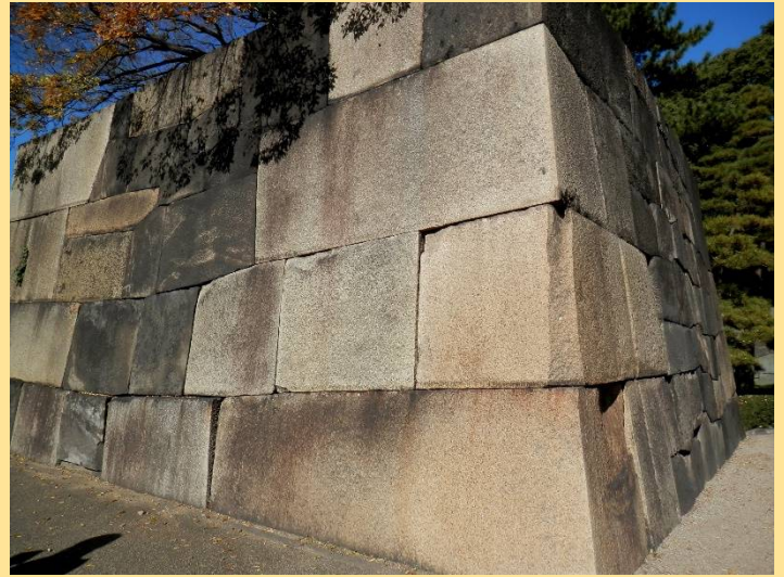
石垣の積み方も見どころです。左は野面積みで自然石のまま積んだもの。右は切込接ぎで石の面を加工したもの。