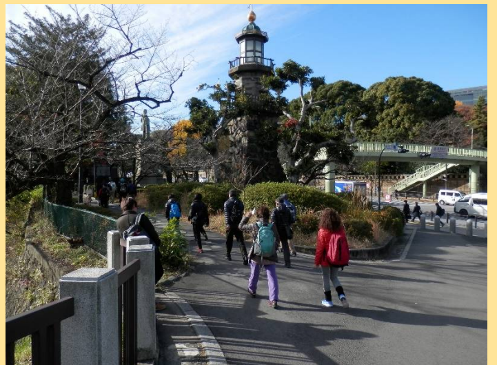
目の前は靖国神社ですが一旦やり過ごし・・・