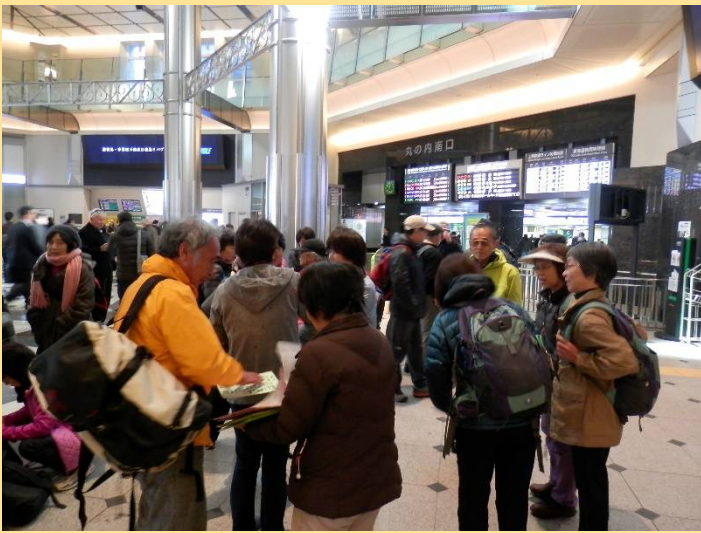
朝の東京駅南口。リーダーも名簿確認で多忙？