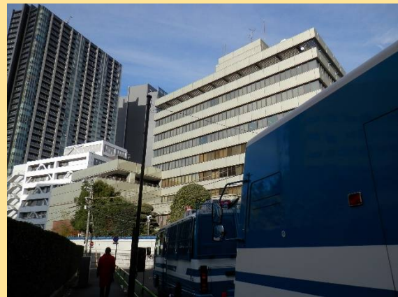
朝鮮総連。以前中に入ったことがあります。