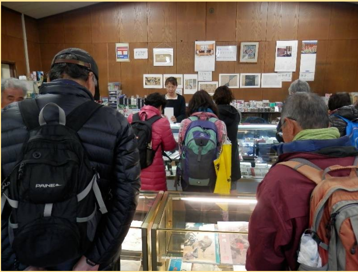
休憩所で菊の紋章入りグッズのお買い物タイム。