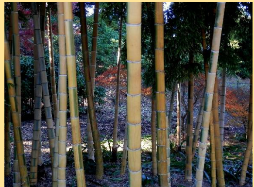
ミニ竹林には多種の竹があります。