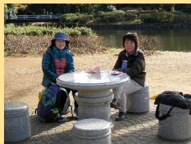
ランチタイム風景は、気が付いたら皆さん殆ど食べ終わった後でした! m ( _ ) m”