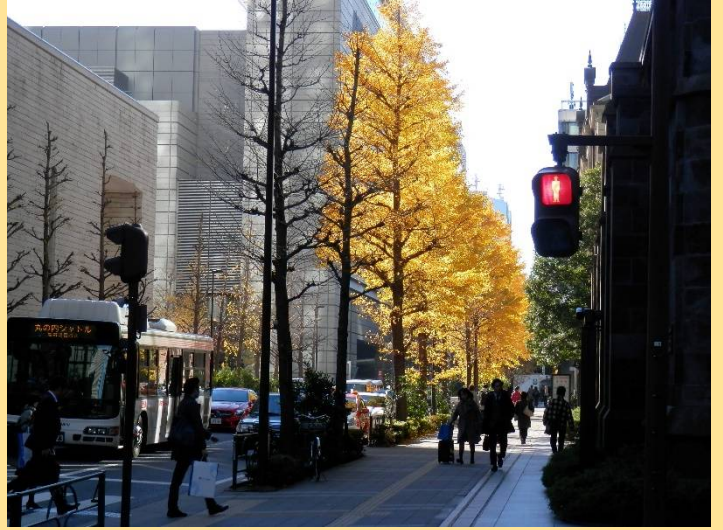
“三菱村”の銀杏にやっと陽が当たってきました。