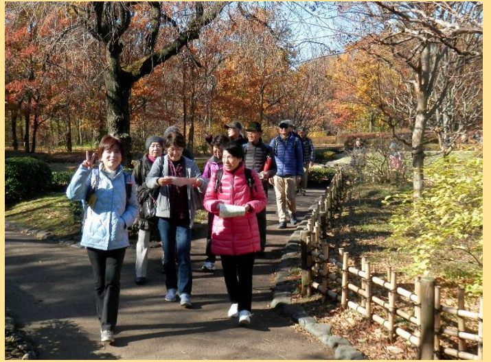
サインはV? (このカメラ目線、頂きました!)