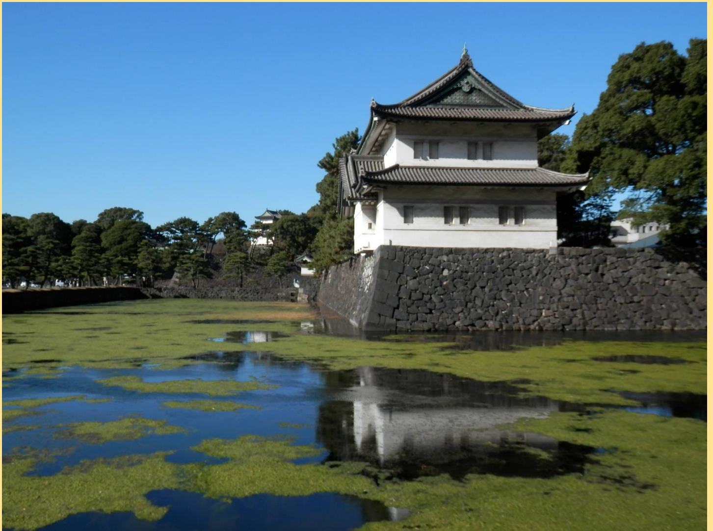
江戸城富士見櫓。天守焼失後は再建されずこの櫓が天守の代わりとなりました。(誰が撮ってもこの角度でしょね)