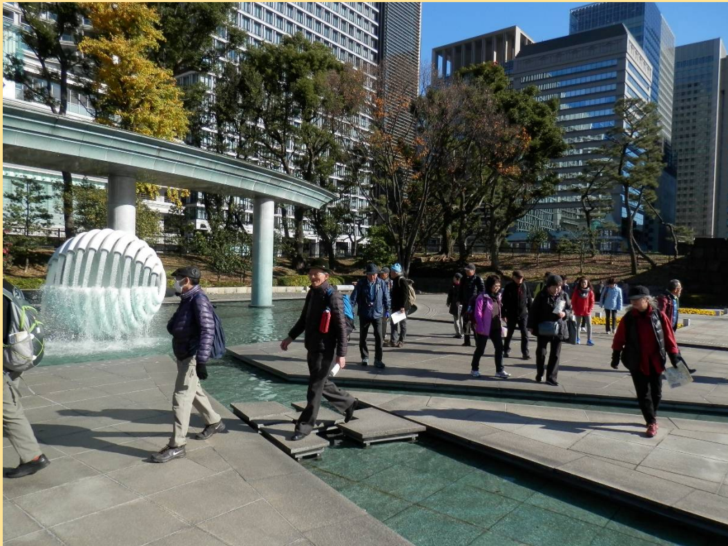
さあ出発・・・でも後で分ったことですが、この人工池に“落ちた”人が一人！ そしてこの公園にバックを忘れたまま歩き出したボケが一人・・・これは私でした！