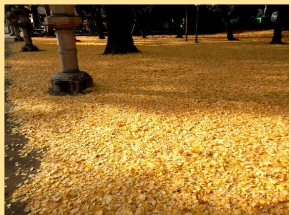
境内は一面落葉の絨毯となっていました。