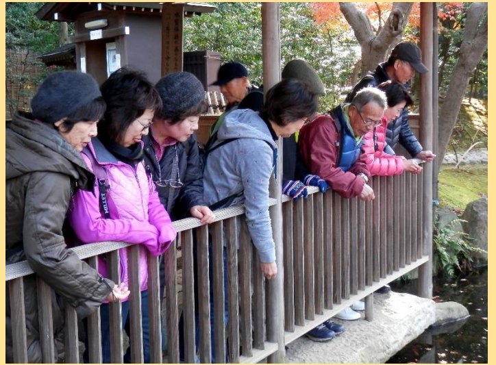
池の鯉に餌をやるも、鯉に食欲が無いようで・・・