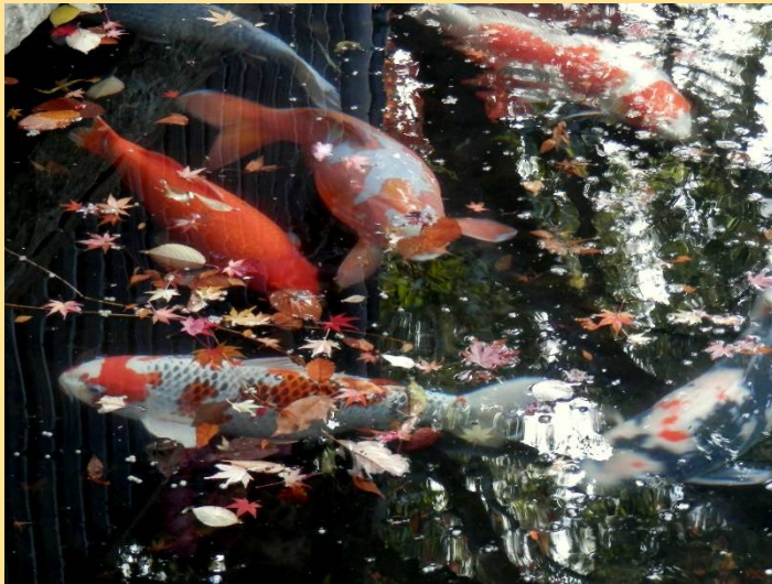
どれも高値で取引されそうな錦鯉ばかりです。