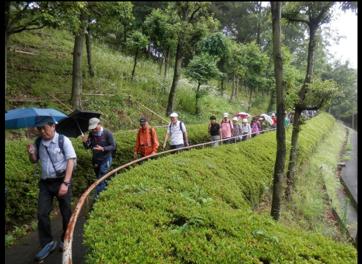
ここは開発当初からの公園で、小山の中腹になります。