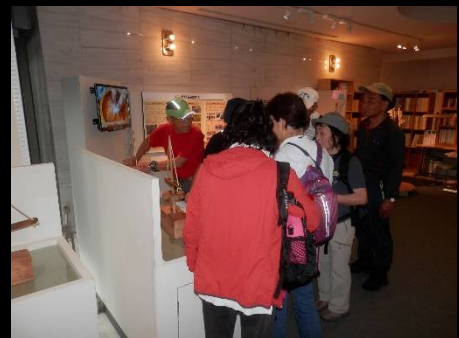
縄文時代の火おこし体験中！

[東京都埋蔵文化財センター]現在の場所に建物が作られたのは昭和60年で、多摩ニュータウン No.57 遺跡の西側部分を発掘調査して建設されています。この建物の当初の目的は、多摩ニュータウン内で見つかった土器や石器類の出土遺物を収蔵することでしたが、一部に附属施設として「展示ホール」を併設。隣接する屋外には遺跡庭園「縄文の村」があります。