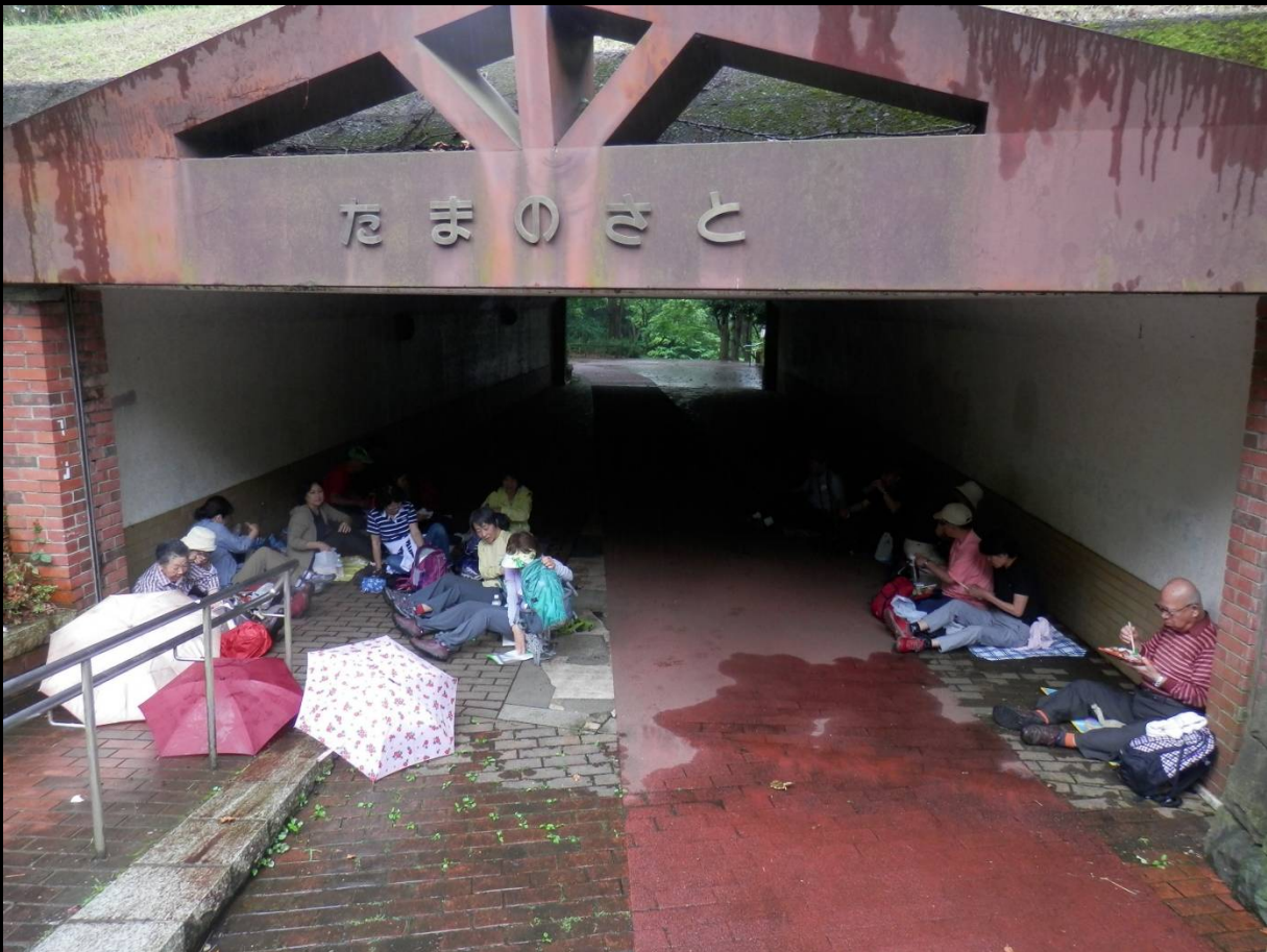
こんな人道トンネル内でのランチも粋なものかも？ 雨男のせいで申し訳ありませんでした！