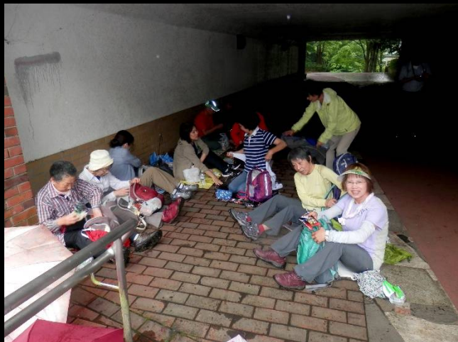
女性陣は何処でも楽しんでしまう特技をお持ちで！