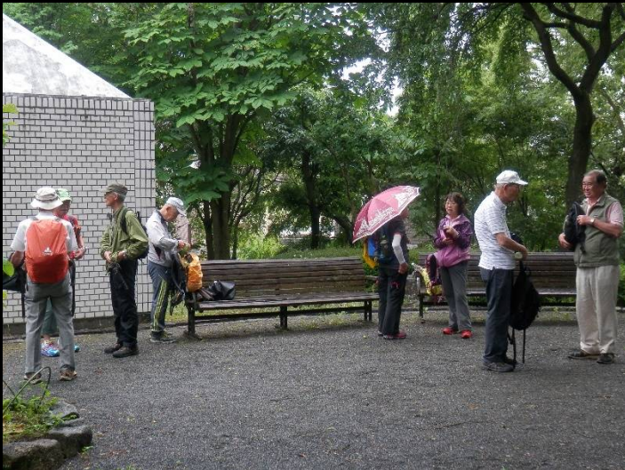
豊ヶ丘北公園でトイレ休憩。