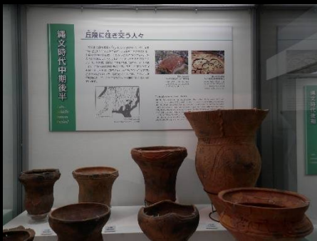
館内には出土品の数々が。