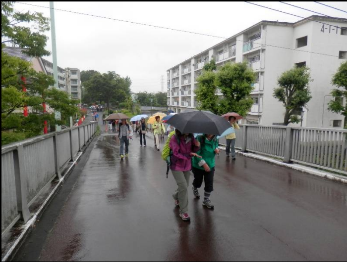
予報では、もう止んでいいはずですが・・・