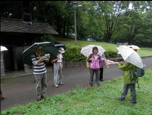
トイレ前で人員点呼。身仕度はOK？