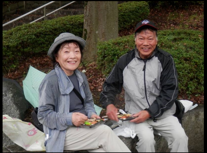
こちらは夫婦水入らずで・・・でも雨で水入りかも？