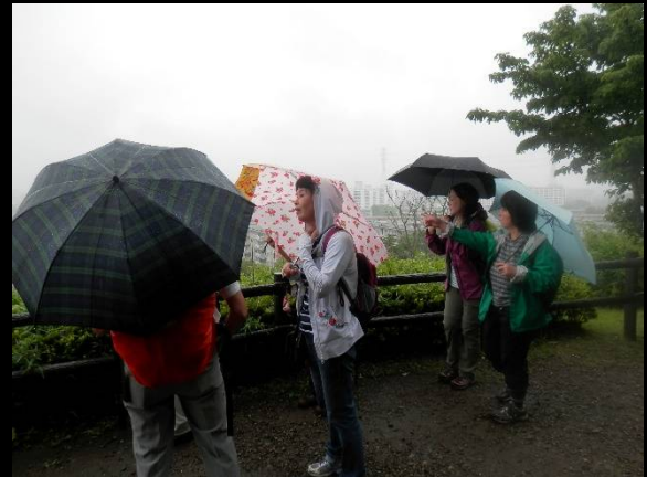
展望広場も下界は霞んでいます。