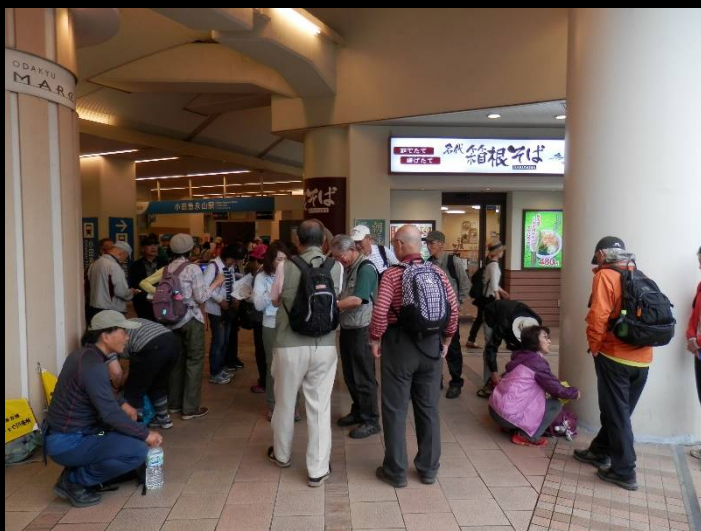
朝の小田急永山駅。皆さん早めの集合でした。

♪雨々ふれふれもっとふれ〜♪ 歌に唄うのは良いが、こう降られるとねえ…今日は最後まで雨に祟られた一日でした。予報では日中は曇り空のはずだったのですが、先の平塚での例会の雨をどなたかが引きずって来てしまったようです！この日歩く多摩ニュータウンは、稲城市・多摩市・八王子市・町田市に跨る多摩丘陵に計画された日本最大規模のニュータウンです。昭和41年に事業が決定し、昭和46年に諏訪・永山地区の第一次入居が始まりました。ただこの時点では交通インフラの整備が出来ておらず、通勤・通学では京王線の聖蹟桜ヶ丘駅まで、バスやタクシーを利用するしかありませんでしたが、昭和49年になって小田急・京王両線が開通し住民の足が確保されました。域内は人道と車道が立体的に分離し、駅から各団地まで車道を通らずに行くことができ、また緑あふれるプロムナードが延びて快適な住環境が確保されています。南側の尾根部分には「よこやまの道」が通り、古代の旅人の苦勞に思いを馳せることが出来ました。 <フォトレポート 小島>