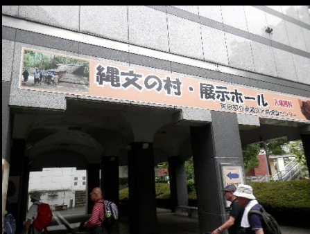
東京都埋蔵文化財センター。