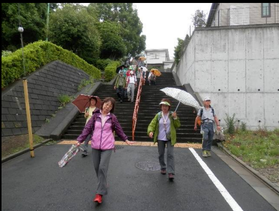
車道に下りて来ましたが、このポーズは何？