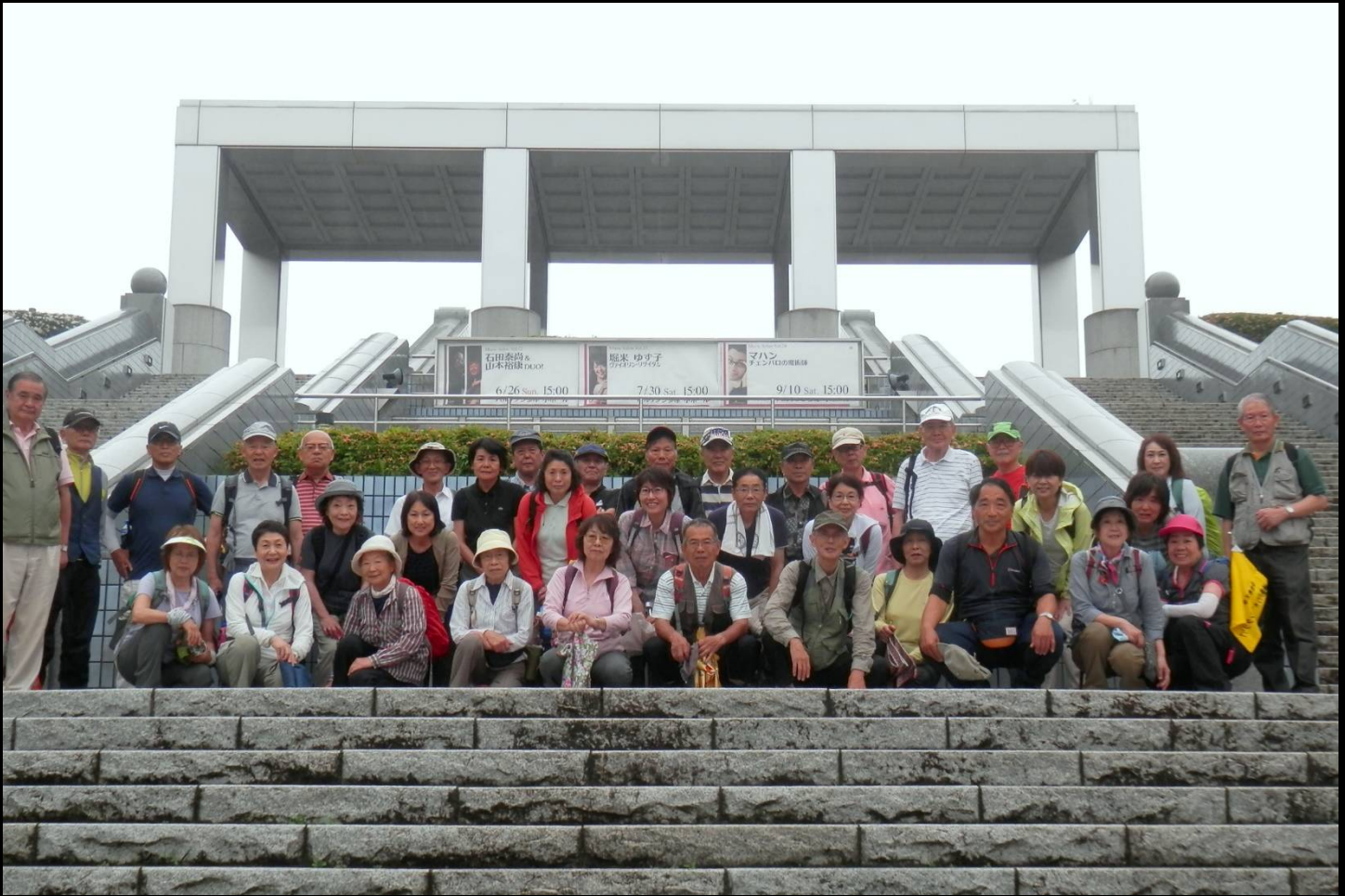
ギリシャで集合写真？ ここはその名も「パルテノン多摩」の大階段です。（最近日も悪いせいか、左側が切れました）