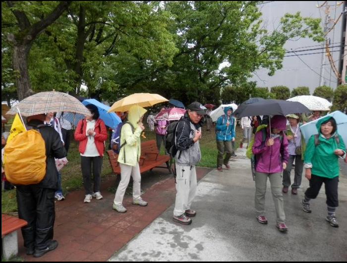
コース説明が終わり、雨仕度を整えて出発！