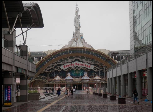
多摩センターの象徴、サンリオピューロランド。