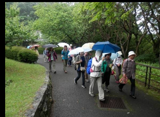
到着！ここが昼食場所になります。