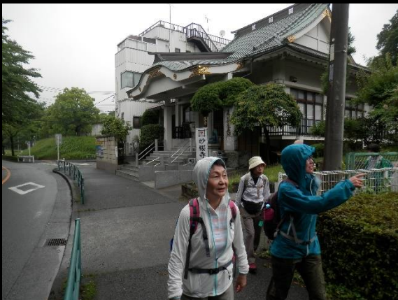
妙桜寺の墓地でした。買う？