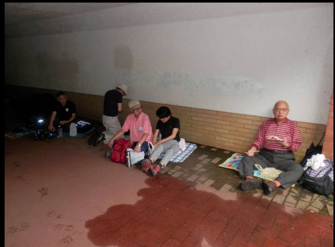
さすが重鎮はここでも画になります！