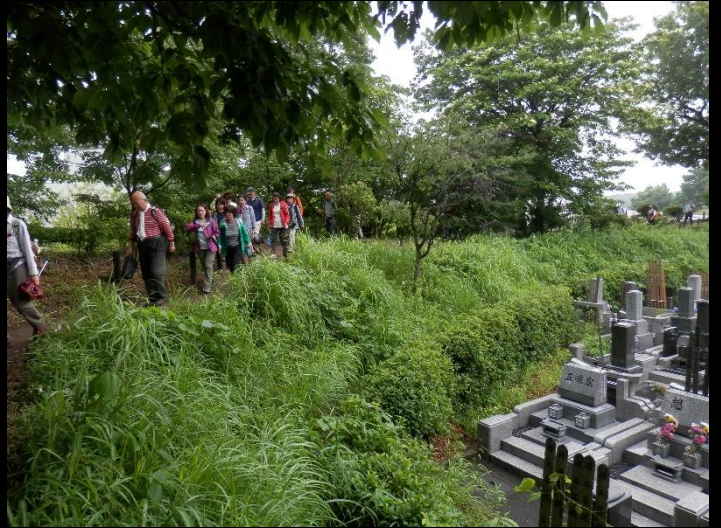
お墓を見下ろしながら・・・やはり気になるようで。