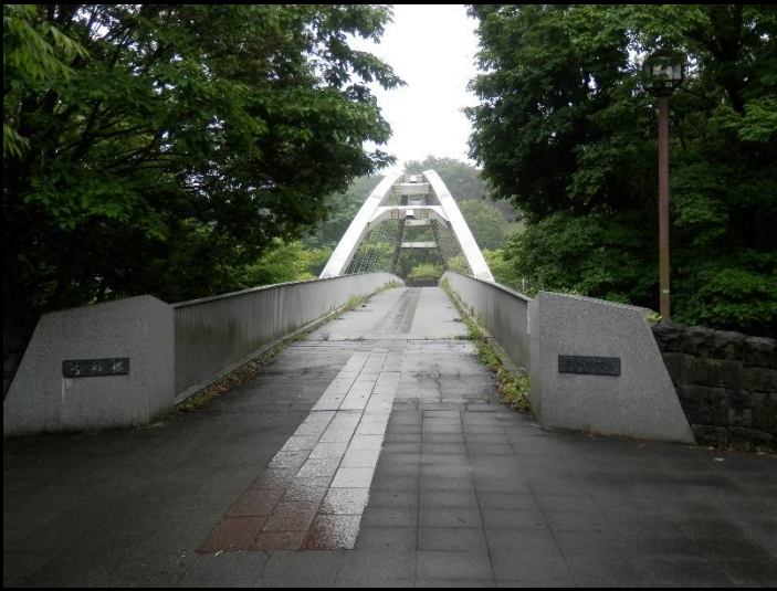
その名も「弓の橋」。渡ってみましょう。