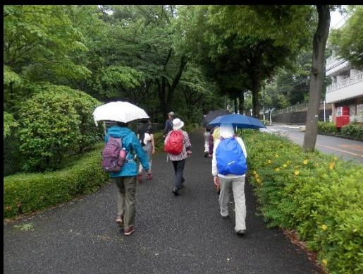
もうすぐ一本杉公園です。