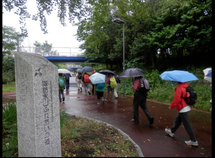
ここから「ふれあいの道」に入ります。