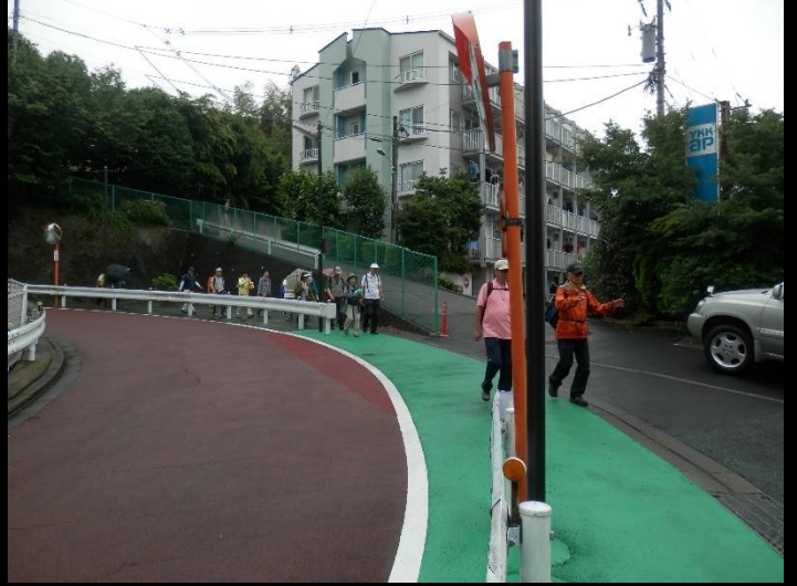
下り坂の車道区間。車の往来は殆どありません。