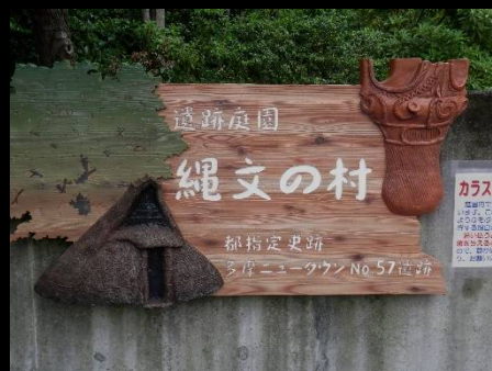
屋外には「縄文の村」があります。