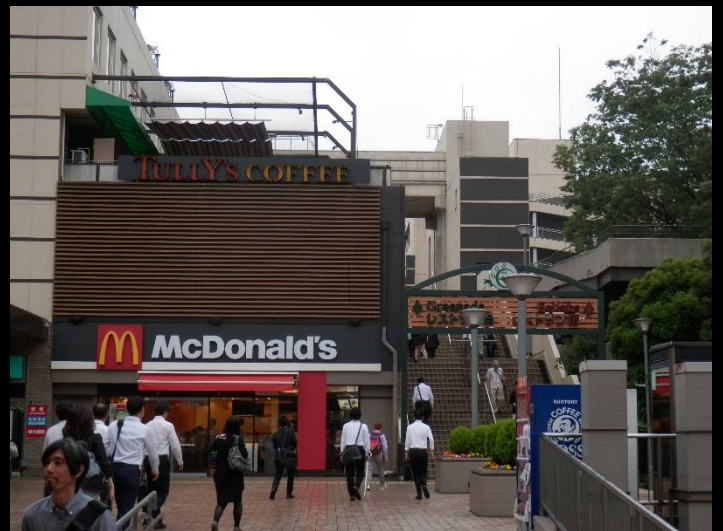
駅から続く複合商業施設「グリナード永山」。