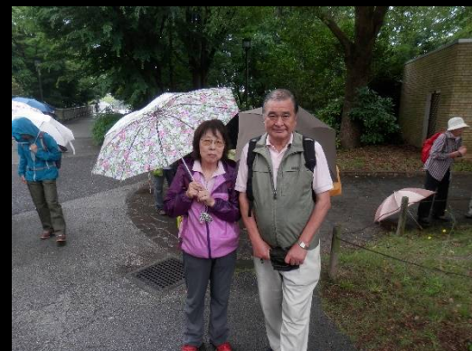
何とも微妙なショットで済みません！