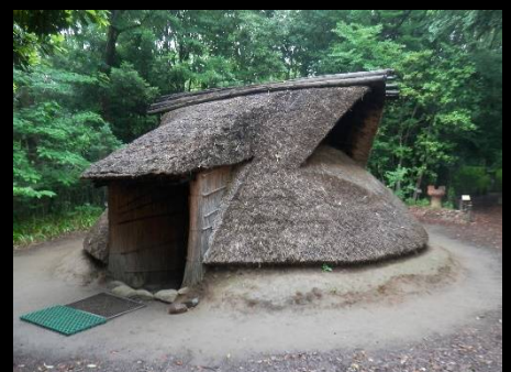
この地域で発掘された復元家屋も。