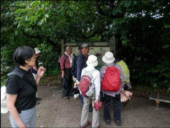
よこやまの道の案内板。分かりにくい区間です。