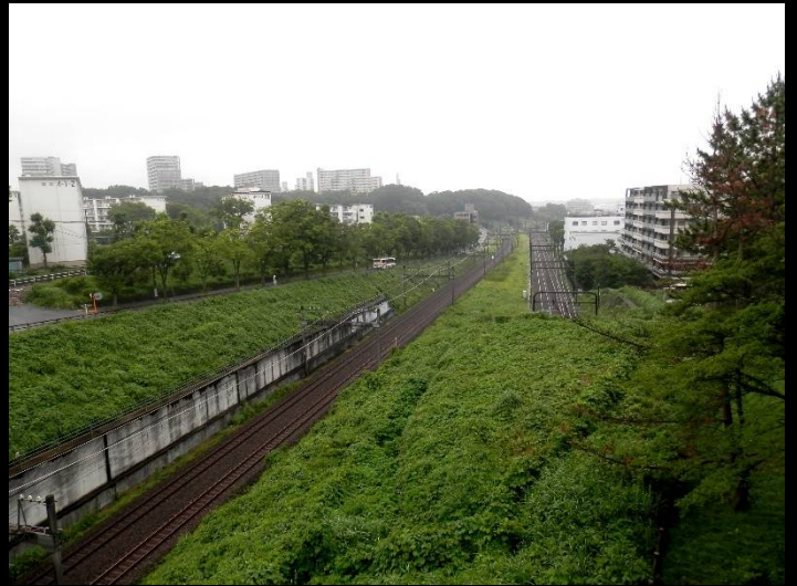
「電車見橋」から。左は小田急、右が京王線です。