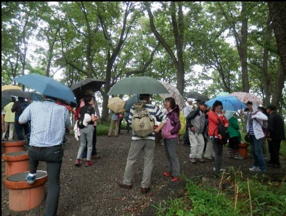
明るくなってきたが雨止まず。