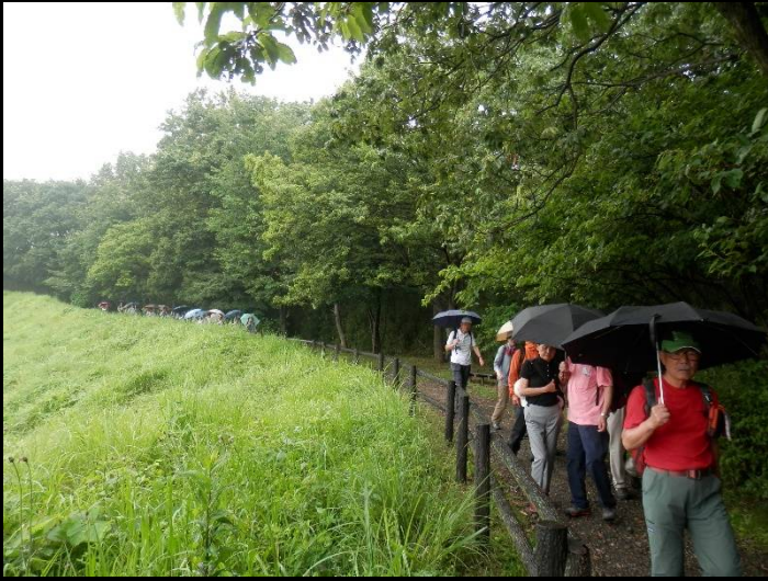
景色は霞んでも雨に濡れた緑が綺麗です。