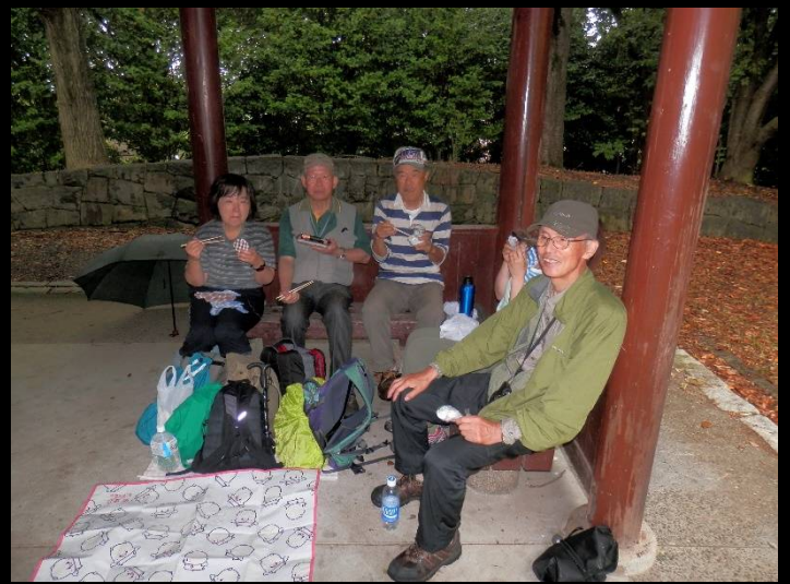
ランチタイム。唯一の東屋は先着順！でも“女性優先”と言ったはずですが・・・