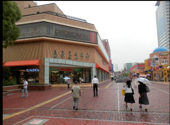
“神殿”を後にパルテノン大通りを歩き駅へ・・・商業施設が集中する中心エリアです。