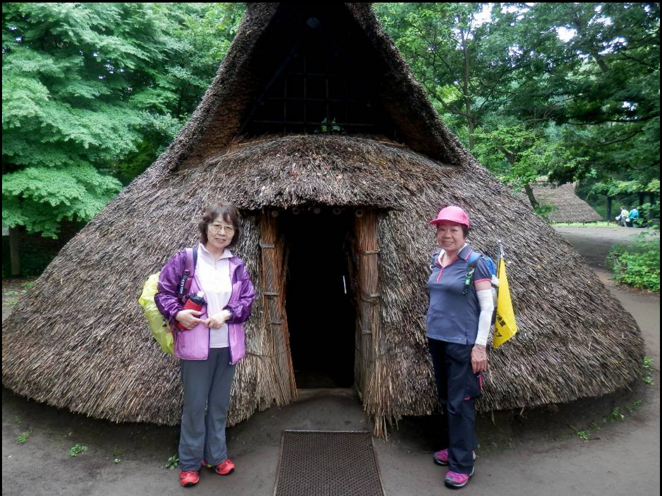
こちらは現代に蘇った縄文人？ いえ、昭和の女性代表です！（表現に微かな箇所がありました！）