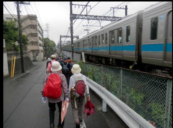
小田急多摩線に沿って歩きます。