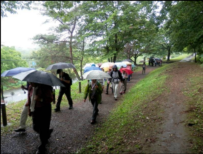
ここから「よこやまの道」が始まります。