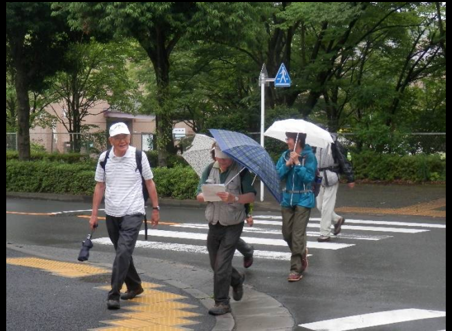
一本杉公園を出て午後の部スタートです。