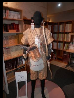
縄文ファッション？