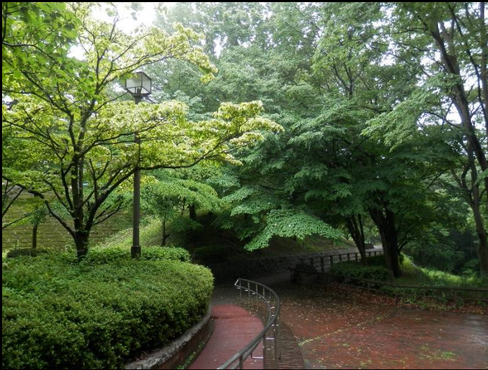
園内は雨に濡れた木々の緑が目にはみえます。