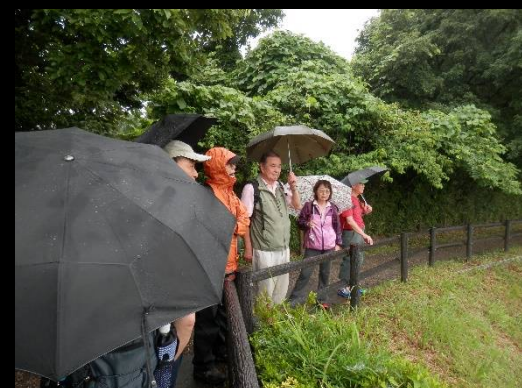
でも皆さんの視線は景色を捉えています。