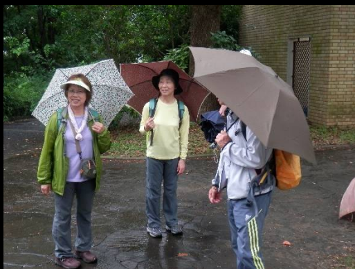
束の間でも話に花が咲くようで・・・