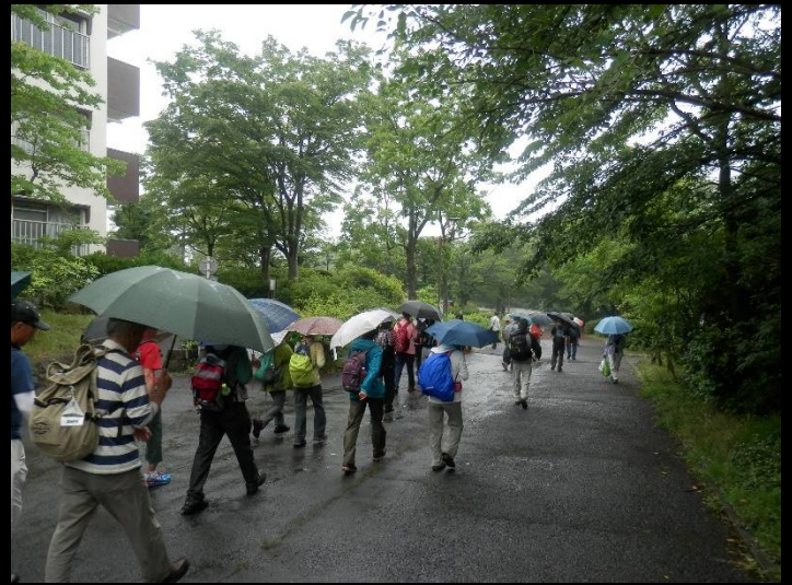
この「豊ヶ丘スクールロード」は、車道を通らずに通学できる安全な人専用道路です。