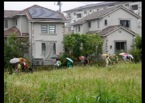
南野スカイブリッジを渡り、豊ヶ丘団地に入りました。