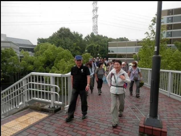
センターから歩行デッキに出ます。

[東京都埋蔵文化財センター]現在の場所に建物が作られたのは昭和60年で、多摩ニュータウン No.57 遺跡の西側部分を発掘調査して建設されています。この建物の当初の目的は、多摩ニュータウン内で見つかった土器や石器類の出土遺物を収蔵することでしたが、一部に附属施設として「展示ホール」を併設。隣接する屋外には遺跡庭園「縄文の村」があります。