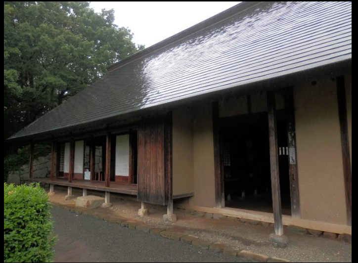
2棟の古民家がありますが、皆さん見飽きていますね！