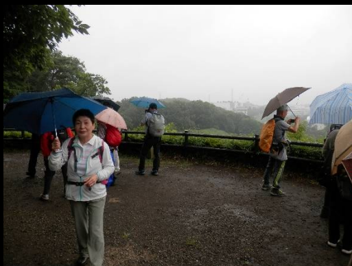
肝心の全景写真を撮るのを忘れました！