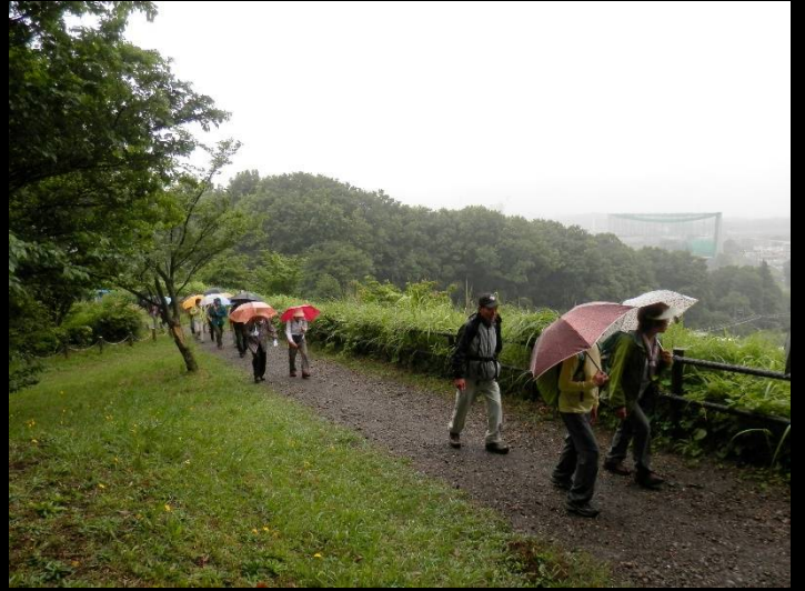
画面右側は川崎市との境界ですが雨に霞んでいます。