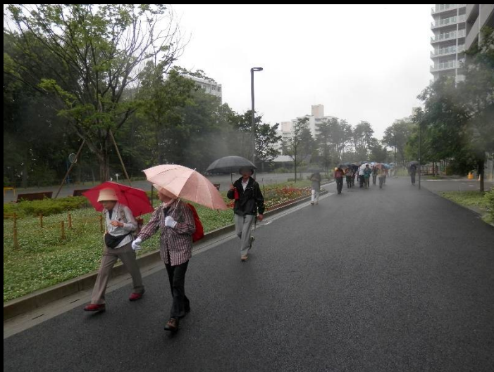
ここからは諏訪団地内のプロムナードを歩きます。