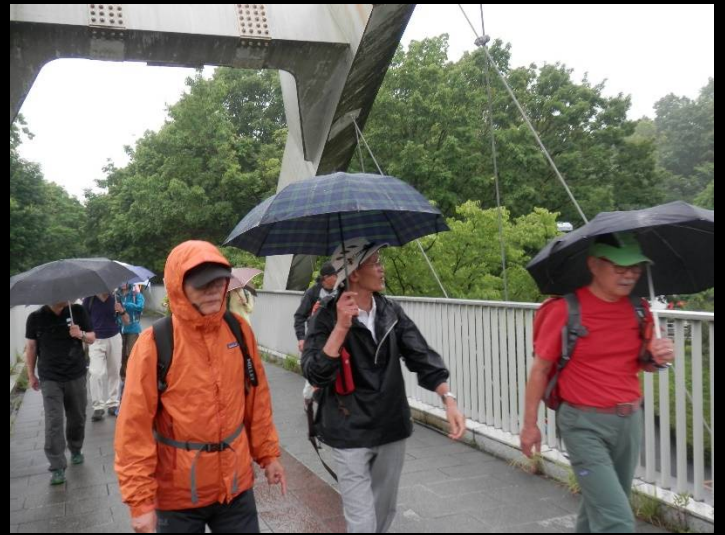
橋の上はこんな感じで・・・まあ普通の橋です。