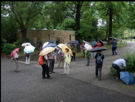
この先暫くトイレがないので多摩東公園でトイレ休憩。