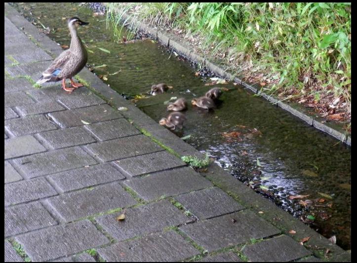
カルガモ親子に気を取られてクールダウンを忘れた～！