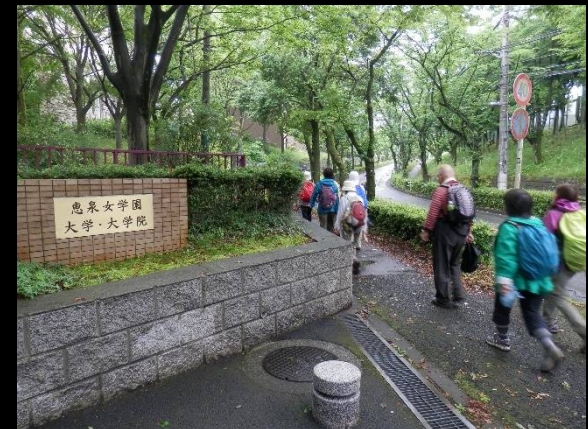
恵泉女学園大前に出ました。