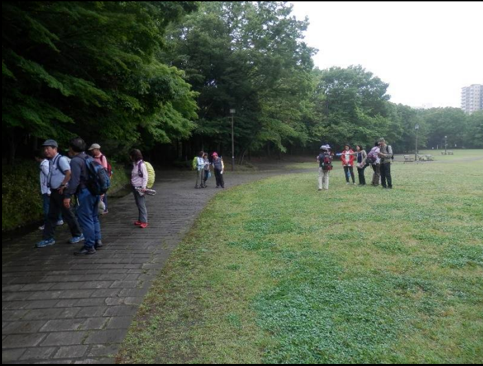
最後の多摩中央公園に到着したもの・・・