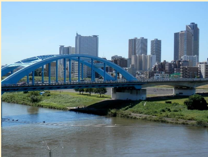
この青い丸子橋を川崎側へ渡ります。(濁った水の色)