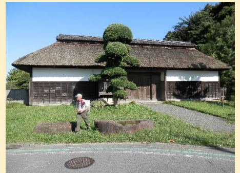
その先にはこんな古民家も。