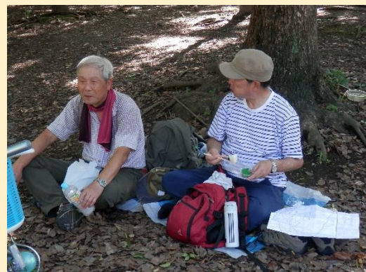
食事はよく噛んでゆっくりとね！