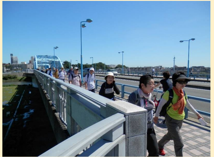
姉さんお二人のお通り！そこよけて下さ〜い！？