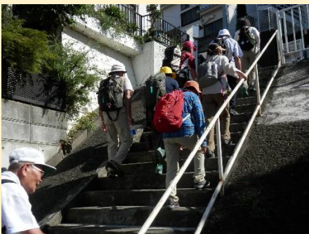
またまた急階段が・・・もうダメ！