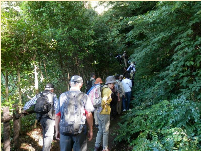
ここにきてまた上り？森の中なので涼しくなるかも！