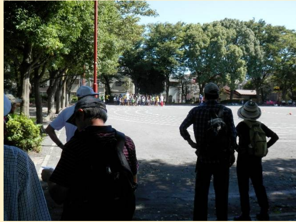
食後は地元町内会の運動会見物？