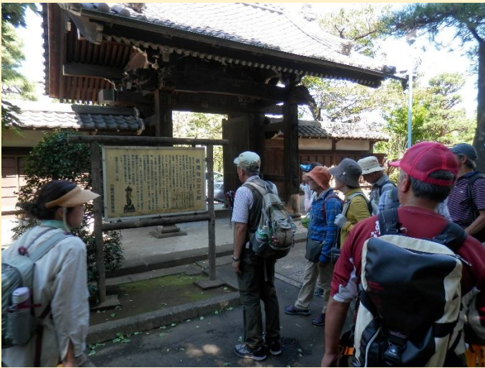
中原街道沿いの泉澤寺は世田谷吉良家の菩提寺。