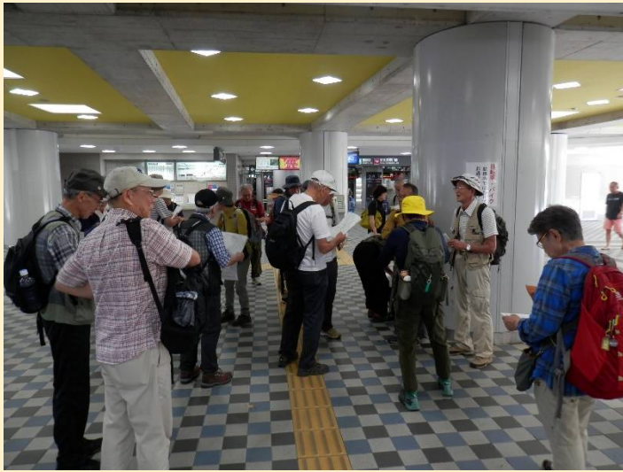
朝の多摩川駅改札前。一般参加者3名が待てど来ず。