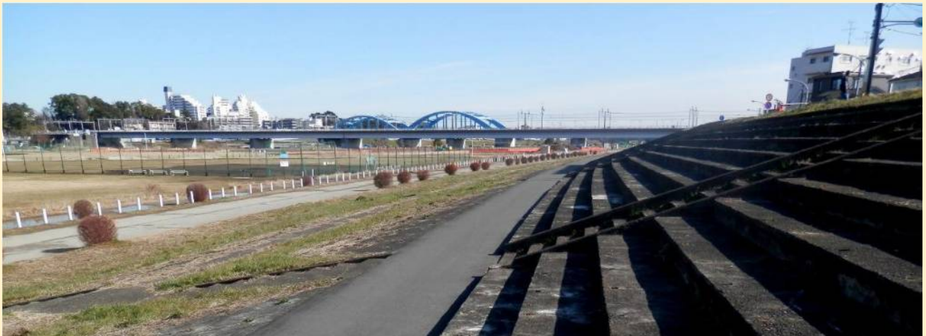
その観戦スタンドの跡が今も階段状に残っています。野球練習場になっている周囲がコースでした。