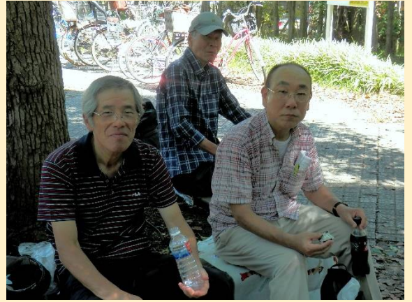
今日も元気で弁当が旨い！これ大切なこと。