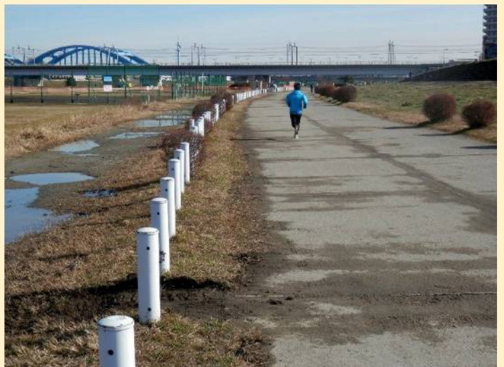
かつて日本初のサーキットがここにありました。