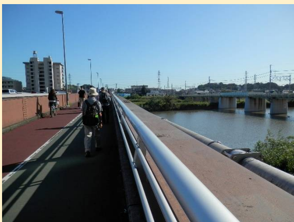
網島街道の大綱橋を渡る。下は鶴見川です。