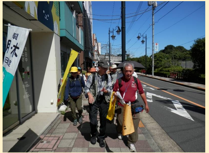
駅を出ると早速強い陽射しが平石しを襲います！