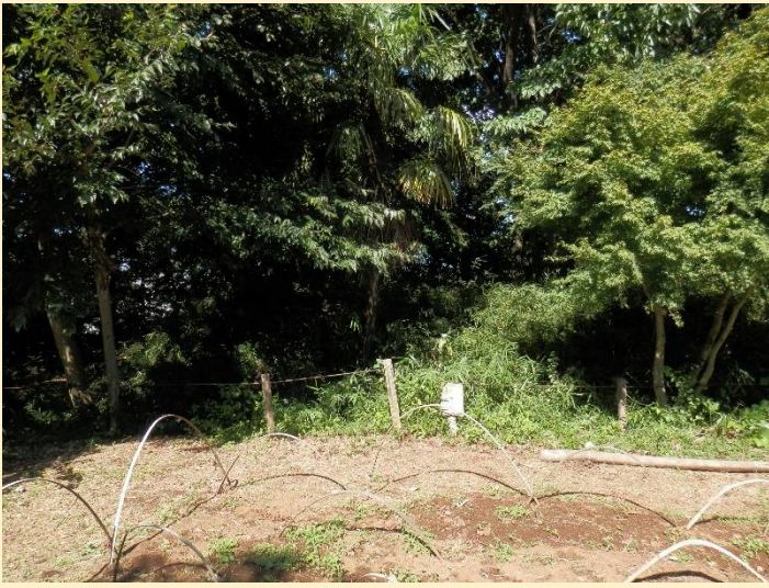
ここは蟹ヶ谷古墳群。川崎市内唯一の前方後円墳も。