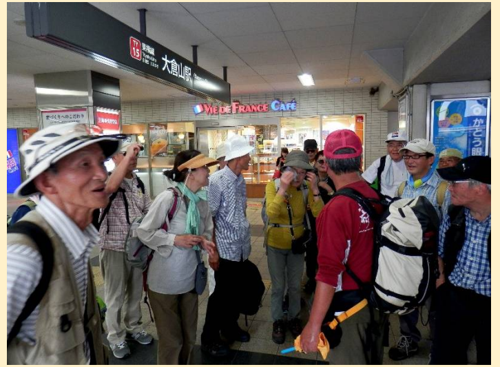
ゴールの大倉山駅で解散。皆さんお疲れ様でした！