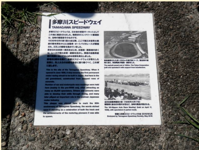
土手には「多摩川スピードウェイ」の銘板が。