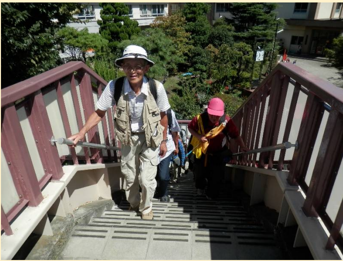
中原小学校前の府中街道の歩道橋を渡ります。