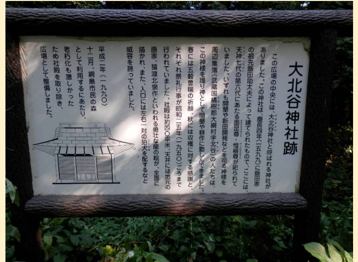
こんな山の中にかつては神社があったそうです。