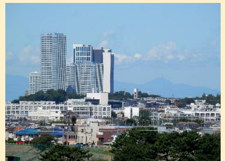
浅間神社からの展望。富士山から奥多摩方面、秩父連山も見えるのかも？（山は詳しくないもので・・・）