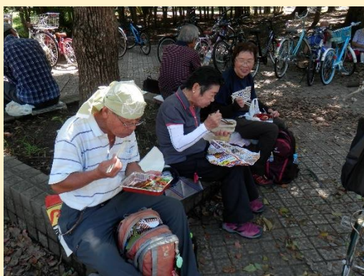
お待たせ〜、橘公園でランチです。