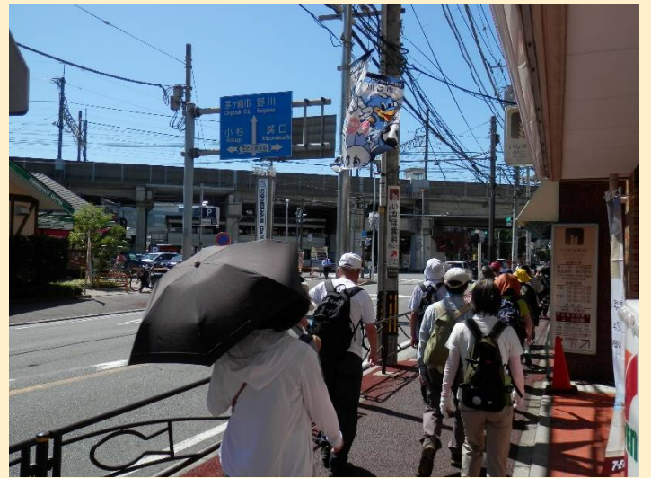
街道は武蔵中原駅脇を西に向かって延びています。