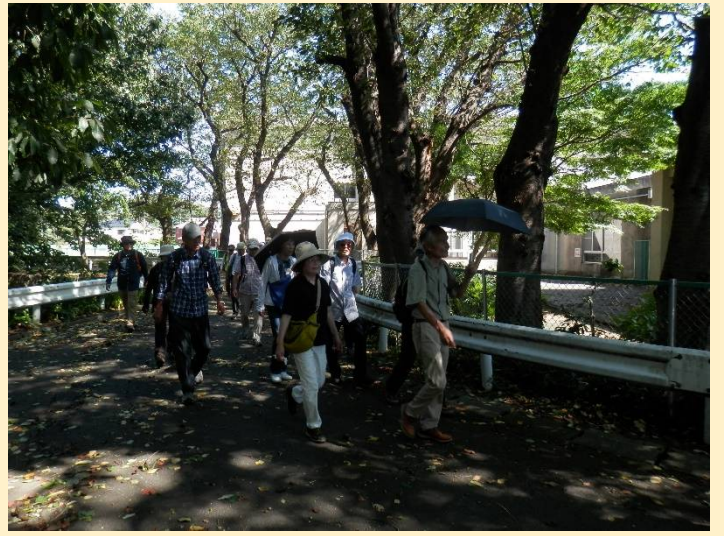
何かが付いて来ないように早々に古墳を後にします！？