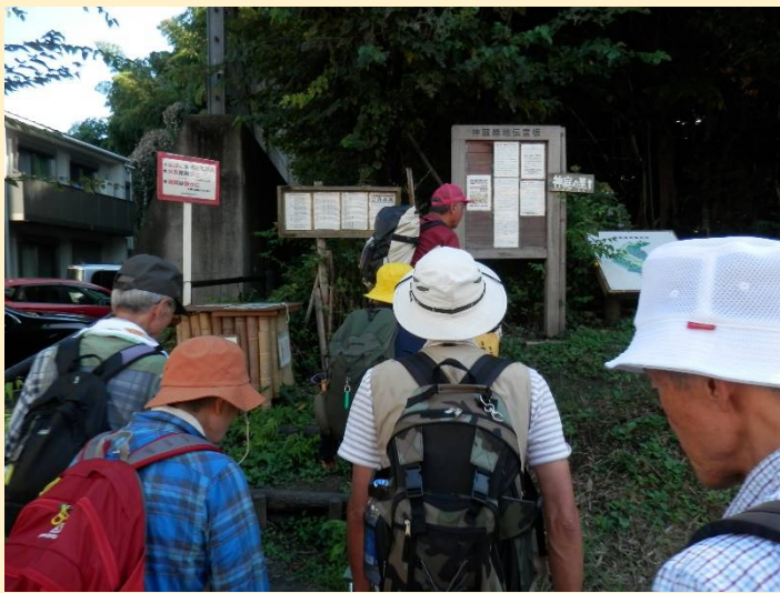
橘公園を出て「神庭の里」に入りますが・・・