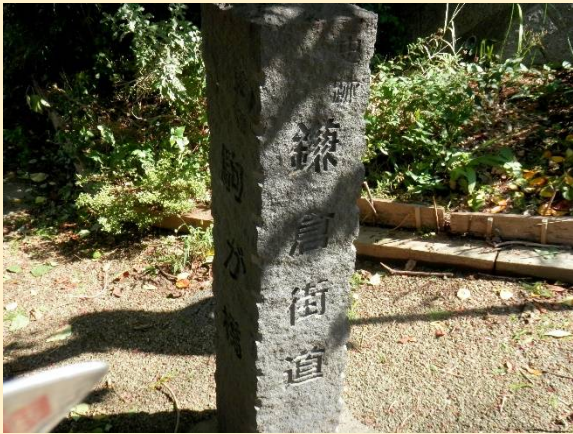
鎌倉街道の石碑がありました。