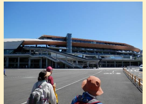
これが川崎フロンターレの本拠地。