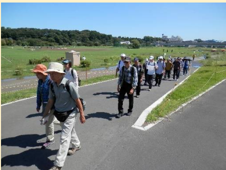
サイクリングコースを歩いて・・・