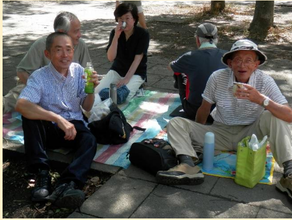
食後は日本人ならお茶でしょ！ハイ。