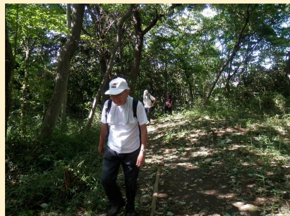
「大山」もこの程度なら良いのだが・・・