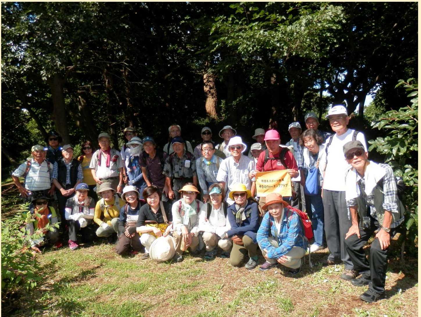
「神庭の里」にある蟹ヶ谷古墳群の円墳前で。と言っても分かりづらいですが後方の木立がその古墳です！

台風一過の抜けるような青空が広がり気温も30度を超え、真夏並みに大汗をかいてのウォークとなりました。ストレッチ場所の浅間神社からは、雨上がりで空気が澄んでいるお蔭で遥かに富士山が望め、その右側には奥多摩から秩父連山までクッキリと見ることができ、幸先の良いスタートをきることができました。丸子橋から見下ろす多摩川の水は濁っていて、台風の影響で上流域にはかなりの量の雨が降ったと思われます。暫くは土手のサイクリングコースを歩き等々力緑地で小休止。ここには等々力競技場があり「川崎フロンターレ」の本拠地でもあります。二ヶ領用水に出て中原街道を西へ、武蔵中原駅横を通りランチ場所の橋公園に向かいました。園内では町内会の運動会が開催されていたため、我々は周囲の木陰に場所を取り弁当を開きましたが、ここまでは木陰を抜ける風があり何とか我慢出来たものの、後半は予想以上のアップダウンとなり、平坦コースと思って参加したことが悔やまれる場面も。中でも蟹ヶ谷から日吉台付近は、多摩丘陵の南端にあたるため急坂が多く、地元住民はともかくも“アウェー”の我々にはかなり堪えました。最後のコースには「網島市民の森」の尾根道があり結構バテ気味、蚊の猛襲もあって早々に退散するもかなりの人が刺される始末。グリーンライン日吉本町駅を見てリタイヤする人もいましたが、大倉山駅まで完歩したのはさて何人だったのか・・・確認するのも忘れるほど疲れた一日でした。終わってみれば当初予定から4kmオーバーの16km！今回のコース、これ「やや健」だったのでは？