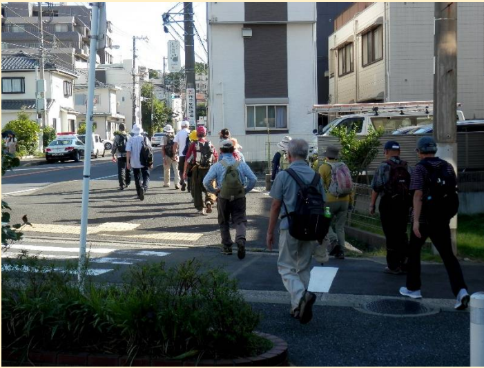
ここでまた綱島街道に合流します。あともう少し。