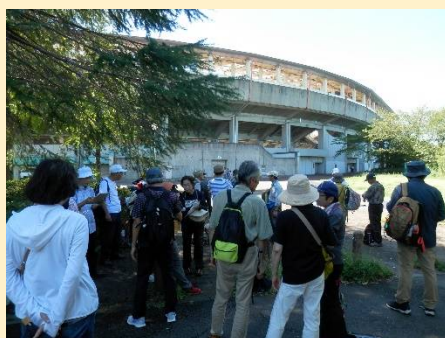
等々力緑地で小休止します。