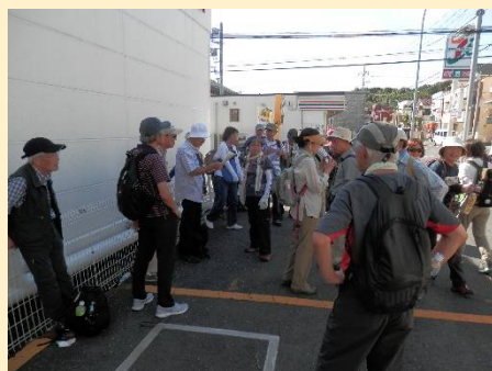
下ってスーパーの日陰で休憩。