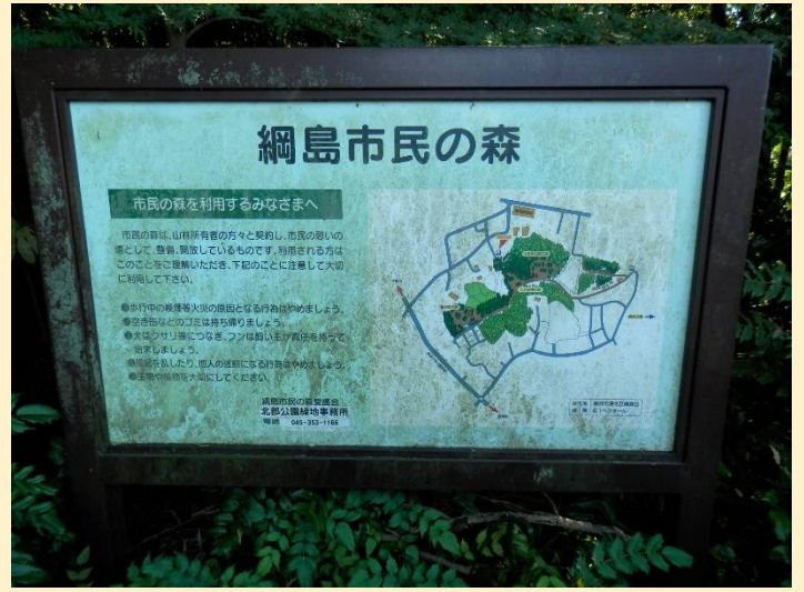
こんな所に「網島市民の森」があったとは・・・