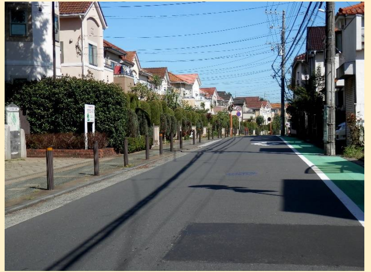
潇洒な住宅街。でもここは高台、買い物大丈夫？