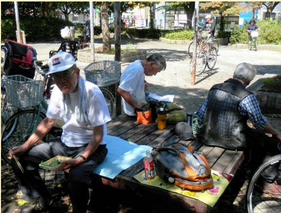
何故か自転車に囲まれて食べています・・・