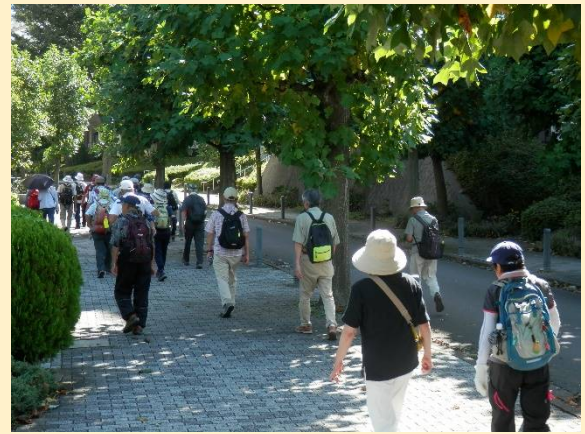
ここは日吉本町辺りか。綺麗な街路樹も。