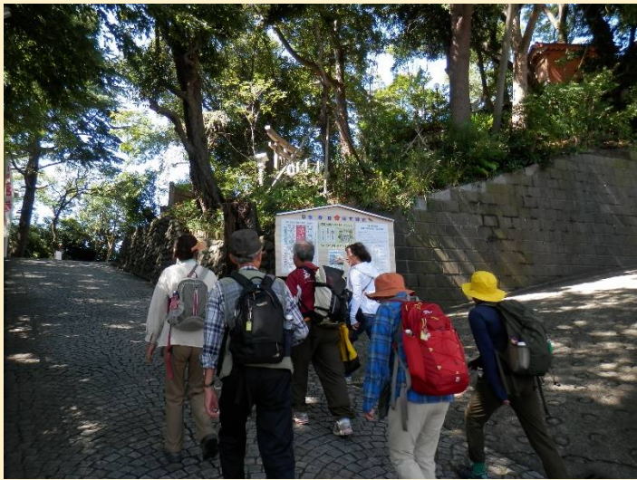
まずは浅間神社への登坂路で足慣らし？