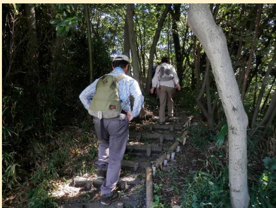
ここまで上れば後はもう楽勝。