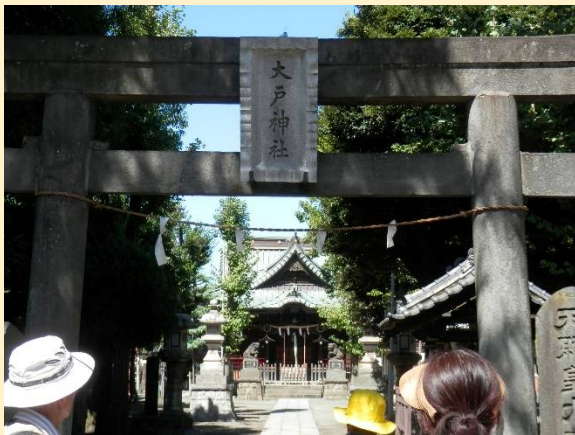
大戸神社に立ち寄りここで水分補給の小休止。ランチ場所まだ〜〜？