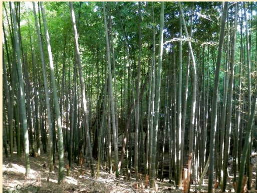
綺麗な竹林。この先で蚊の猛襲が！