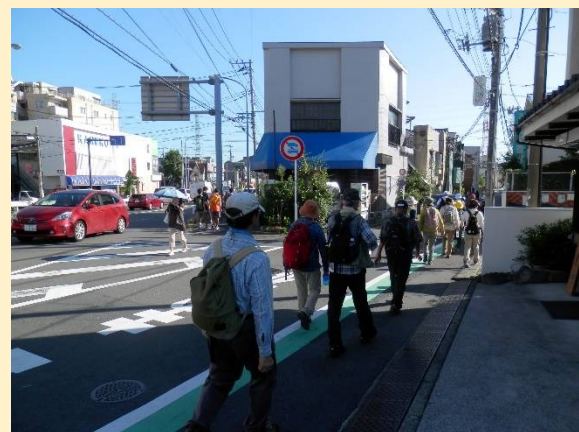
旧道に入りますが、ここも鎌倉街道？