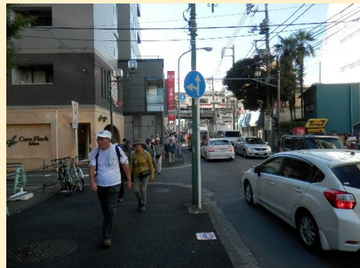
途中カット。網島駅を抜けます。