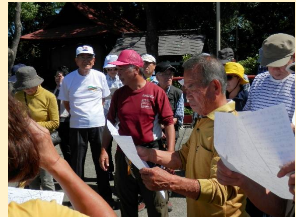
平石しからコースの説明と一般の方の紹介。