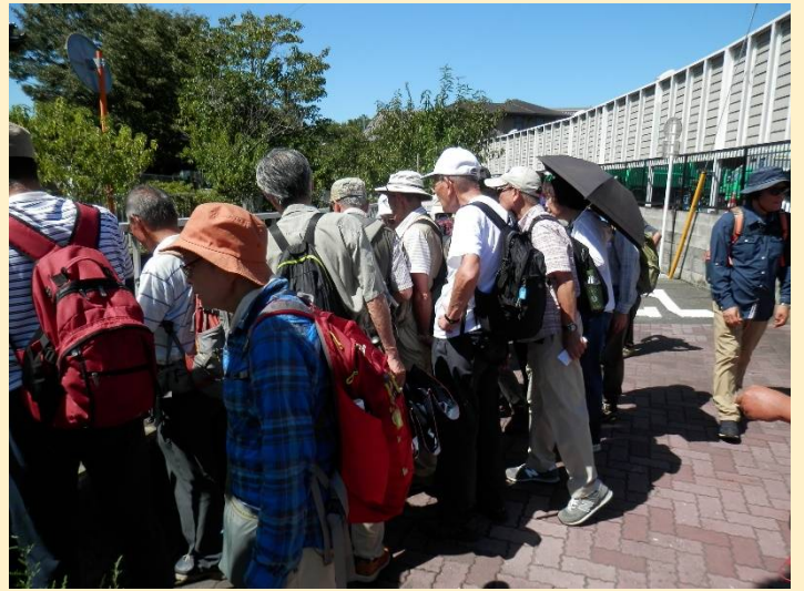
下りるとニヶ領用水。私が毎晩歩いている場所です！