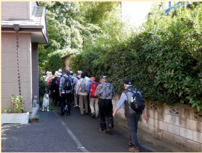
おい、ここはオレの家だワン！でも公道でしょ？