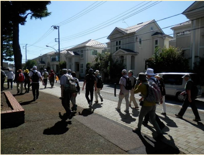
だいぶ影も長くなってきましたがゴールはまだ先。