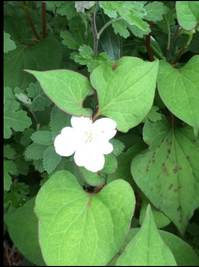
八重咲ドクダミ (葎草)