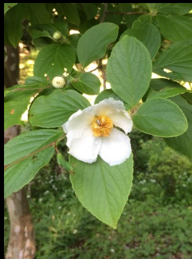
ヒメシャラ (姫沙羅)

時期が早いかと思っていたのですがアジサイも花ショウブもたくさん咲いていて感激でした。アジサイは雨が似合いますね。下見は雨だったのでアジサイは綺麗でした。(今回も殆ど下見の時に写しました。)