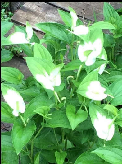
ハンゲショウ (半夏生)