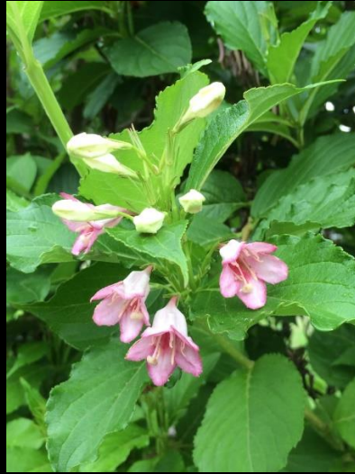
ハコネウツギ (箱根空木)