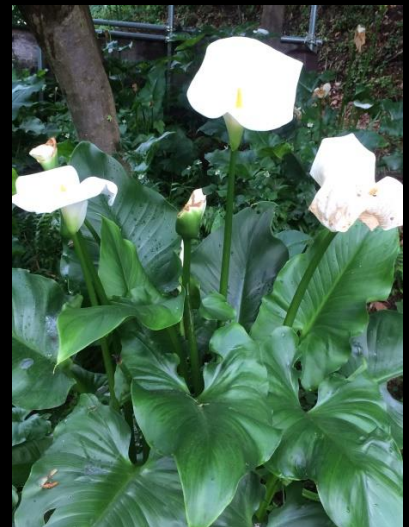
カラハナ (阿蘭陀海芋 オランダカイウ)