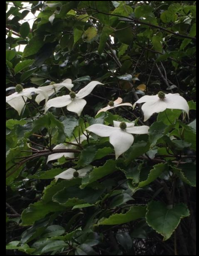
ヤマボウシ (山法師)