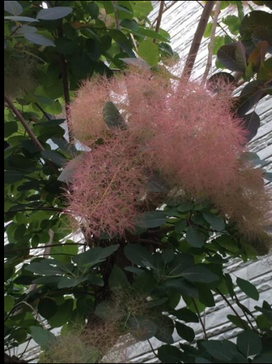
スモークツリー (煙の木)