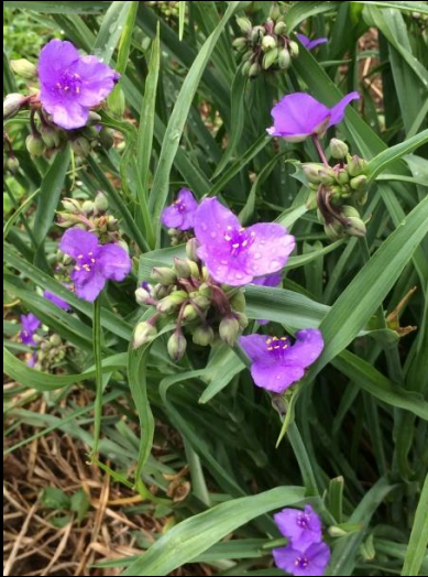
ムラサキツユクサ (紫露草)