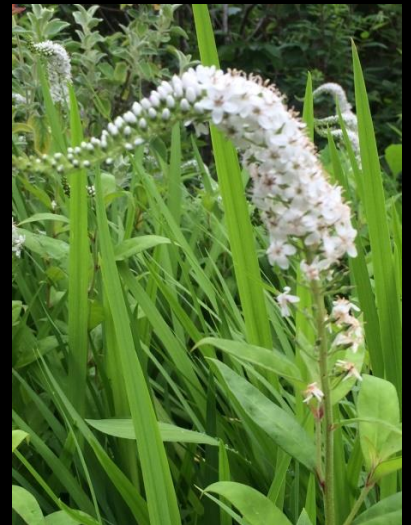
オカトラノオ (岡虎の尾)