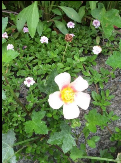
マルバストラム (枝垂れ芙蓉)