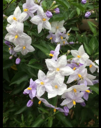
ツルハナナス (蔓花茄子)