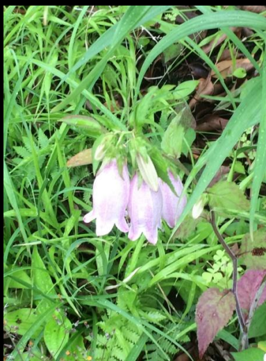
ホタルブクロ (蛍袋)