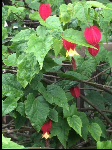
アブチロン (浮釣木 ウキツル木)