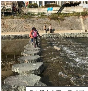
栃本親水公園の飛び石

この日帰り温泉は一年ほど前に宿泊施設もできたようです。KWCの皆さん、少し遠いですがたまには泊りがけで埼玉小川町伝統の和紙漉きを見学し、槻川遊歩道を散策し、そしておがわ温泉花和楽の湯をエンジョイされてはいかがでしょう。なお余談ですが、私のウォーキングも昨年末で延べ9600kmになりました。6月頃には1万キロの大台にのべく今年も頑張っています。