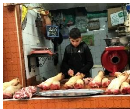
よく働く子供／イチゴ売り 食肉店