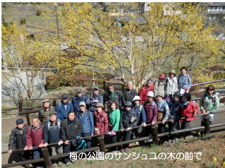
梅の公園のサンシュユの木の前で

梅郷へ。4年前に梅ウイルス感染で全木伐採し丸坊主になった園内はいま、梅の若木が育ち始めており、サンシュユやゲンカイツツジが見頃で十分楽しめます。前半は咲き始めた春の花々を愛でつつ、何か懐かしい家々の道を進みました。軍畑からは本来の川沿いハイキングコース。乗用車程の大きさの荒々しい岩がそこここに現れ、流れの音も心地よく、いよいよ溪谷らしくなってきました。終点御岳橋には海から72kmとありました。