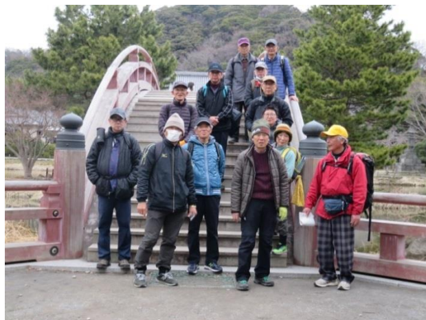
能見台・称名寺の太鼓橋