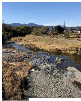
川床が岩盤の槻川