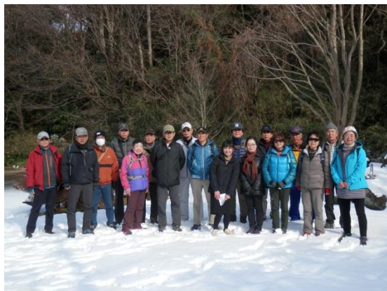
紅梅が咲いている(金剛寺)・片や雪の中(矢シ塚公園)・対照的な風景

フォトレポートより:小島 今季最大の寒気団が日本列島を覆う中、相鉄線和田町駅には“寒さ知らず”の19名が集結！朝夕は厳しい寒さも日中の陽射しは結構強く、風裏などではネコ並みに日向ぼっこが出来そうです。今日はゆったりコース、13時には全員集合、駅を出て和田町商店街を少し歩いた場所の空きスペースでストレッチとコース説明。そこから正福院の階段で足慣らし！本殿前の二本の大木越に見る下界は、先日の大雪の影響があちこちに見受けられ、住宅街の白いアクセントになっていましたが、路地にはかなりの残雪があり滑りやすく、終始足元要注意のウォークでした。