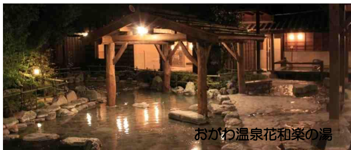
おがわ温泉花和楽の湯

この日帰り温泉は一年ほど前に宿泊施設もできたようです。KWCの皆さん、少し遠いですがたまには泊りがけで埼玉小川町伝統の和紙漉きを見学し、槻川遊歩道を散策し、そしておがわ温泉花和楽の湯をエンジョイされてはいかがでしょう。なお余談ですが、私のウォーキングも昨年末で延べ9600kmになりました。6月頃には1万キロの大台にのべく今年も頑張っています。