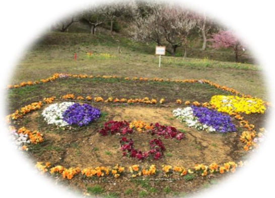
ラディアン花の丘公園