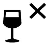
お酒のない食事風景 我慢がまん