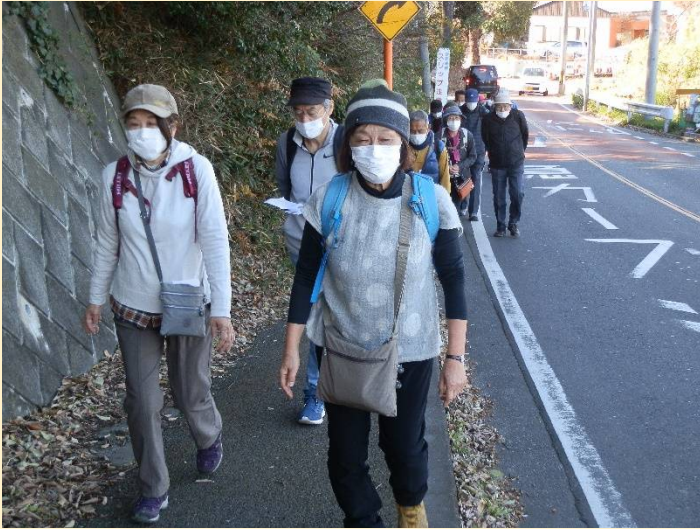
そろそろランチが気になってきたのか足取りが・・・