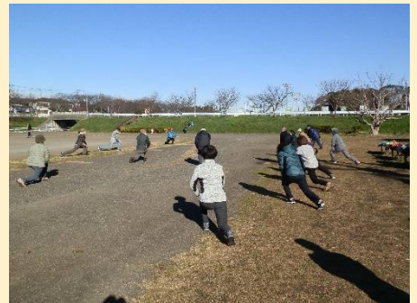
ここで熊坂Lのストレッチから。