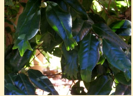
葉の先が割れた木。名前は？