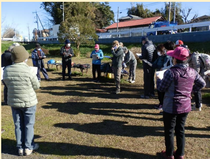
リーダーから本日のコース説明。どんな場所なのか・・・