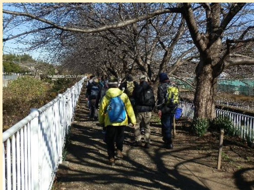
ここから和泉川の上流を目指す。