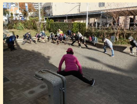
三ツ境第三公園。ここで解散となる。