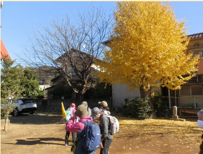
黄金色の銀杏が目を引く日枝神社。通過するだけ。