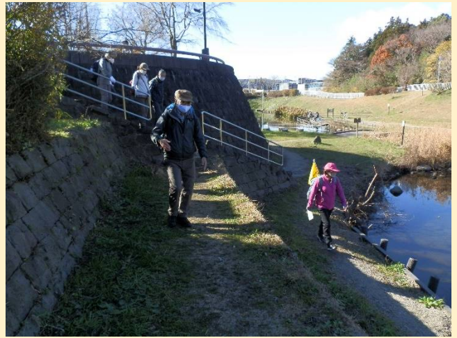
ここから河川敷に下りるが上&下・・・どちらを歩く？