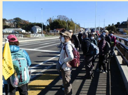
新道と新しい橋も架かり開けた場所。