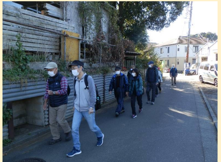
スイスイ歩いているものの後方は遅れ気味？