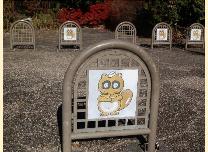
貉が歓迎してくれる瀬谷貉窪公園に到着。これ狸では？