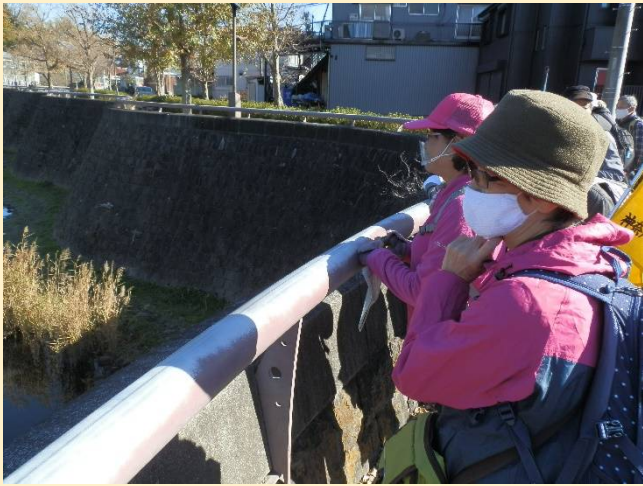
皆さんも暫しギャラリーと化して釣りを見学。