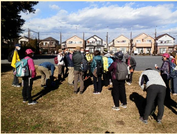
食後は点呼をとって午後の部出発。