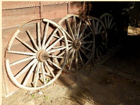
こんな車輪もさりげなく。