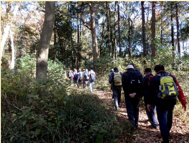
落葉を踏みしめ園内の雑木林の中に行く。