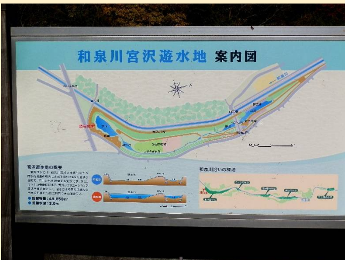
和泉川宮沢遊水地で小休止。