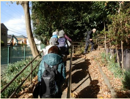
ここから急階段となる。