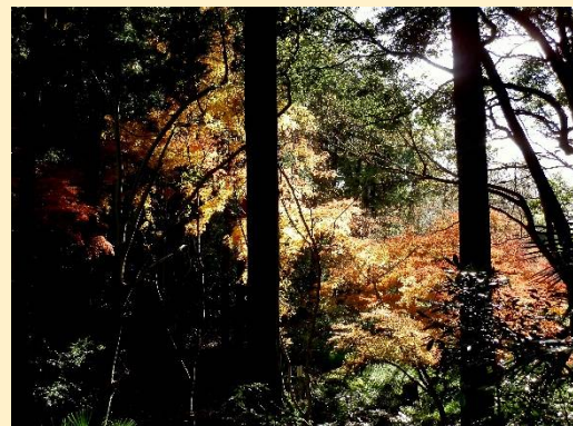
色合いが悪いが実際はもっと綺麗。