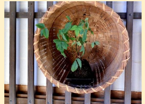
出入り口にあった洒落た盆栽？