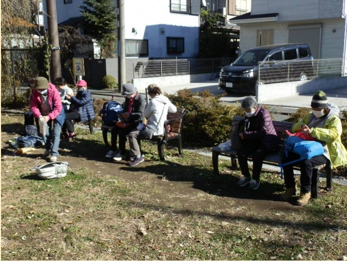
陽当たりのよい場所を選んでお待ちかねのランチとなった。