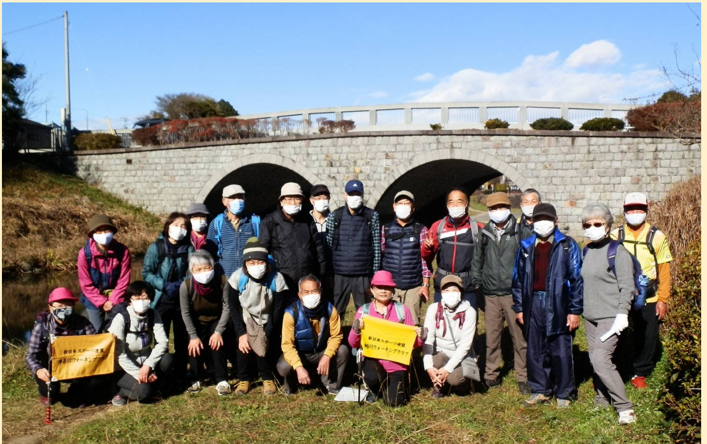
<和泉川に架かる“めがね橋”をバックに全員集合。めがね橋と言えば長崎が有名ですが百年後はここも？>