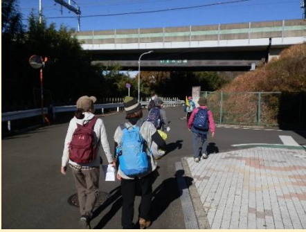
相鉄いずみ野線を潜る。