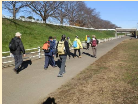
陽ざし溢れるスポーツ広場に到着。