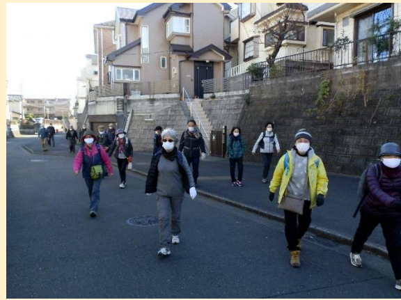
新興住宅地に行くKWC御一行。