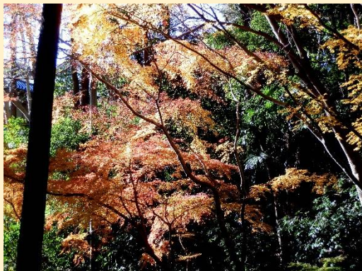
紅葉達に見送られ帰路に向かう。