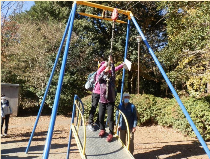
一角にターザンロープ。童心に帰りやってみる？