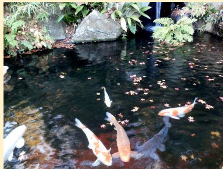
池の鯉に赤い紅葉が散る。