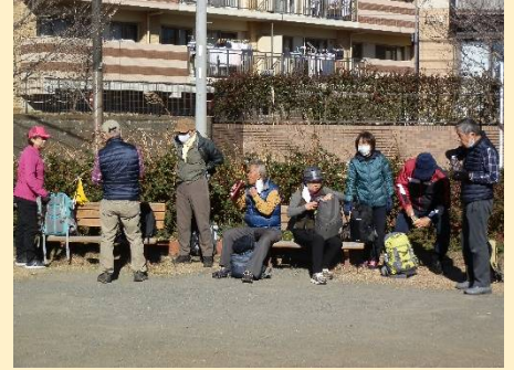
八幡山公園で一枚脱ぐ人も。