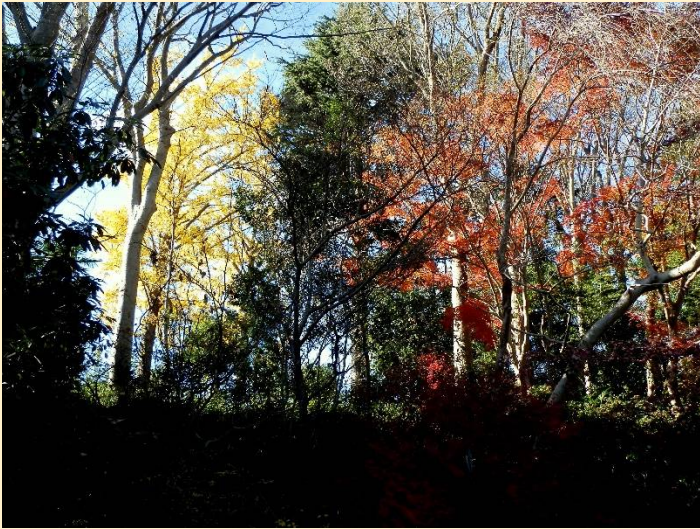
園内にはまだ紅葉が残っていたがこれが最後か・・・