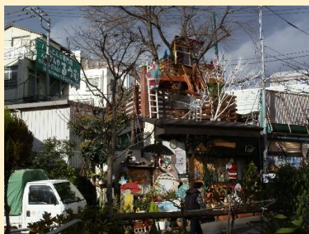
空模様が怪しいがまだ大丈夫。