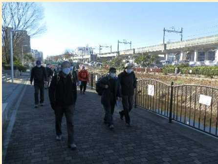
駅を出て相鉄線に沿って進む。