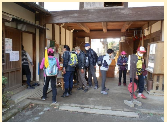
入口事務所前では産直品も売っていた。