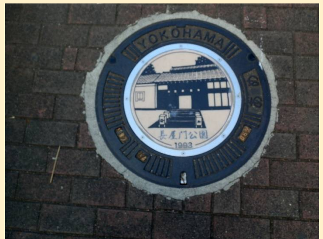
マンホールの蓋にも長屋門公園が描かれている。