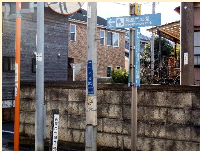
住宅街に出るとそこは長屋門ロードだった。