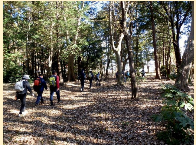
鬱蒼とした風景ではないが木洩れ日が眩しい。