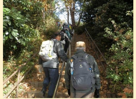
この先には何があるのか？