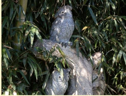
竹藪に像が数体・・・夜は怖そう！