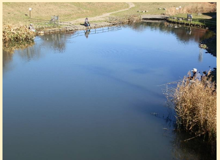
釣り堀の様な溜まりでは太公望が数人見受けられた。