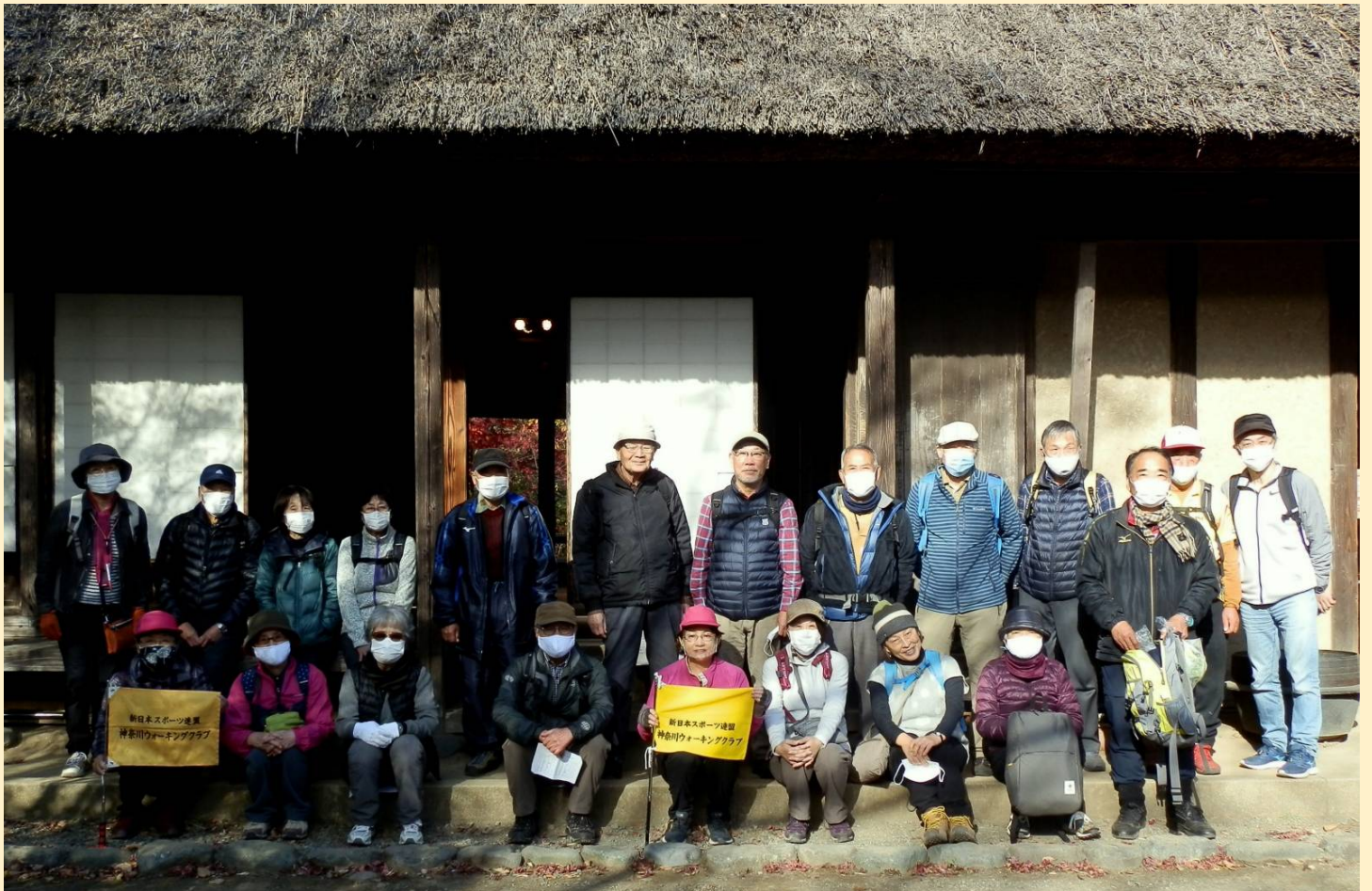
<長屋門公園の古民家で。KWCではこのような場所での集合写真が恒例ですね>