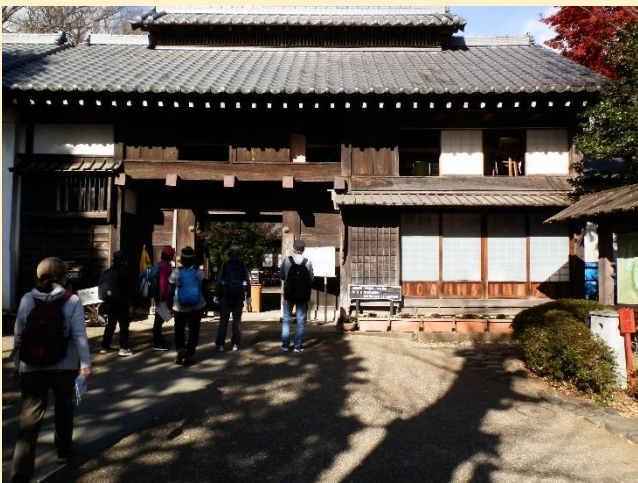
最後のポイントは長屋門公園。来たことがあるかも。