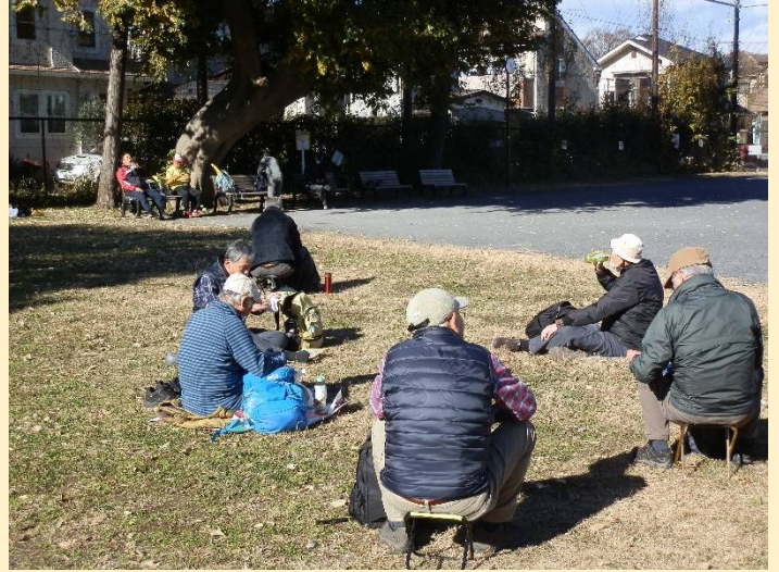
ここは男らしく車座で食べている男性陣。暖かい！