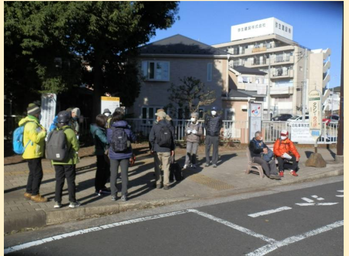
寒いので皆さんは陽の当たる場所へ移動。