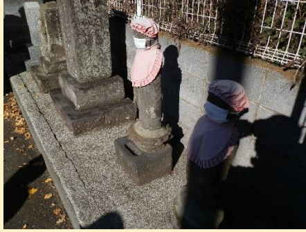
お地藏さんも今やマスク姿で。