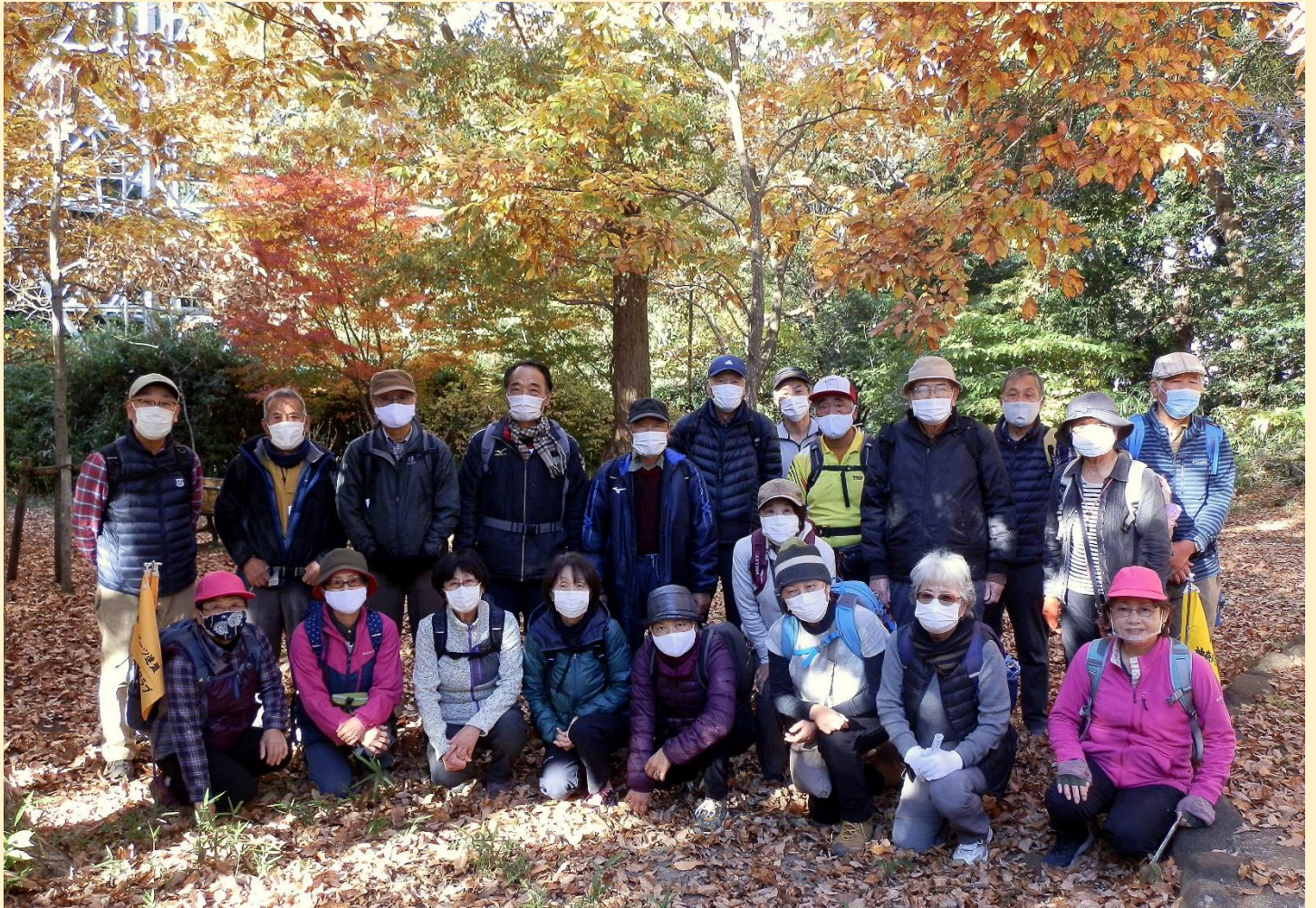
＜雑木林の中で紅葉をバックに全員集合。最後に今回のタイトルに相応しい場所で撮れました＞