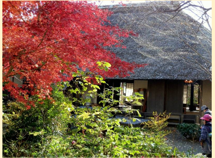
茅葺屋根には赤い紅葉が似合う。日本画のような彩。