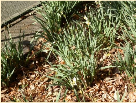
もう水仙が咲いていた。