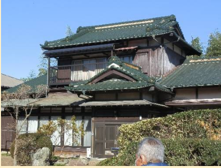
緑瓦が目立つ地元の豪邸？