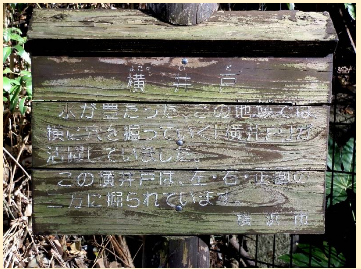
この地は水が豊富で横に掘る井戸が可能だった。