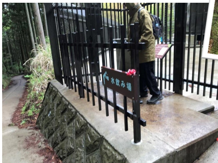
水飲み場があります 水源を大事にした取り組みをしています