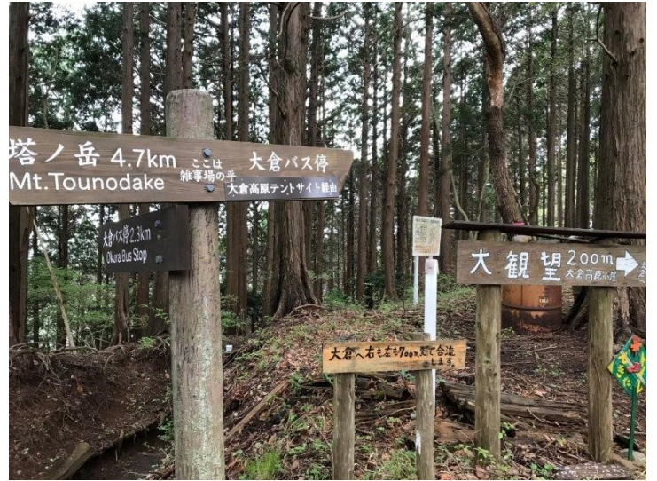
山小屋の管理人さんとお別れし大観望へ下ります