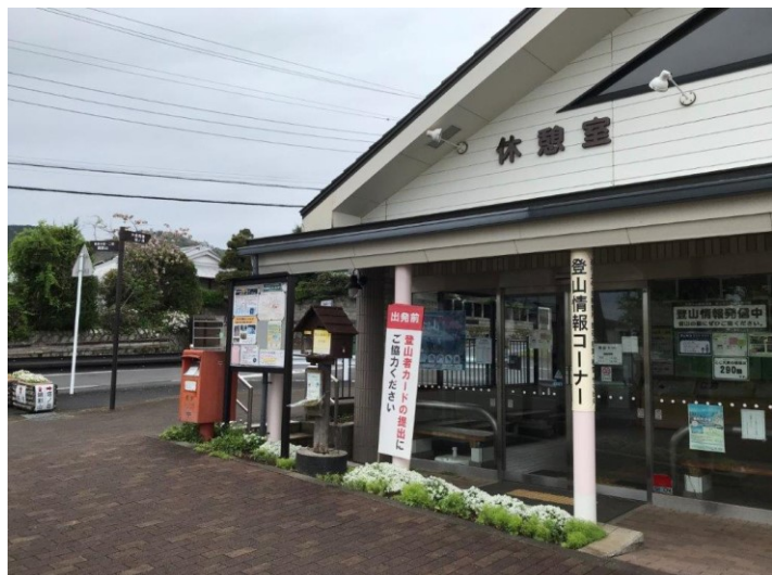
登山情報コーナー 登山カード提出はここで

★4月18日大倉尾根の見晴茶屋まで下見に行ってきました。 S.s(労山実行委員) k.h.n.y.t.k.e.y 5名 私自身、大倉尾根には初めて登りました。