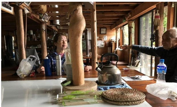
見晴小屋で昼食です