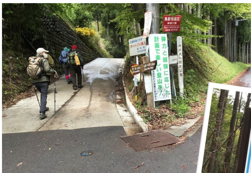
道が分かれ、いよいよ登山道へ