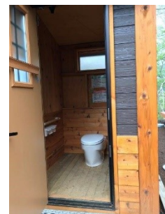
トイレは出来立てのところ含めてたくさんあり、心配ありません。