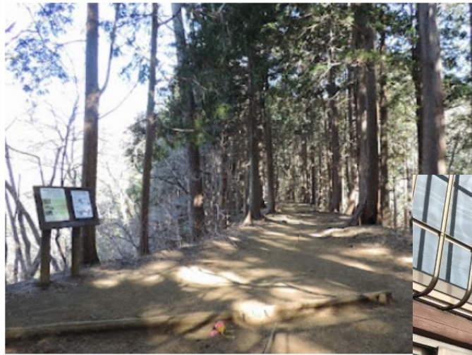
▶雑事場ノ平から見晴茶屋方面。

雑事場ノ平は、名前のとおり平で広く ゆっくり休憩ができます。まもなく見晴 茶屋です。