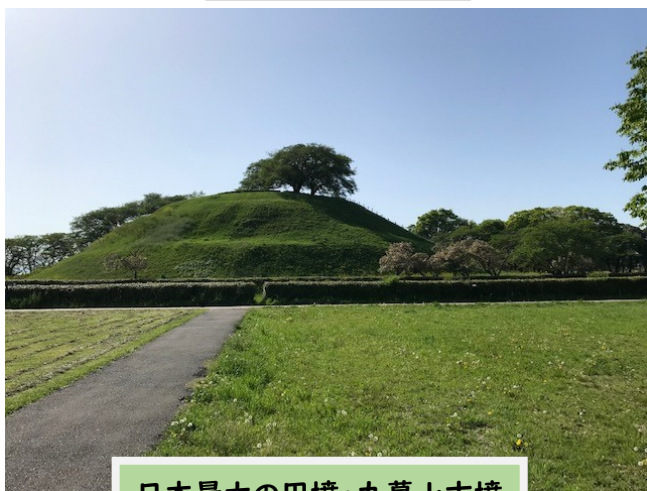
日本最大の円墳・丸墓山古墳