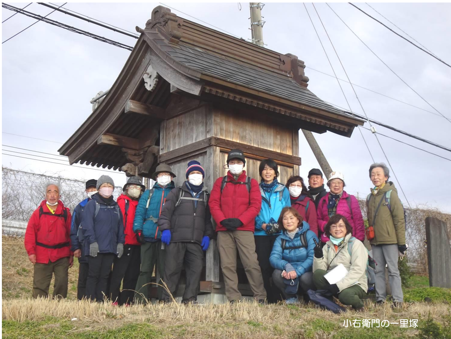
小右衛門の一里塚

さいたま市のこの日の最低気温は2.4℃、最高気温は10.4℃、北風を受けてのウォーキングとなりましたので体感温度はかなり低かったと思います。