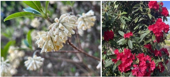
ミツマタや深紅のシャクナゲがきれい

横須賀水道みちを歩いたので記念に相模の山岳信仰の歴史を歩く八菅山を最後としました。だけど杜は深く静寂に包まれていました。