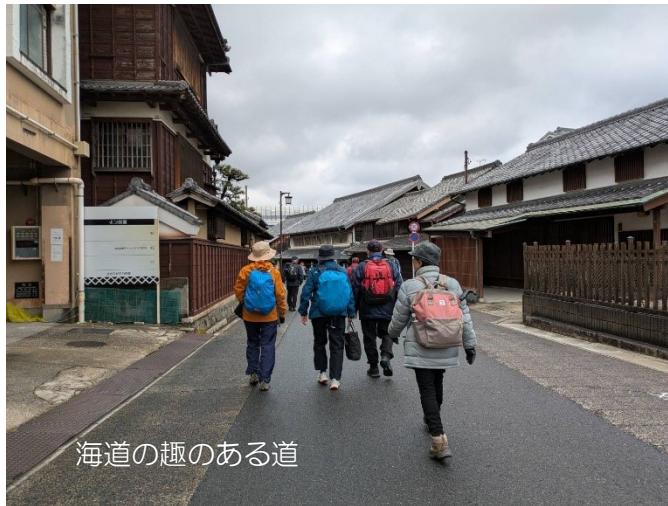
海道の趣のある道