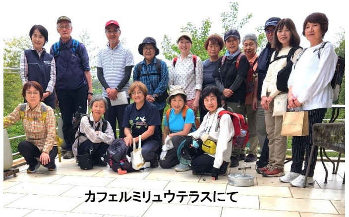
カフェルミリュウテラスにて

リーダー記 ：プチハイキングとアフタヌーンティーをテーマにしたウォーキングは、女性を中心に会員の皆さんには喜ばれたようで、募集開始の当日夕方には定員締め切りとなり、追加募集で2回目も実施してあわせて36名が参加しました。近ごろ「ヌン活」と称してホテルやカフェを次々に訪ねてアフタヌーンティーを楽しむ活動がはやっているそうです(笑)。一回目は思いがけず MOKICHI 鎌倉がクローズとか、二回目は前日の長雨で大仏坂切通は中止とか、予定通りにいかないこともありましたが、参加者の皆さんが心から楽しんでいただいていたのが何よりよかったです。<脇坂>