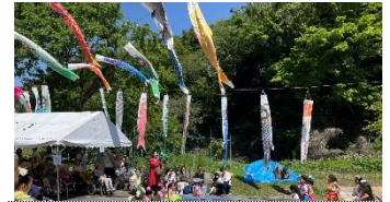
石切場近くの広場で

この周辺の山からは明治の末頃から大正時代にかけて、池子石と呼ばれ る凝灰石が切り出されていました。現在残されている石切場跡は、ほぼ立方体に近い形状の空間になっ ており、周りは全てノミで掘った痕跡が残されていました。手掘りでこれだけキレイな形状に掘れるものかと感 心しました。その後、池子の森自然公園へと移動し、園内の施設見学の後、広大な緑地エリアで、清々し い5月の風を受けながら昼食をとりました。久木神社や岩殿寺など神社仏閣を巡り最終地の亀岡八幡宮 に到着しました。