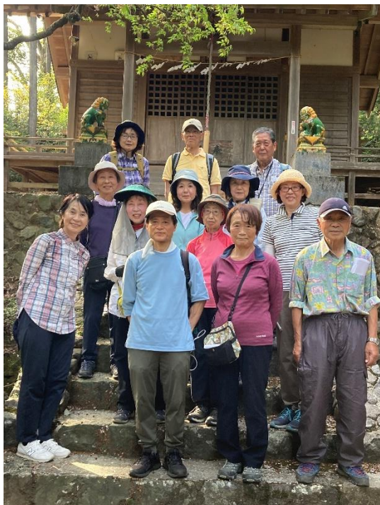
将門神社の珍しい焼き物の狛犬の前で