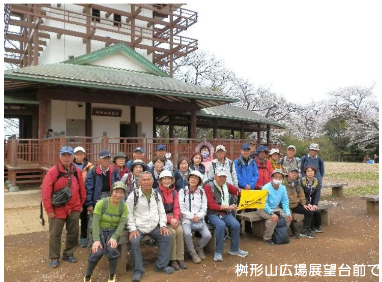
柘形山広場展望台前で

その後は、今にも降りだしそうな天候を気にしながら、川崎市の特別緑地保全地区に指定されている竹林の中を、本当に気持ち良く歩きました。今回のコースは、所々坂道や階段もあり、思ったより少きついと感じた方もいたのではないかと思います。全員無事にゴール地点へ到着しました。