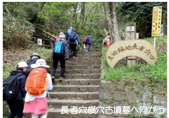
長者穴横穴古墳墓へ向かう

午後は、小雨が降りだしましたが、傘をさすこともなく歩ける程度で、予定通り生田配水池などを経て、ゴール地点である読売ランド前駅に到着することができました。 <畠L>