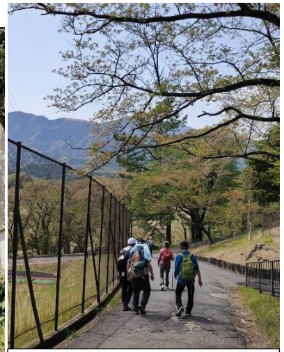
中津川カントリークラブを抜けて