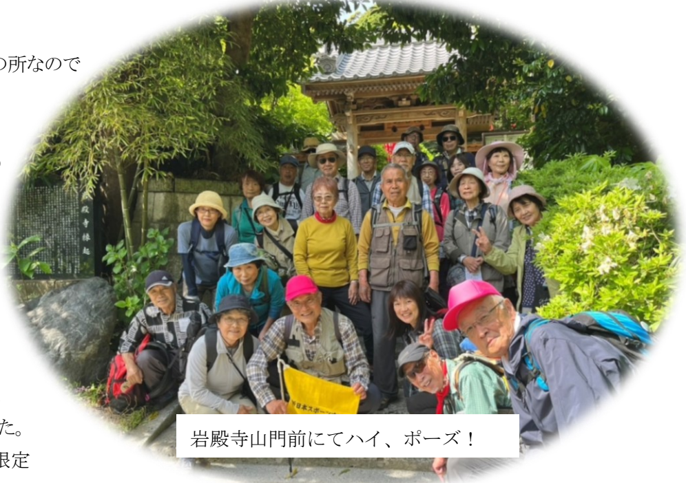
岩殿寺山門前にてハイ、ポーズ！

池子の森は入園日が限定 されている為か自然が豊かに残り気持ち の良い空間が広がっていた。