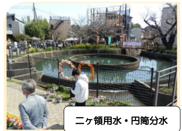
二ヶ領用水・円筒分水