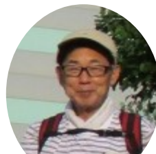
在りし日の青松さんと霊園