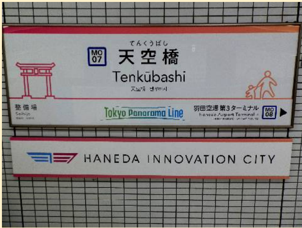
ホームのプレートには可愛いイラストも。