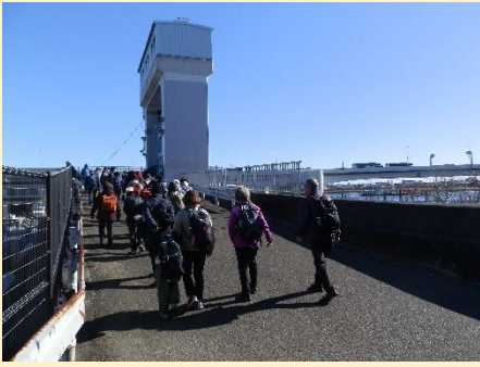
再び多摩川土手上を歩きます。