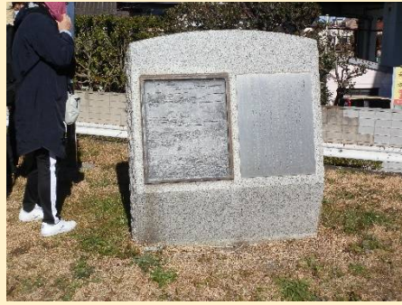
かつてあった多摩川の渡しの碑。