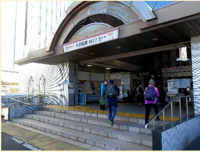
天空橋を渡りモノレール天空橋駅へ。