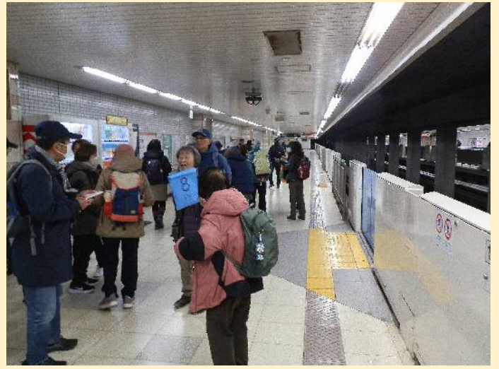
モノレールなのに何故かホームは地下に。