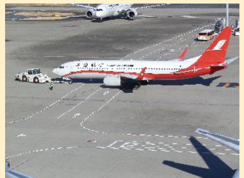
第3ターミナルの展望デッキ。風が強くて飛ばされそう。駐機スポットには中華系航空会社の機種が目立つ。