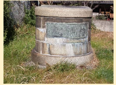
旧大師橋の橋脚が残されている。