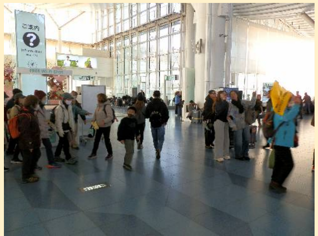
第3ターミナルは国際線専用。その為かターミナル内はあちこちに外国人向けの工夫が。ゴジラまでいた！