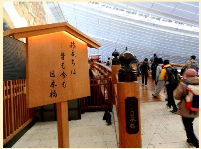
お江戸日本橋も木造で復元されている。