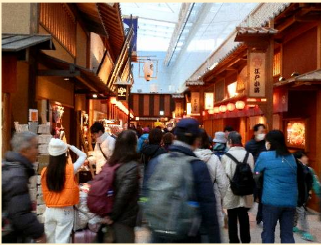
江戸情緒溢れるグルメ街。有名店も軒を並べる。