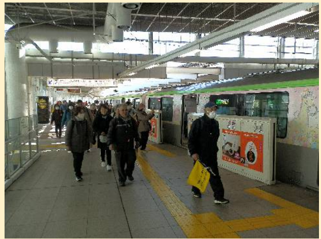
一駅で羽田第3ターミナル駅。ここは地上駅です。