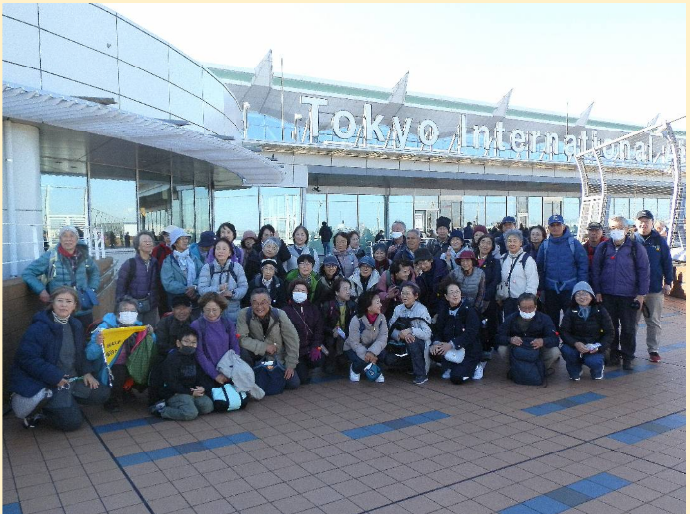
強風の中、デッキ上に並んでもらい全員集合。風のせいかな皆さんの顔はどこを向いてるのかでバラバラ。