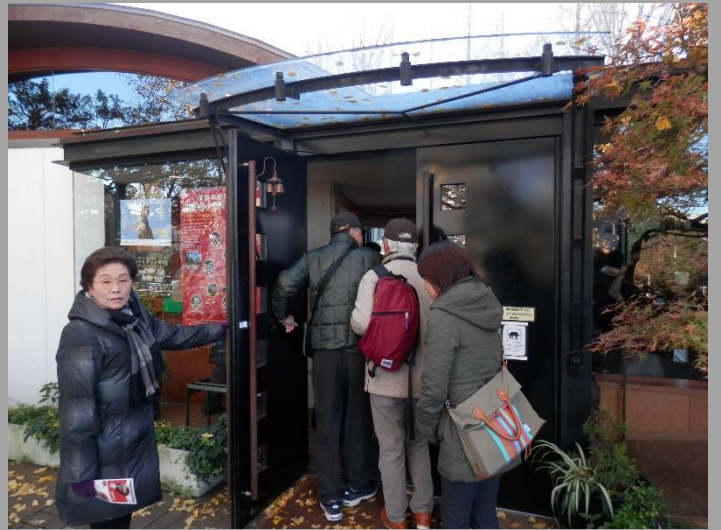
まずはプラフ18番館に入ります。