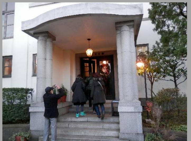
次のイギリス館には、もう灯が点っています。