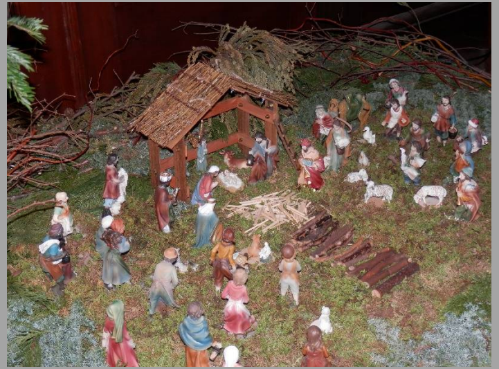
これはキリスト誕生の様子を表しています。