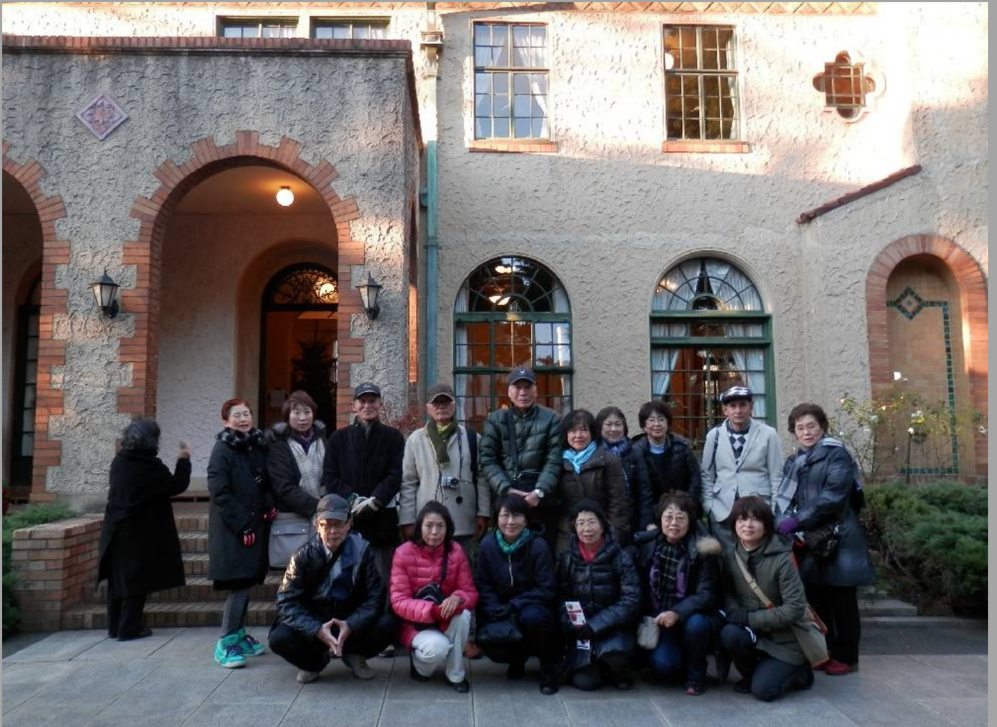
ベーリック・ホール前で。寒さで表情も固まっているようです。(なお、左端の人物は当クラブとは一切関係ありません！)

※横浜山手西洋館の立ち並ぶこの山手本通り沿いは、かつては「横浜最高級通り」という道路標識が立っていた記憶があります。若い頃ではありましたが、この名称には些か不愉快な思いを抱いたものです。今ならば何かと問題のある表示かも知れませんが、今日は恐れ多くもそんな“高級”な場所を歩かせて頂いたわけです。