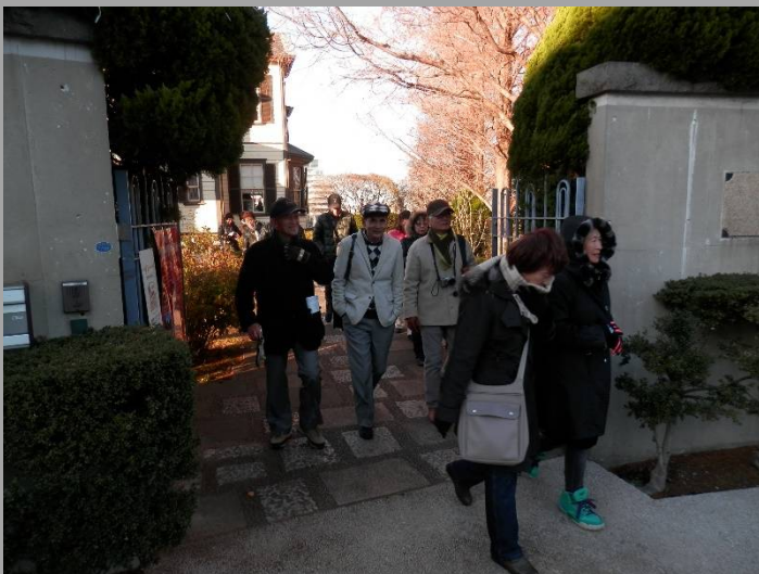
イタリア山を後に山手本通りへ出ます。