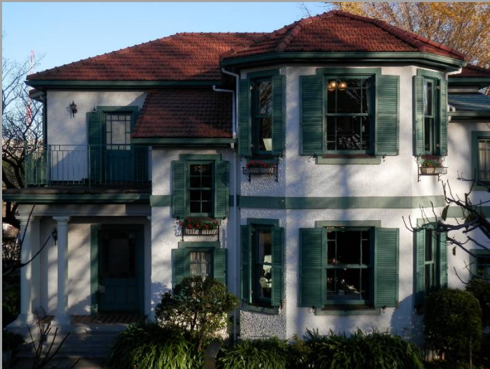
赤い瓦と白と緑の外壁が如何にも外国人住宅です。