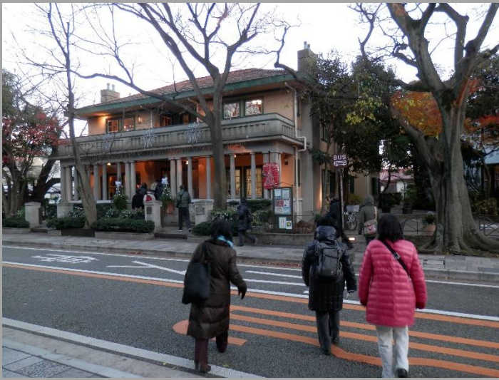
山手234番館に向かいます。