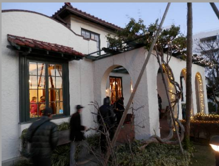
最後の山手111番館。暗いので人物がブレました。