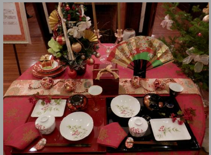
玄関ホールには、和風のオ・モ・テ・ナ・シが...