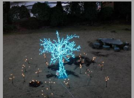
庭園のイルミネーションツリー。色が変わっていきます。