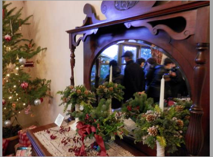
この鏡がいい雰囲気を出しています。