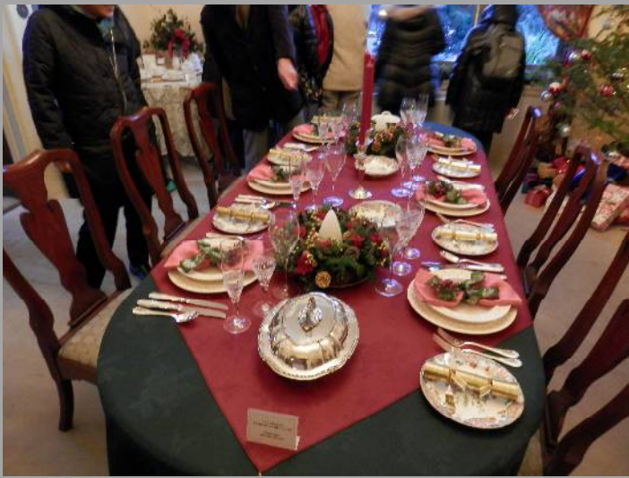
美味しそうな料理が並んでいるようで...