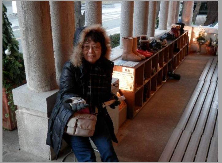
こちらはオーナーの方？それとも...