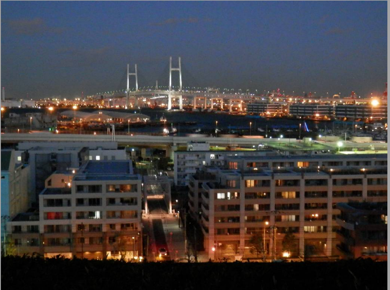
港が見える丘公園から。ベイブリッジのライトアップが綺麗です。カップルの聖地ですが、寒さで誰もいなかった！