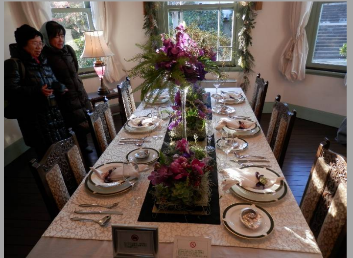
待っていても料理は出て来ませんよ！