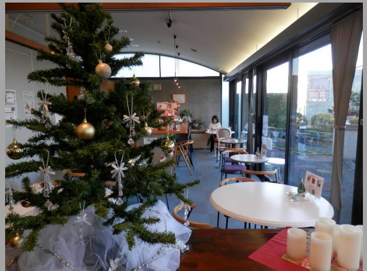
一階の一部はティールームになっています。