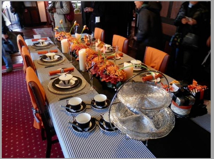
隣の外交官の家。食器も洒落ています。