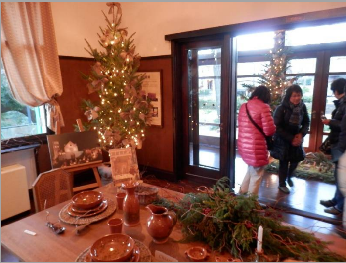
エリスマン邸。テーブルの上にもモミの木が。