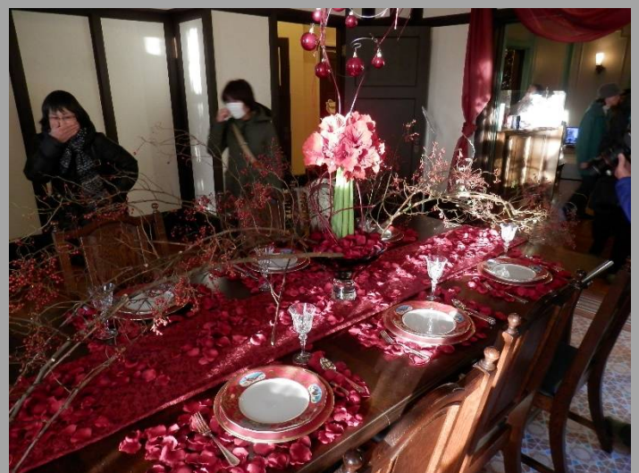
ベーリック・ホール。散らかって見えますがいいんです！