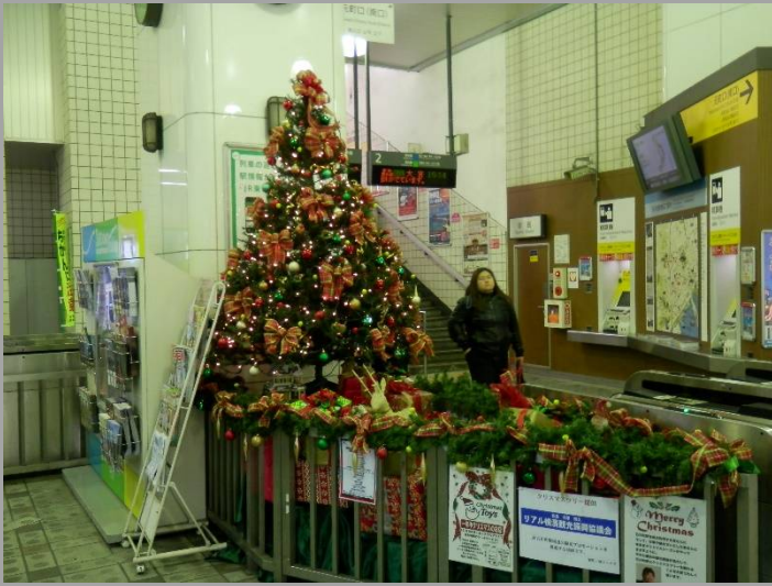
石川町駅元町口改札前にはクリスマスツリーが。