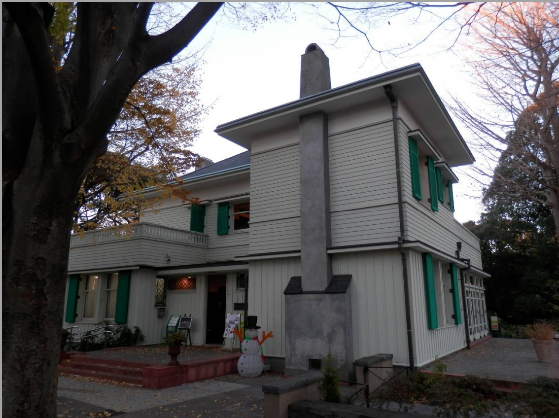
エリスマン邸の外観。ここも緑と白を使っていますが、外国人はこの色が好き？