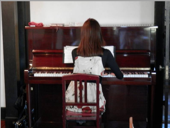
ピアノの音色が・・・(弾いている後姿がいいですね！)