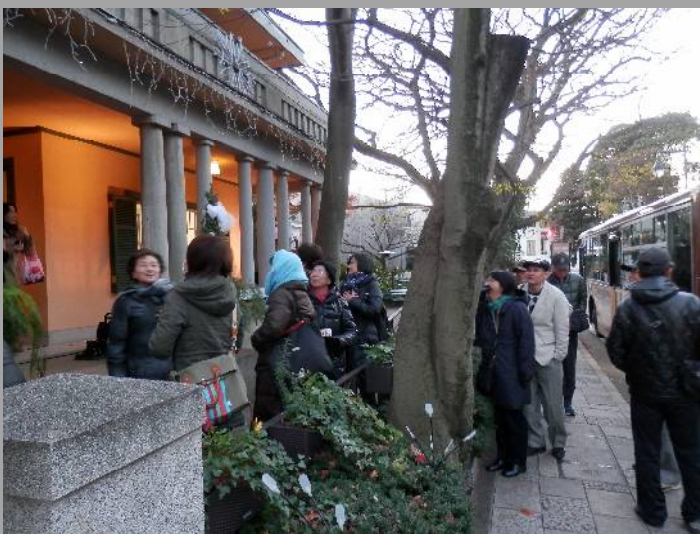
時間が押しているので早めに撤収！