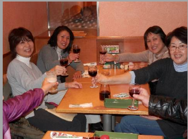
※終日風冷えの一日でしたが、アフターは元町中華街のサイゼリアで・・・席についてやっと人心地つきました！ なお、今回のコースは皆さんよくご存じの場所なので、各館の説明は省き写真だけを並べてみました。