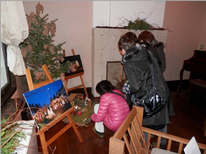
興味を惹かれるものが色々あるようです。