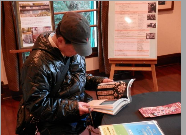
熱心に本に目を通している勉強家は・・・どなた？