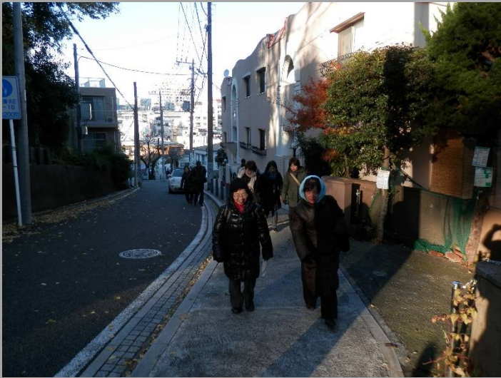
大丸谷坂は陽も傾いて...