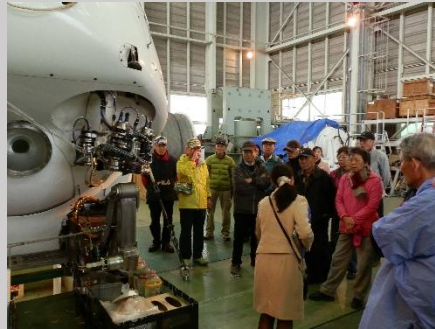
ここには本物の「しんかい 6500」がありました。偶然とは言えラッキー！