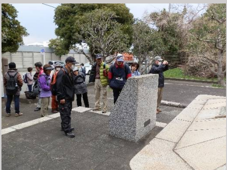
貝山緑地を後に。何やら碑が・・・伊藤博文が憲法を起草した場所でした。