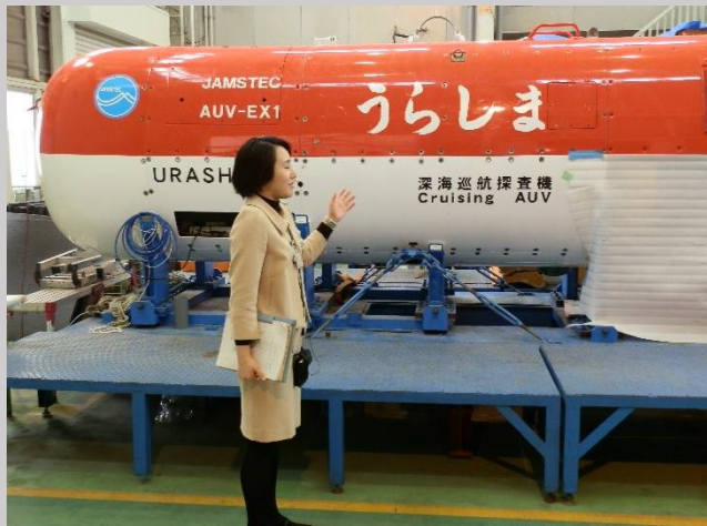
こちらは無人の深海探査機「うらしま」。