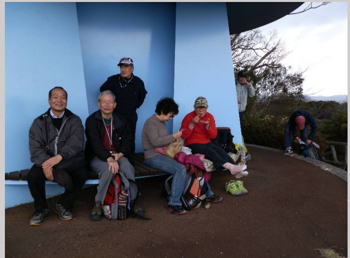
食べ終わった人・・・まだ食べている人！

※貝山緑地=明治45年(1912年)、この地に海軍航空技術研究委員会が組織され、日本海軍初の航空飛行が行われた。昭和5年(1930年)横須賀海軍航空隊海軍飛行予科練習生(通称予科練)が設立され、全国から選ばれた若者達が優秀なパイロットとして巣立っていった。この周辺は、横須賀航空隊・海軍航空技術廠・追浜飛行場と海軍航空の一大拠点だった場所で、日本の「海軍航空発祥の地」といえる。季節には桜や杏の花を楽しむことができる。(市資料より)