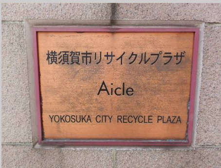
リサイクルプラザ・アイクル。