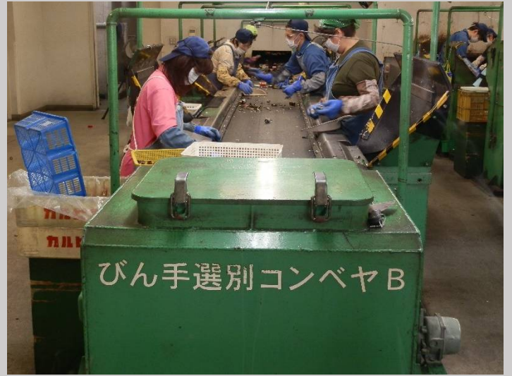
最後は人海戦術です。すべて自動ではなかった！