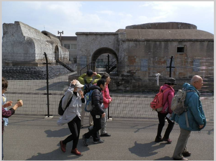
第三海保の遺構でした。それにしてもどうやって運んだのか・・・