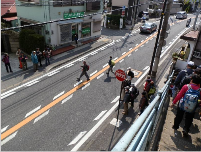
坂道を下って車道を横断。左右を良く見て！