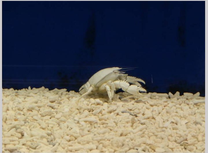
深海の熱水鉱床に住むユノハナガニ。生きています。