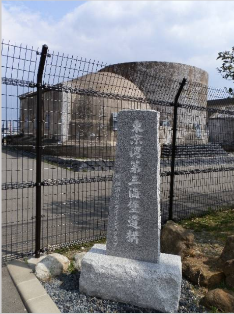
アイクルの5階から見たのはこれ。