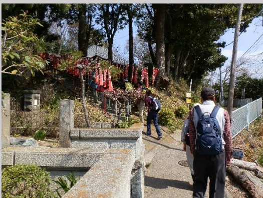
観音寺・水子不動尊に着きます。