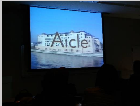
しっかりとアイクルをPRしています。