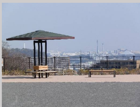
遥かにシーパラダイスも見えて。