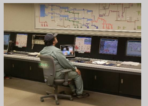
施設内は自動制御されて...