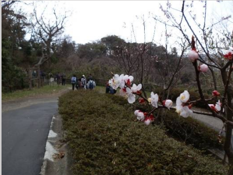
杏の花。桜と見間違いませす。