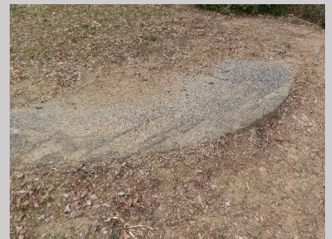
これは砲台の台座跡と思われます。