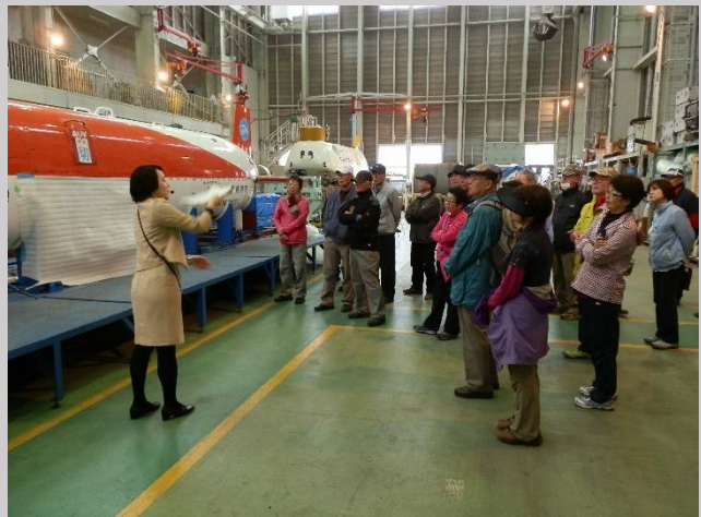
皆さん説明を真剣に聞いています。