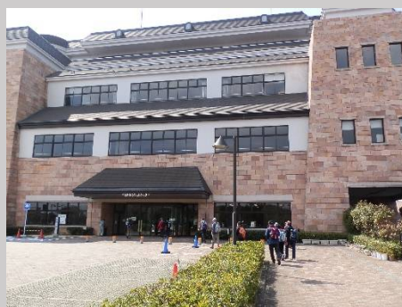
まるでホテルのような外観です。