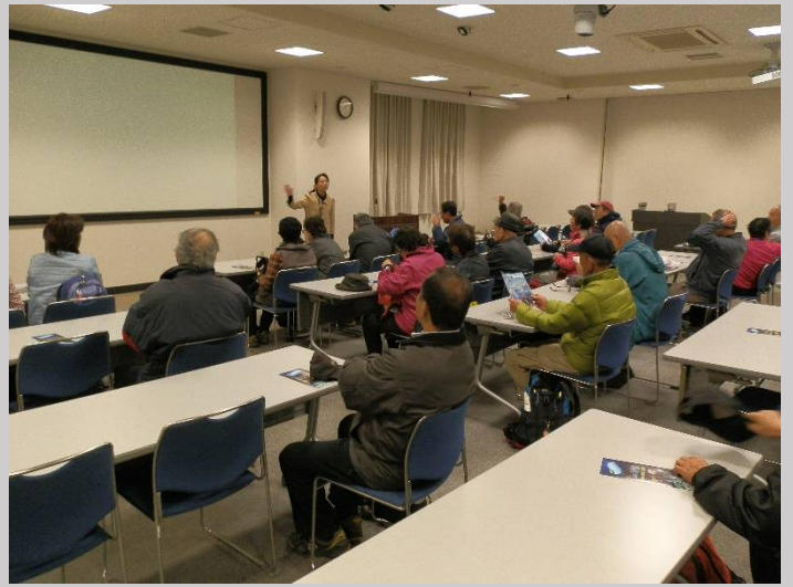
ここでもまずはビデオで概容の説明を受けました。