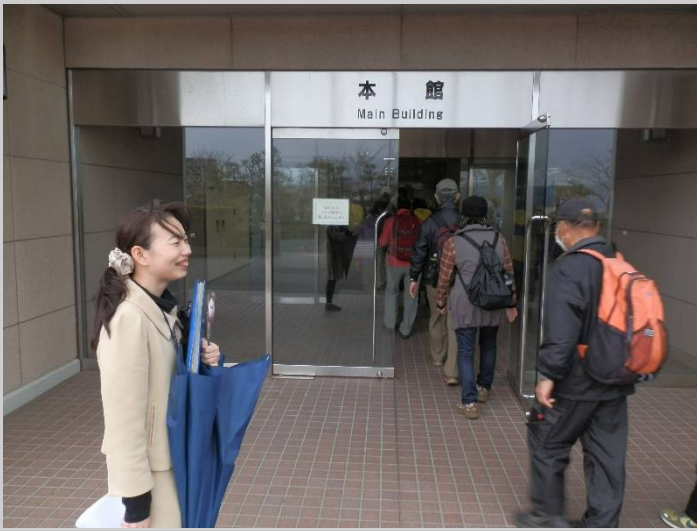
海洋開発研究機構(JAMSTEC)の海洋科学技術館です。