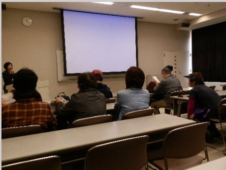
2階ではビデオで施設の説明。