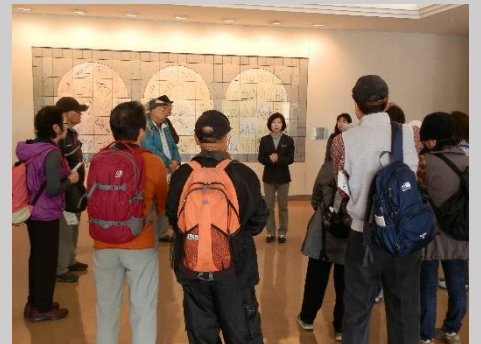
係りの方から説明があります。