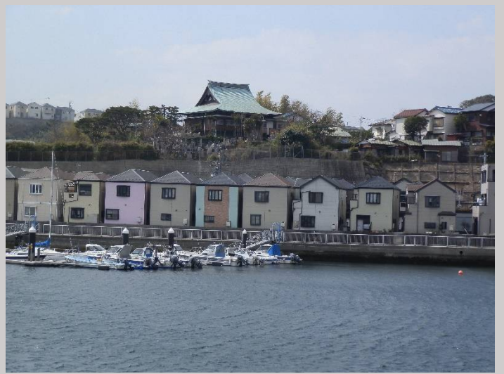
岸壁に沿った建売住宅でしょうか。津波は大丈夫？