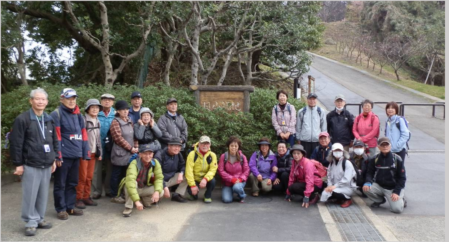
強風の貝山緑地で昼食後、入り口前で集合写真。(アングルの関係で、左のお二人が“大物”に見えます)