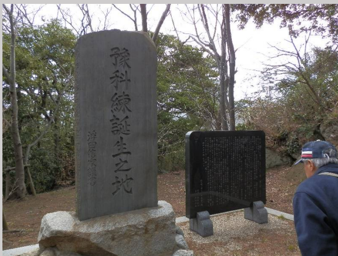
貝山緑地。予科練誕生の地です。