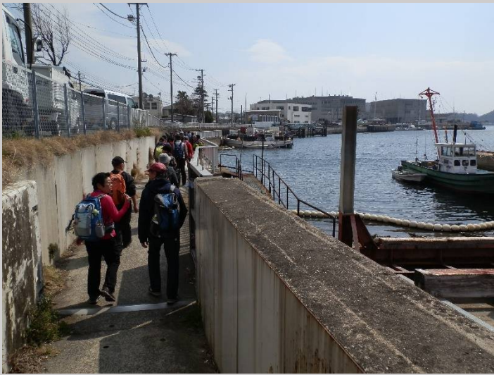
海に出ました。横須賀港の奥になります。