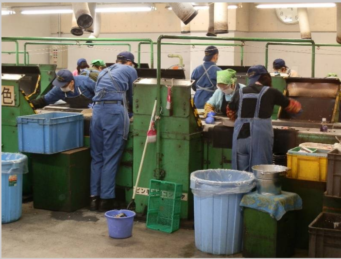
と思ったら・・・何やら忙しそうに作業中。