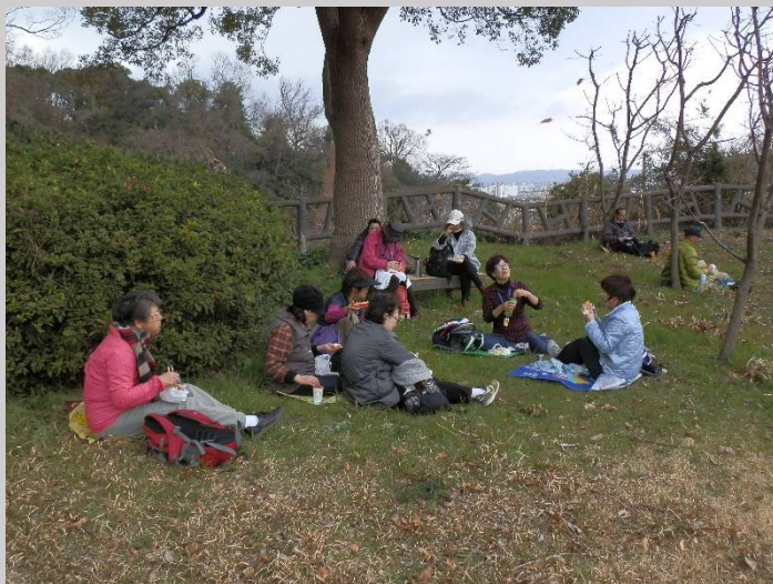
大きな木の下で・・・お待ちかねの昼食タイムです。