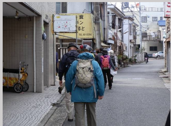
16号から一步入ると古い商店街です。