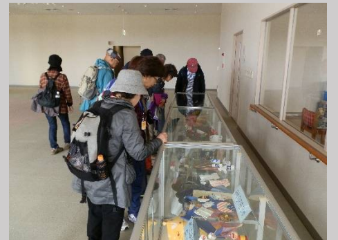
再生資源で作った様々なものを展示。