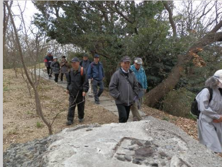
この付近は砲台陣地があった所。