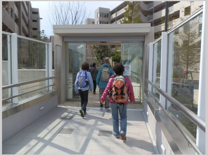
住民専用(?)のエレベーターに乗り丘の上の団地内に。