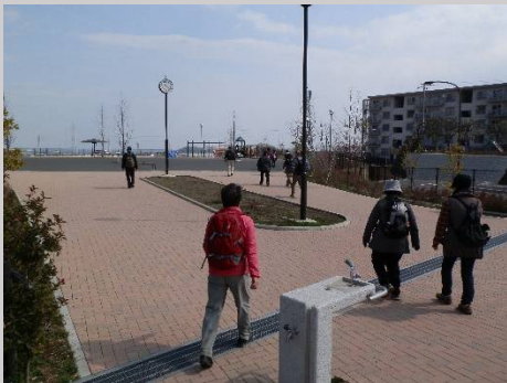
気持ちのいい風が吹いてきます。