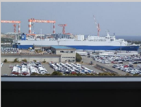
5階から見た日産の車運搬船。