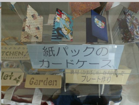
女性陣に興味がありそうなものにも生まれ変わります。