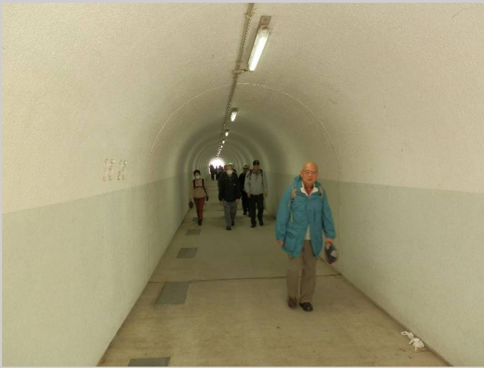
こんなトンネルを潜って…