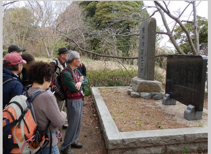
太平洋戦争では、多くの若者達が戦地に赴きました。