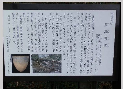
近くには夏島貝塚もあります。