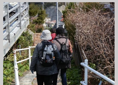
上ったら下るのが KWC のコース！