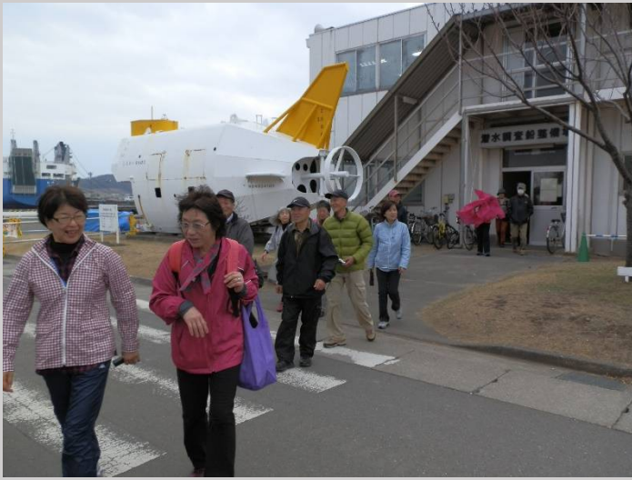
これで見学コースは終了。お疲れ様でした。