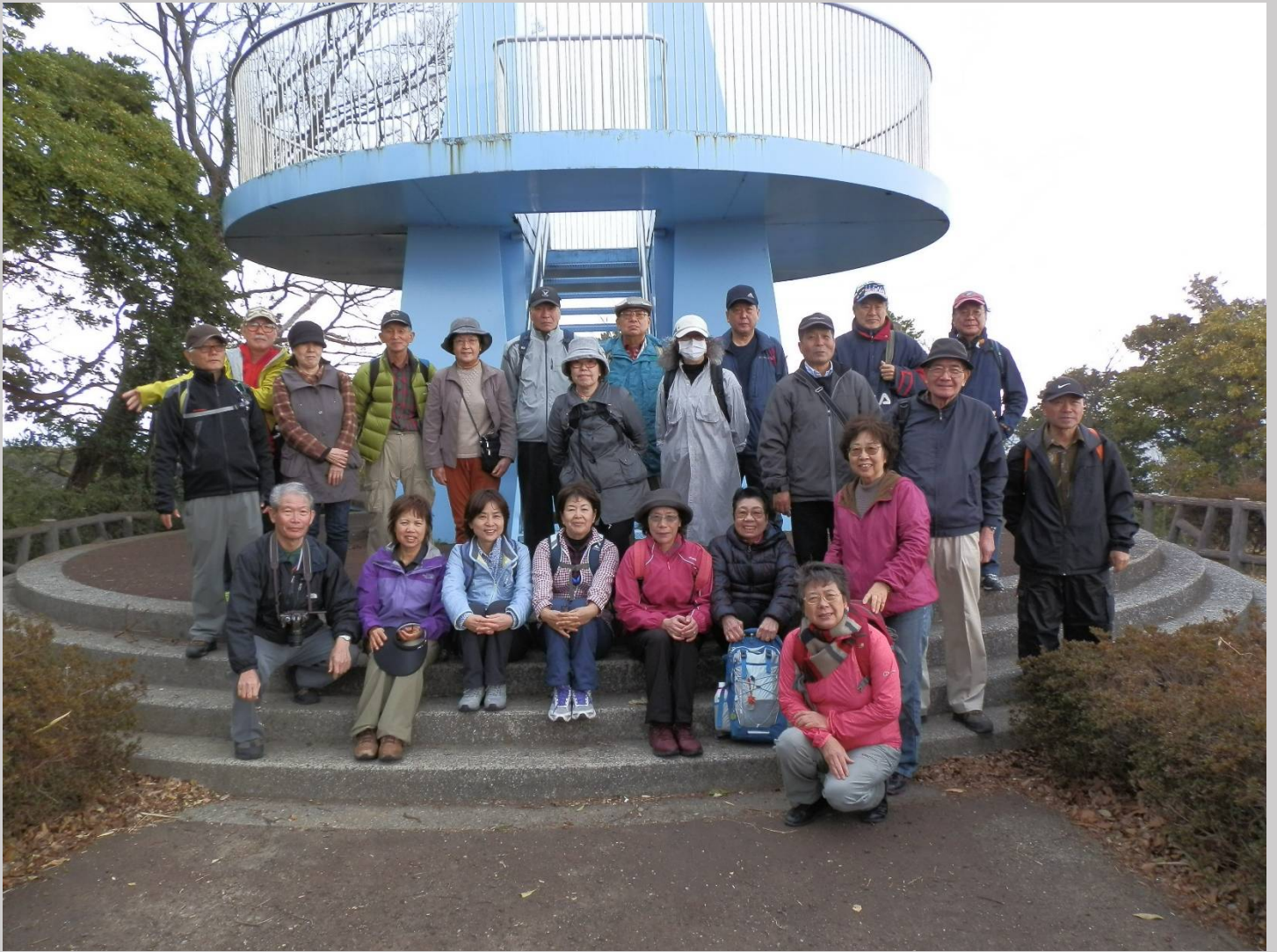
展望台下で記念写真。食後のせいか皆さん顔も穏やかです！（やはり食事は大事ですね）