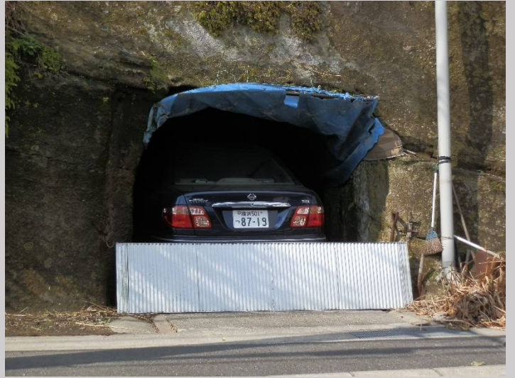
防空壕跡の有効利用。それにしてもここは有料or無料？