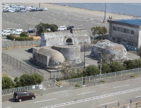
これは何？ 後で判明しました。