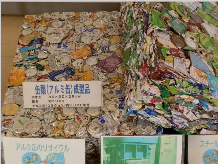
いつも飲んでいる缶がプレスされてこんなブロックに。