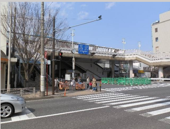
追浜駅前。この頃は青空が広がっていました。