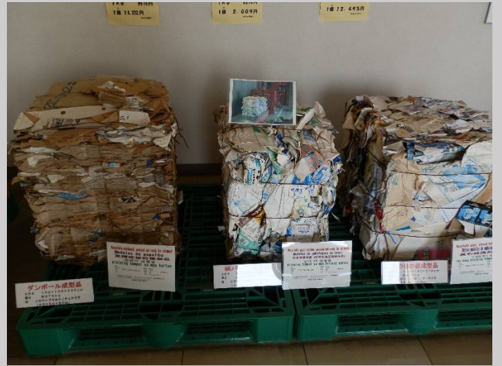
紙器類もプレスされます。