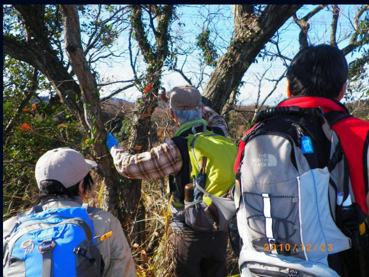
コースは尾根道にもかかわらず遠望できる箇所は少ない 遠望できるところは立ち止ってのしばしの休憩です