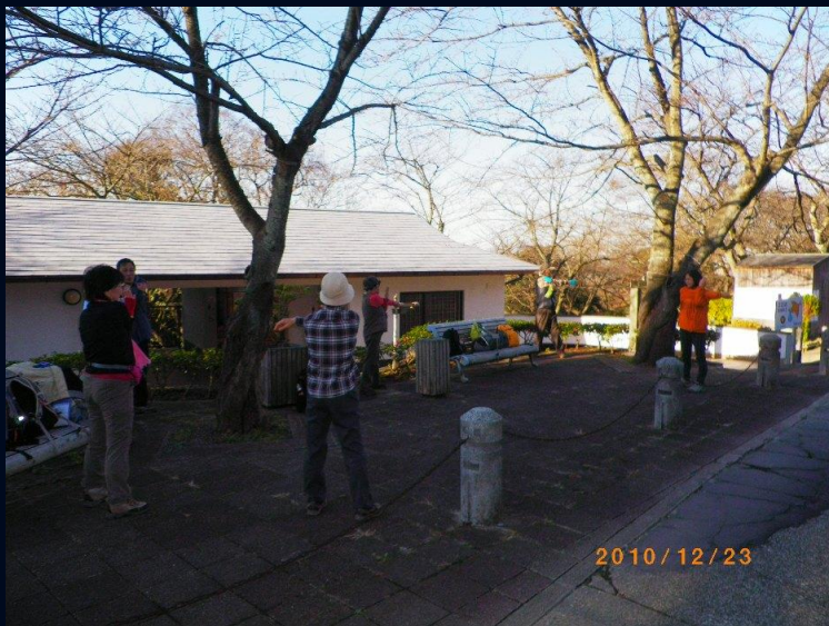
最後の山となった塚山公園で、クールダウンし、 22000歩 15キロ と決まりました。