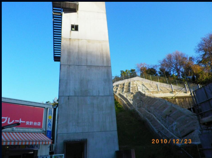
安針塚駅は高台から一気にエレベータで降りることができ 大変助かります。初めてのの方が感心しておりましたので