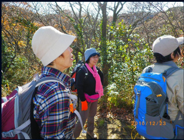
馬頭観音を過ぎると登り下りの連続、ピークは数えきれな なかったが十数個はあったのでは。ようやく健脚コースらし くなり、皆さんに納得してもらえたかな