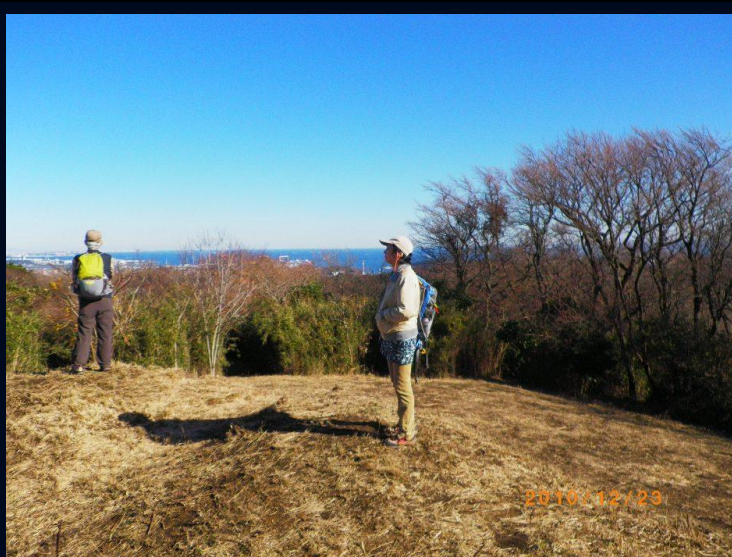
暑くも寒くもなく視界良好ゆっくりしました ここは本日の最高峰です あまりのあっけなさに 一般コースではという意見もでした