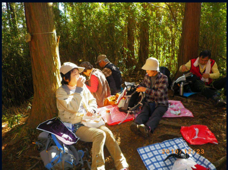
昼食は二子山という予定でしたが、健脚ぞろい、まだ 11時で早いという。約1時間、先を目指し、馬頭観音の 前でようやく昼食。車座になっての昼食でした