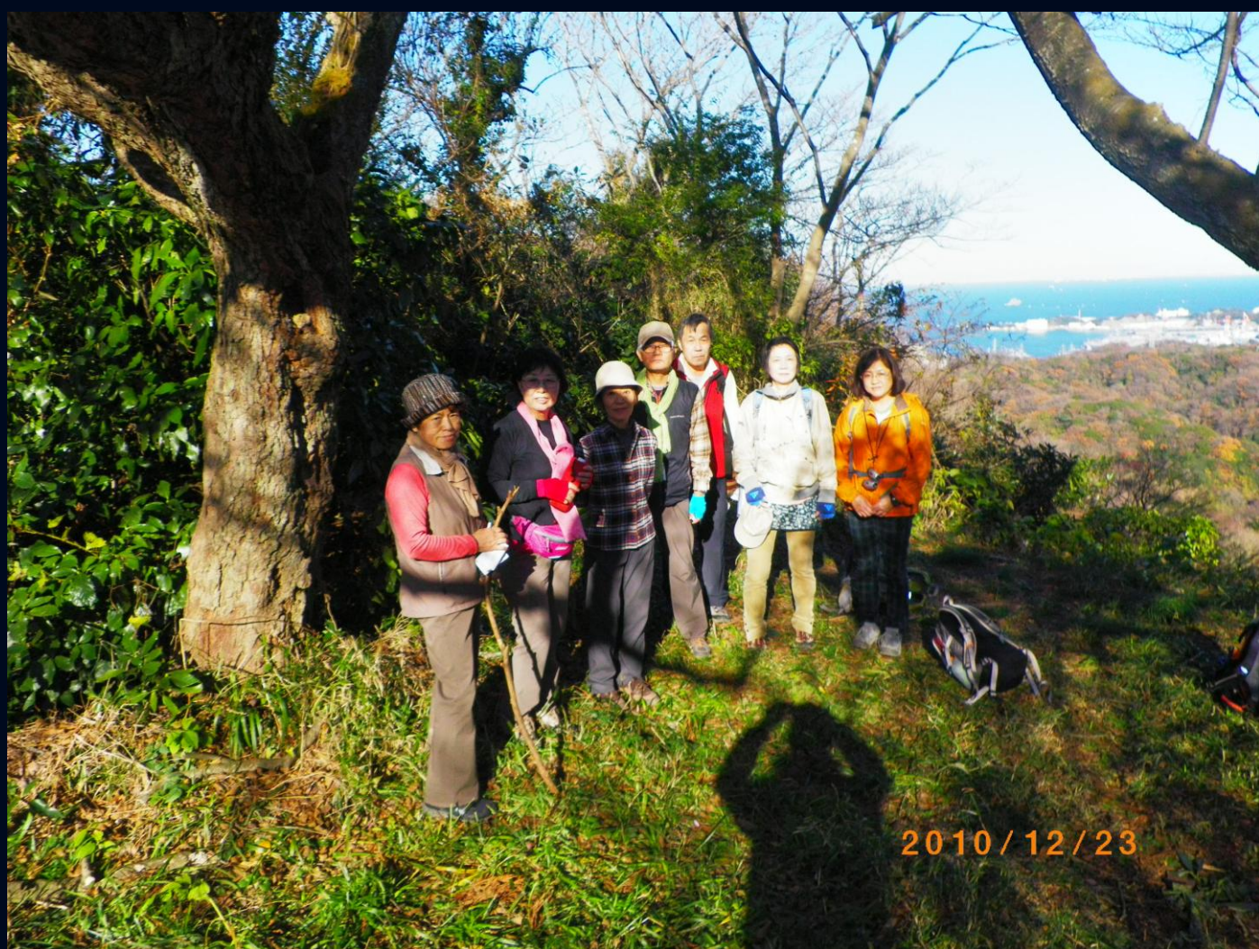
目指す富山によやく辿りつきました。ここで記念写真です 撮影者も影で参加しています 富山城址跡は眺望もよく、ちょっと寄り道でしたがここは来て良かったという意見続出でした