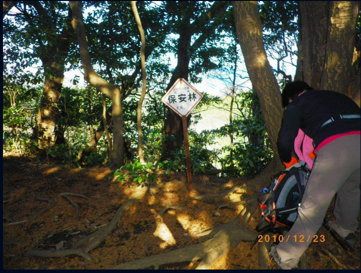
地図には明瞭に書かれているのに乳頭山の山頂は保安林の 看板のところに落書きのように乳頭山と書かれているを見 てようやくここが乳頭山と知る。下見の時は見落としてい た