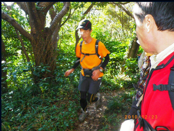
そんな山道をランナーの集団が駆け抜けて行きます