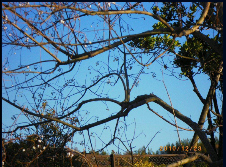
新興住宅地で見つけた白い実の木があり、後で調べてみる ことになりました。