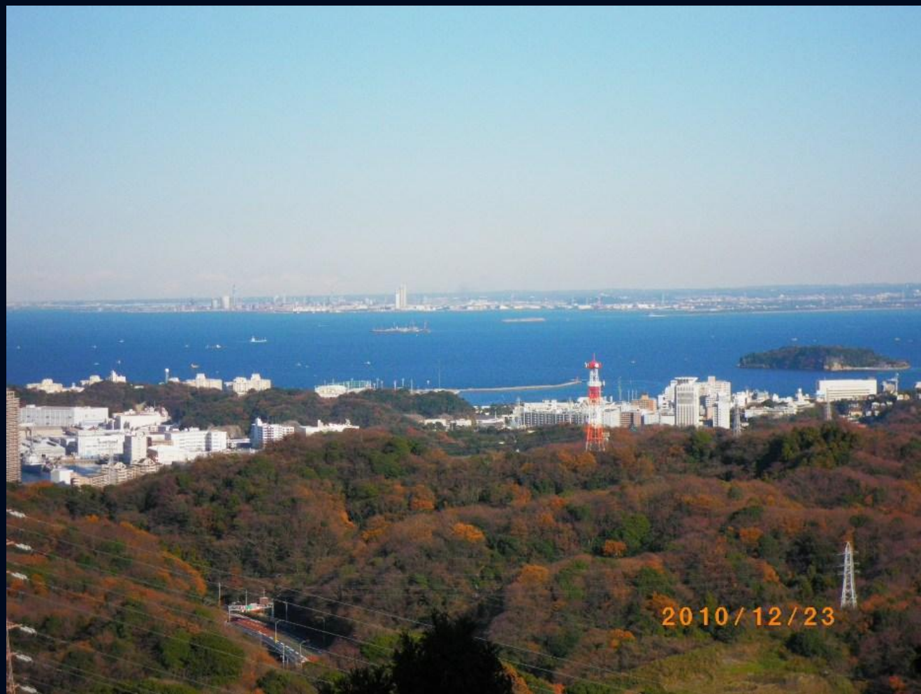
つい先日のウォークの夏島貝山緑地が見え、話に花が咲きました