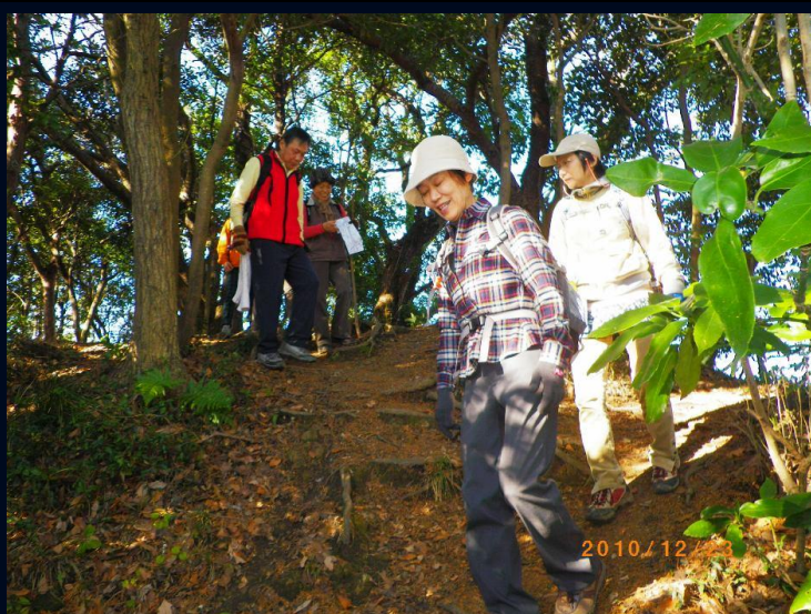
乳頭山をすぎてもまだキツイアップダウンが続きます