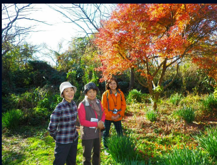
ここには紅葉も残っていました