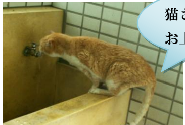
猫さん水飲み お上手