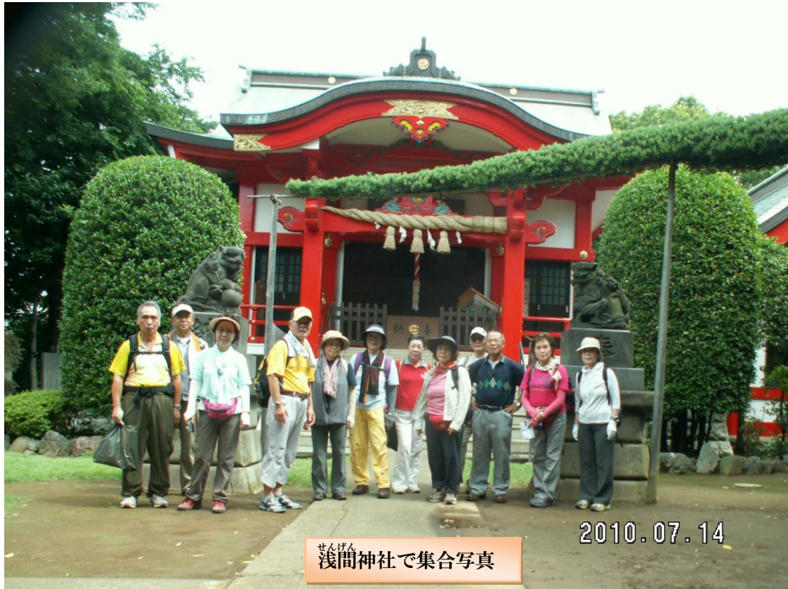
せんげん 浅間神社で集合写真

・久良岐公園：約23万㎡あり、汐見台団地造成に併せて整備され、1973年に開園された。