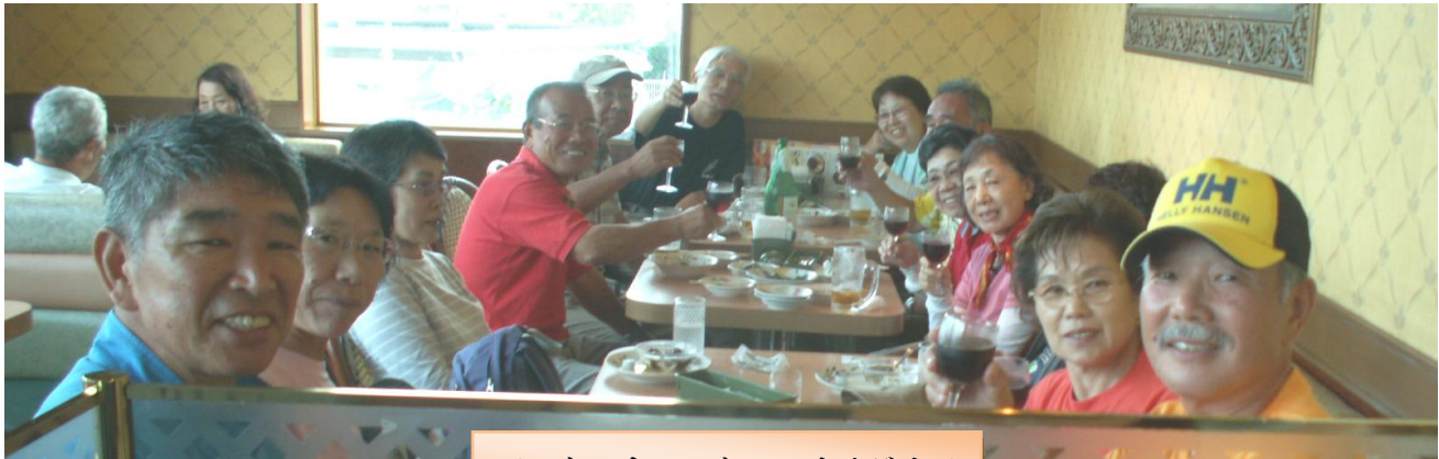
アフターウォーク IN サイゼリア