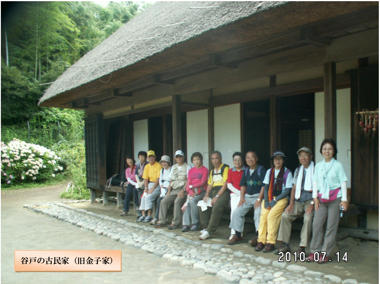
谷戸の古民家 (旧金子家)