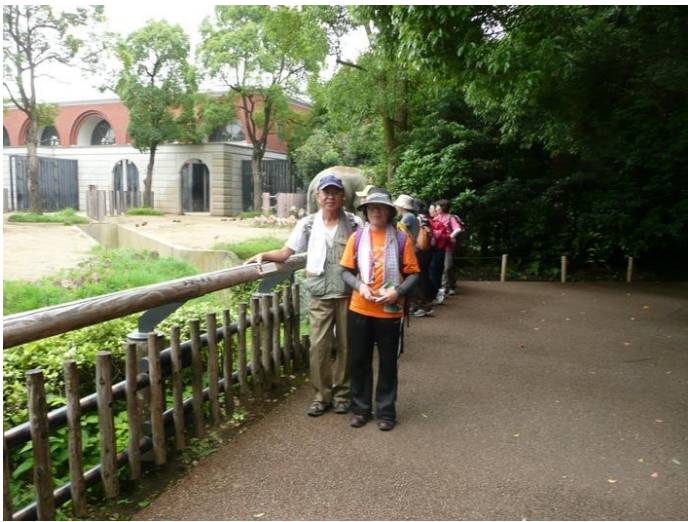
象さんのところで