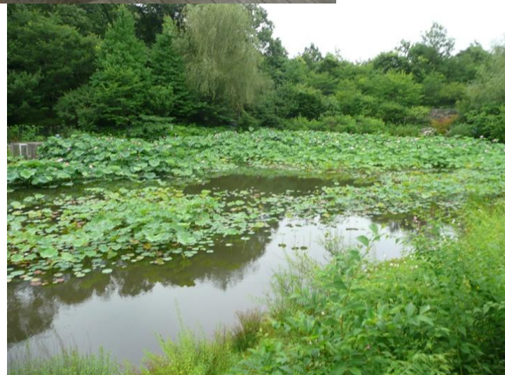
見ごろを迎えた蓮の花