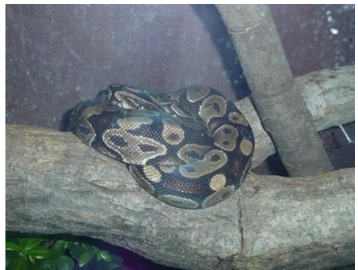
こういうのも居ました ニシキヘビ