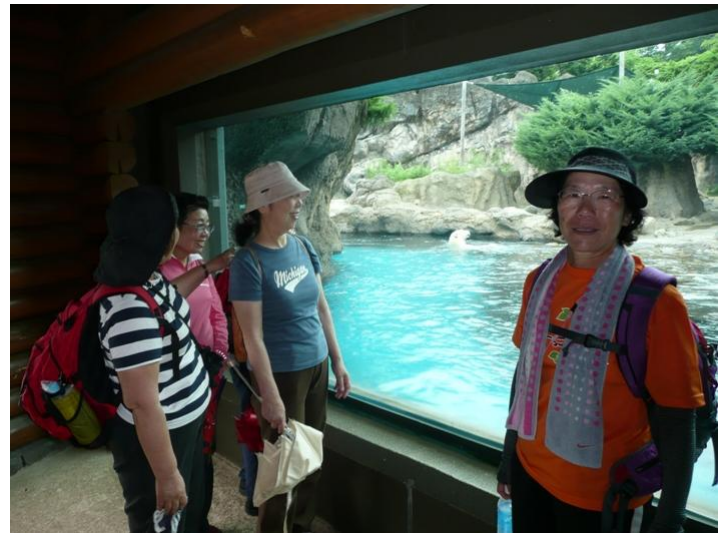
白熊がのんびり背泳ぎを繰り返していました