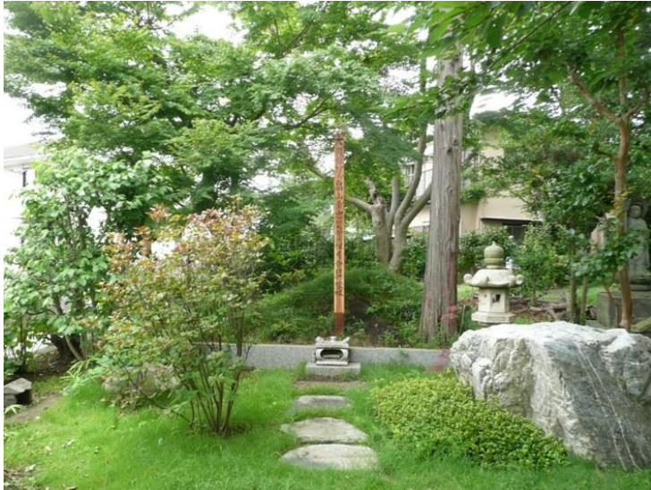
鎌倉幕府の重臣後北条氏に敗れた畠山重忠公の霊廟