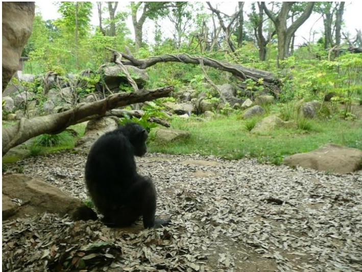
チンパンジー物思いにふけつています 人には飽きたという風情でした