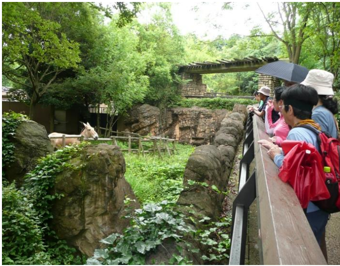
オカピーちゃんです人気がありました