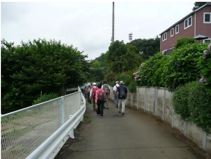
横浜市旭区の名所を後にズーラシアに向かいます

夫は夫たり、婦は婦たりこそ松涼し 今時そんな夫婦いるかなと思いましたが、ウォーキング仲間にも思い当たるご夫婦が結構いますね