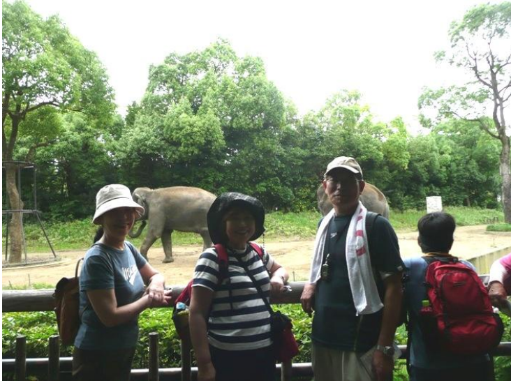
象さんと記念写真