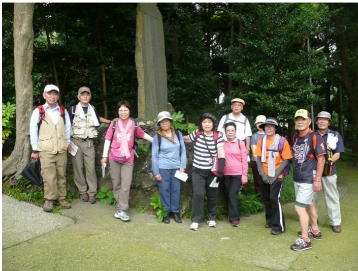
内藤鳴雪の句碑前にて