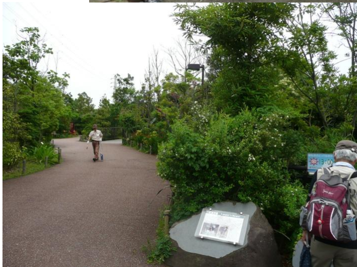
園内のウォーキング道路