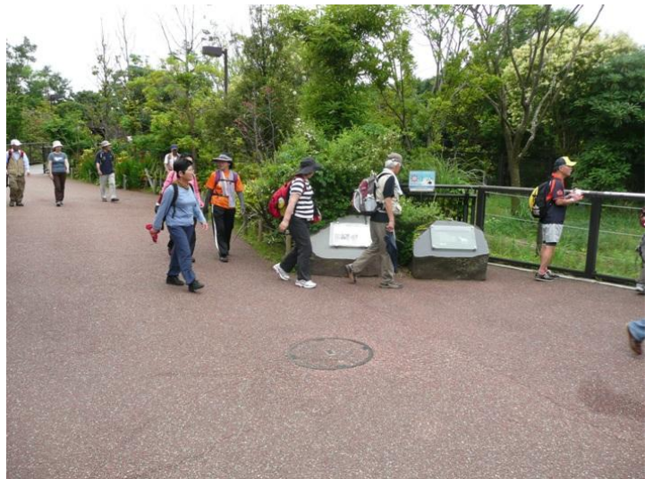
園内はくねくねした通路の配置で観覧コースだけで3 kmもあります