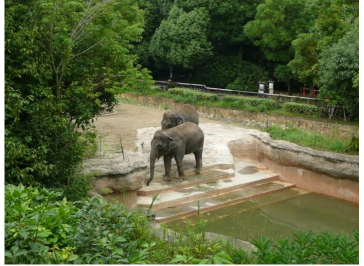
上から見た象さん象は動物園の花形です