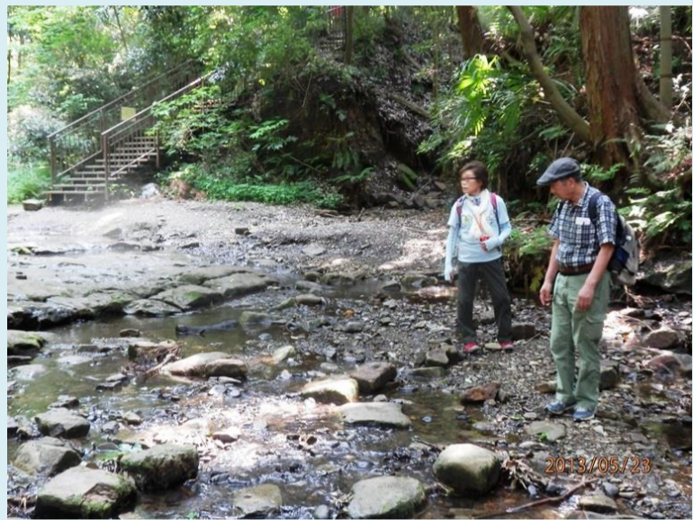
お先にどうぞ いえどうぞお先に