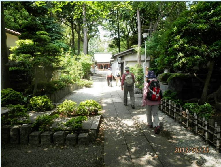
星川杉山神社に向かいます