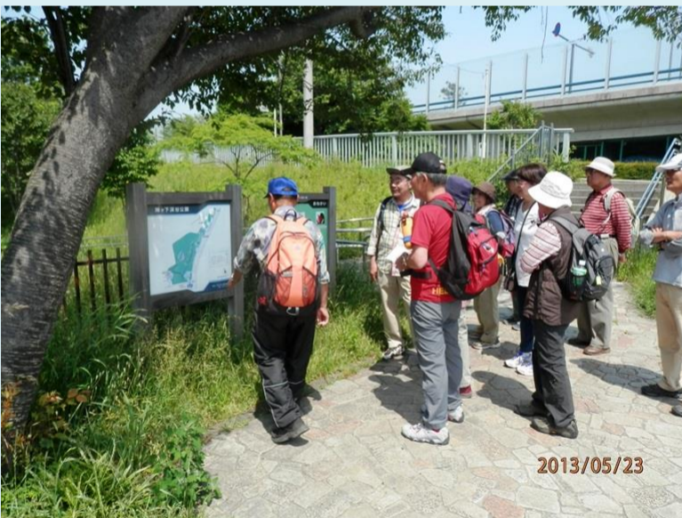
今日のリーダーは解説付きでした