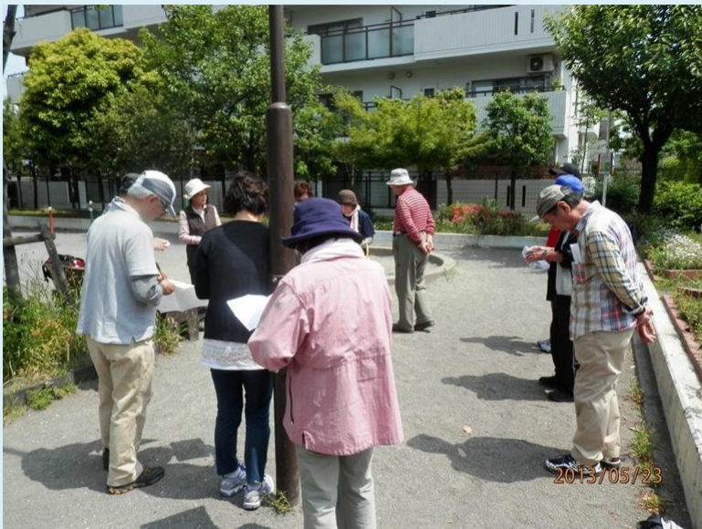
保土ヶ谷駅の地区の公園でコース説明