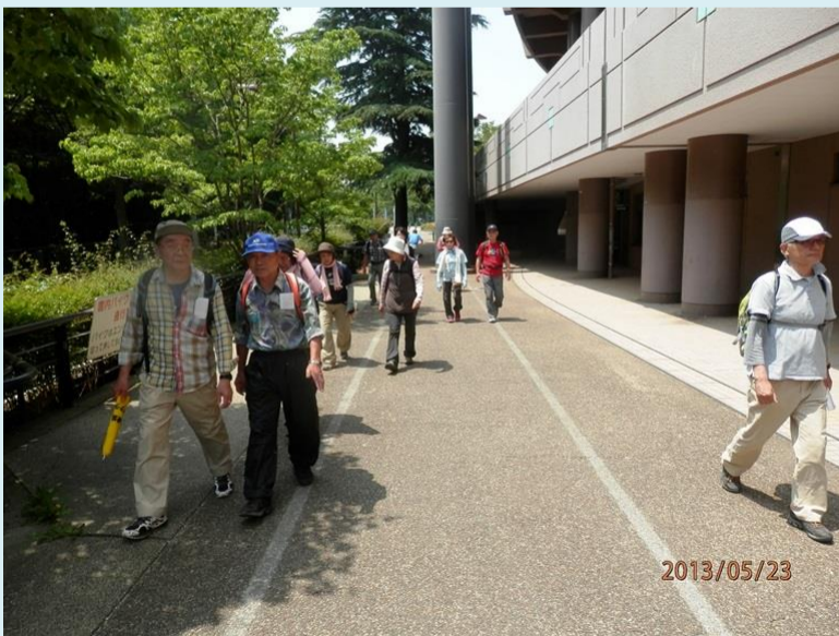
高校野球の保土ヶ谷球場