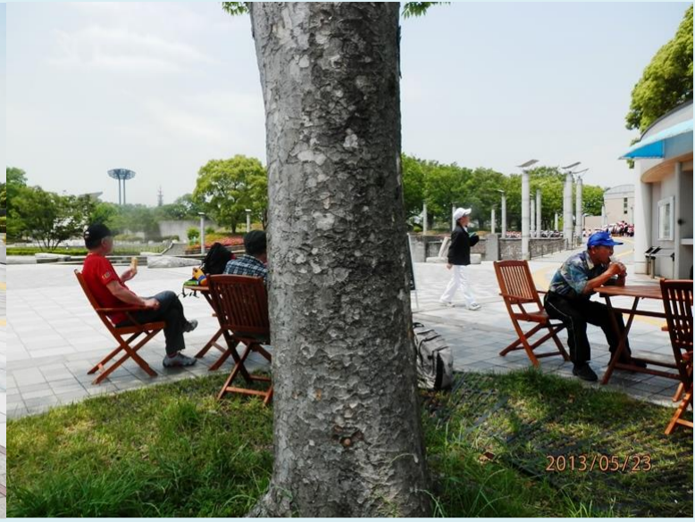
もう動くのがいやになっちゃいそう 心地よい日陰とさわやかな風