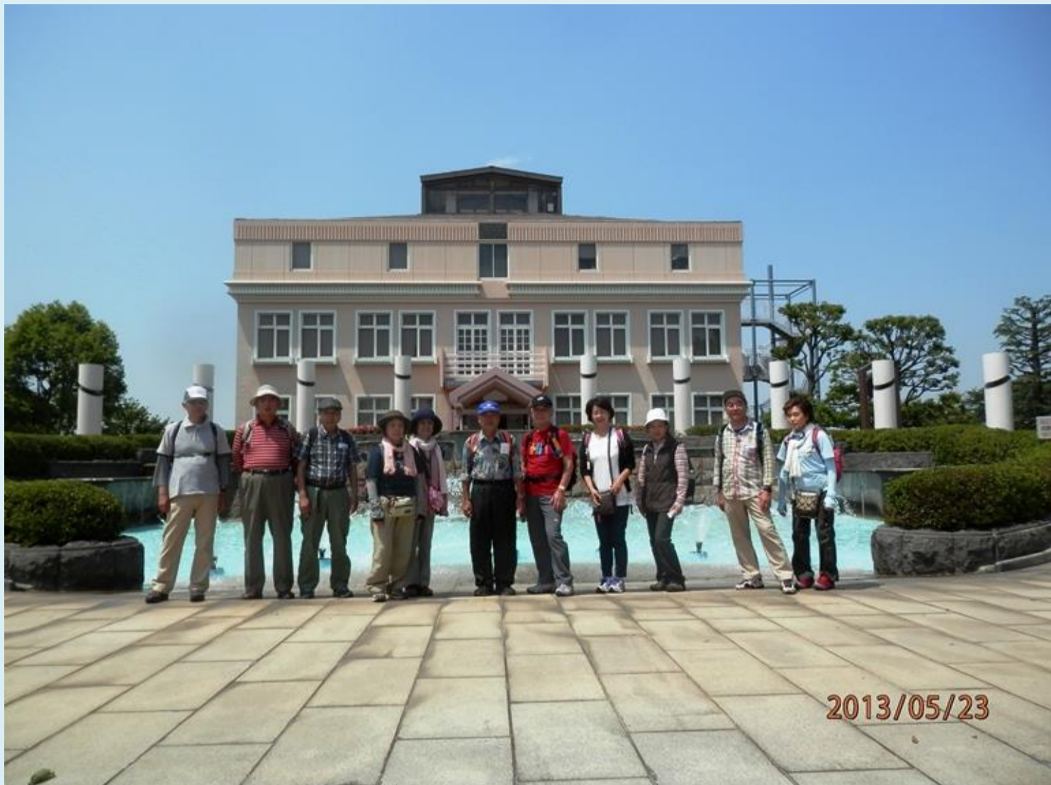
そろい踏み 横浜水道記念館前で