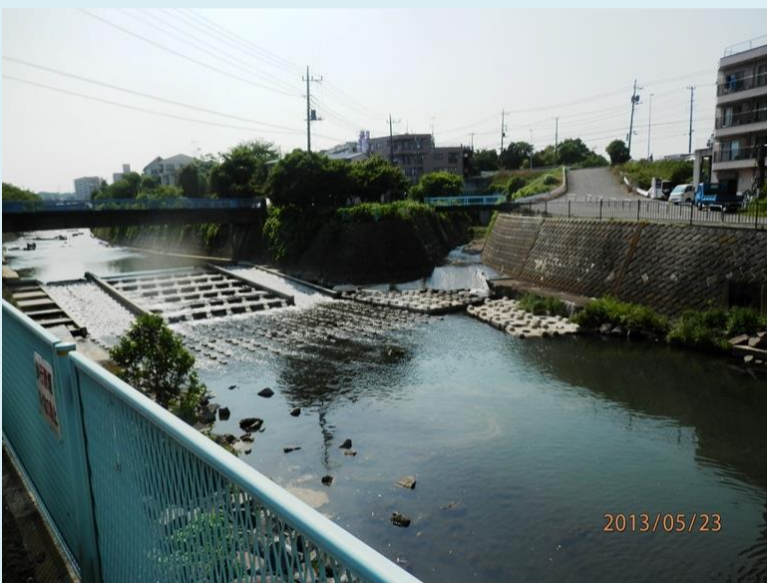
帷子川べりに出ました