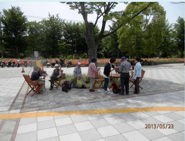
保土ヶ谷公園にて一休み アイスキャンディーおいしかったね