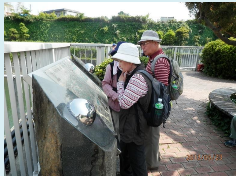
帷子川の分水のダムにて すごい立派な施設