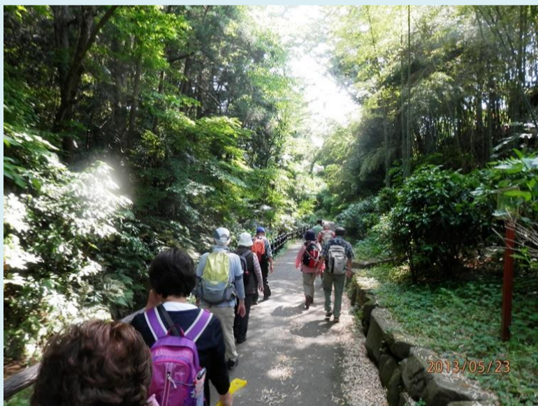
帷子川緑道を歩きます