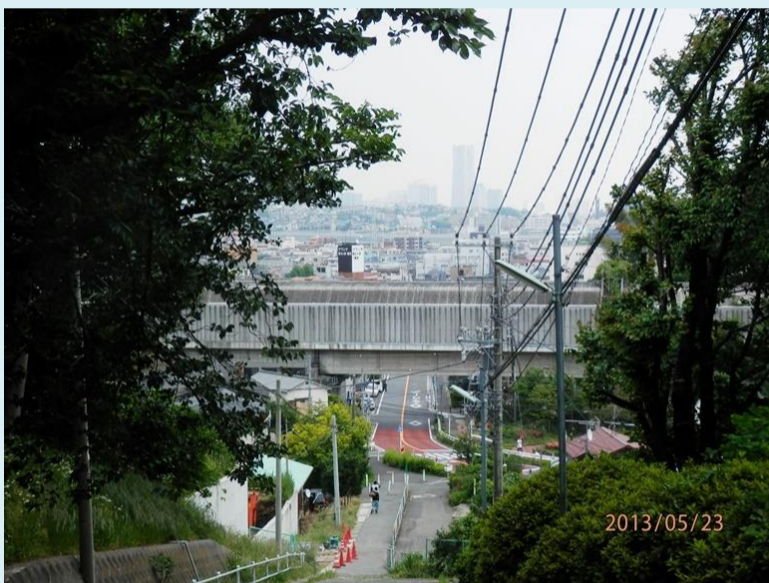
横浜新道のガードをくぐるとしたら、左にそれました