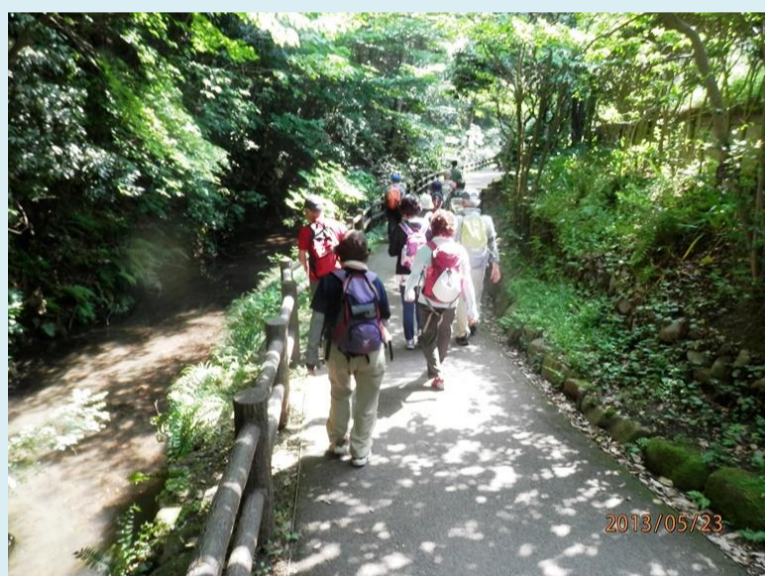
陣が下溪谷の遊歩道に行く こんな日は木陰の道が気持ちいい