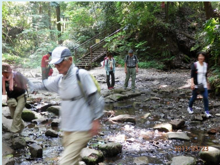
仲さん 足元気を付けて まだ若いもんには負けん