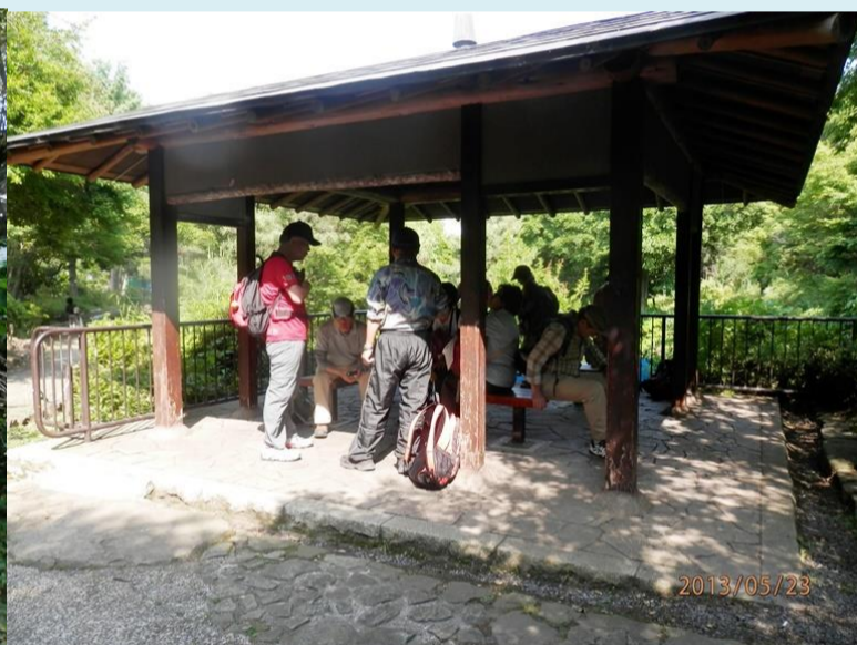
帷子川の東屋にて ここで本日の解散場所となりました。 13000 歩結構歩きました